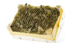
Caja de 1 kg / 1 kg box