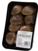
Bandeja / Tray