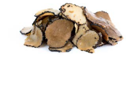
Lata 100 g / Caja 6 u. 100 g can / 6 unit box Ref.: 70036