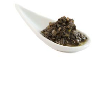
Tarro cristal 90 g / Caja 6 u. 90 g Glass jar / 6 unit box Ref.: 80401