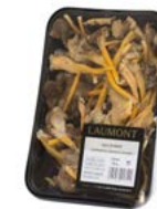
Bandeja / Tray