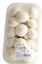
Bandeja / Tray