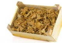
Caja de 1 kg / 1 kg box