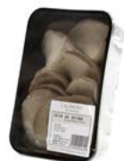
Bandeja / Tray