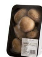
Bandeja / Tray