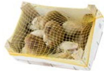
Caja de 1 kg / 1 kg box