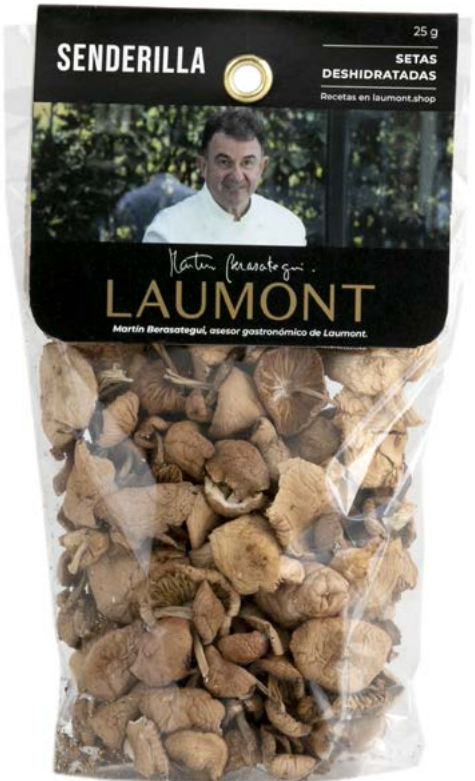
Bolsa 25 g 25 g Bag Ref.: 23116

Retail / Dehydrated / Berasategui collection