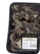
Bandeja / Tray