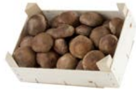
Caja / Box