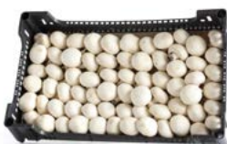
A granel / In bulk