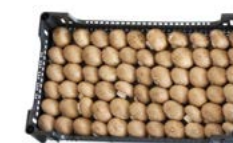
A granel / In bulk