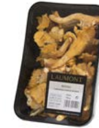
Bandeja / Tray