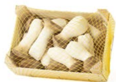
Caja de 1 kg / 1 kg box

La seta de cardo ( Pleurotus eryngii ) tiene un alto contenido de vitaminas B2 y B3, lo que la convierte en una aliada para el equilibrio de la presión sanguínea. Al ser un 91,4% agua, su consumo contribuye a la correcta hidratación de nuestro organismo.