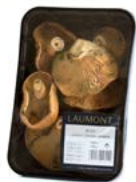
Bandeja / Tray