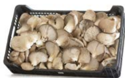
A granel / In bulk