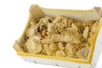
Caja de 1 kg / 1 kg box