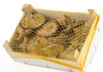
Caja de 1 kg / 1 kg box