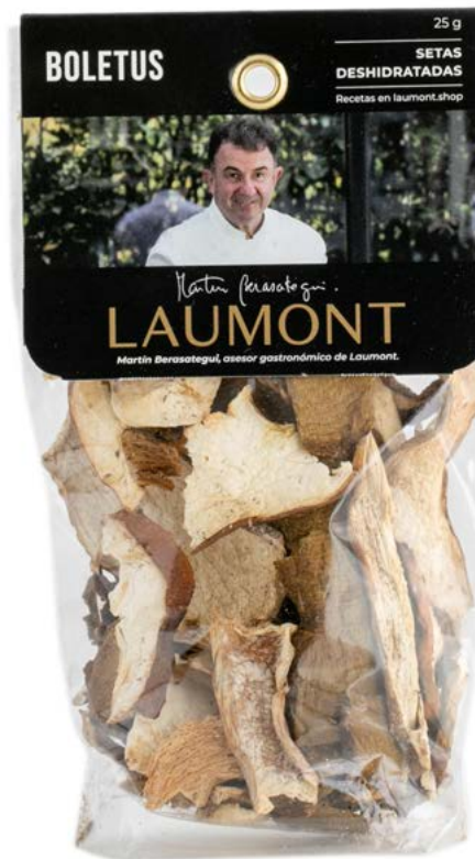
Bolsa 25 g 25 g Bag Ref.: 20916