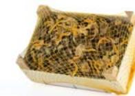
Caja de 1 kg / 1 kg box