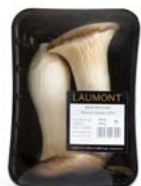
Bandeja 200 g / 200 g tray