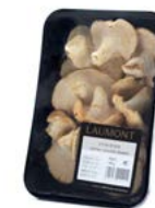
Bandeja / Tray