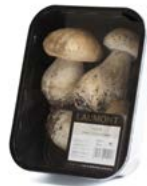
Bandeja / Tray