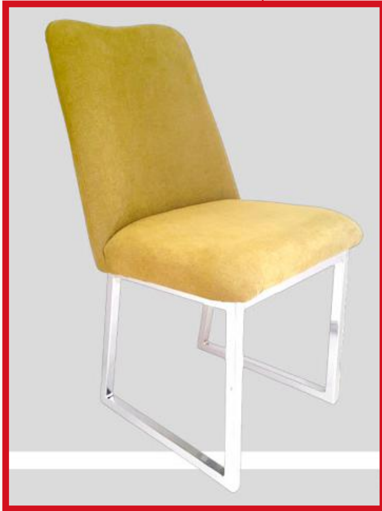
IRLANDA II-A Precio: Bs. 800.- Colores: Elección