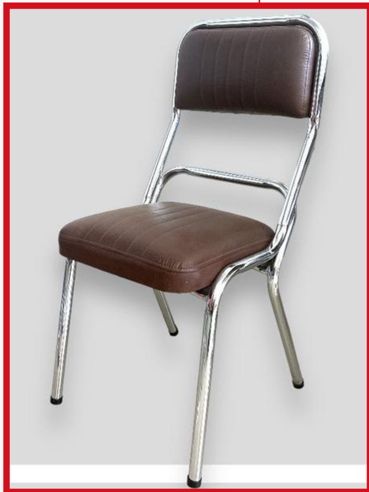
DOBLE ESPALDAR Precio: Bs. 350.- Colores: Elección