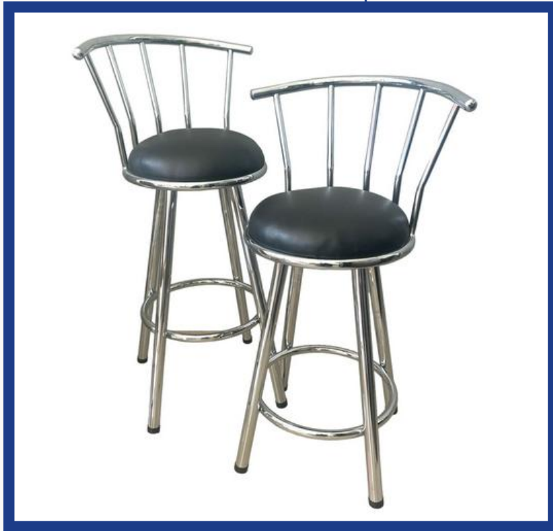
CAJERO CROMADO Precio: Bs. 480.- Colores: Elección