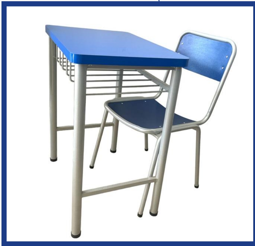
CONJUNTO EDUCATIVO I Precio: Bs. 650.- Colores: Elección