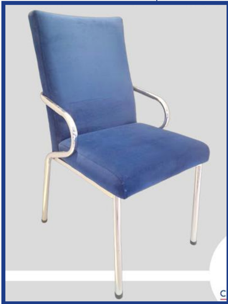
PRADA Precio: Bs. 750.- Colores: Elección