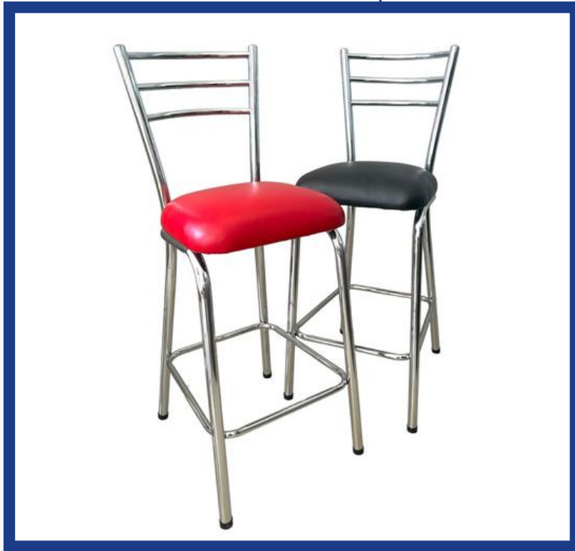
BANDERITA CROMADO Precio: Bs. 380.- Colores: Elección