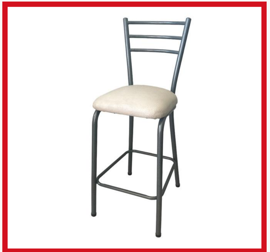
BANDERITA PINTADO Precio: Bs. 350.- Colores: Elección