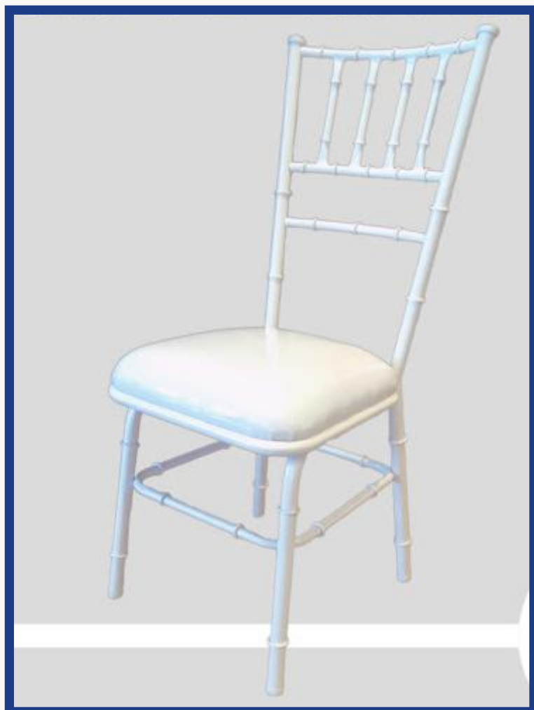
TIFFANY Precio: Bs. 400.- Colores: Elección