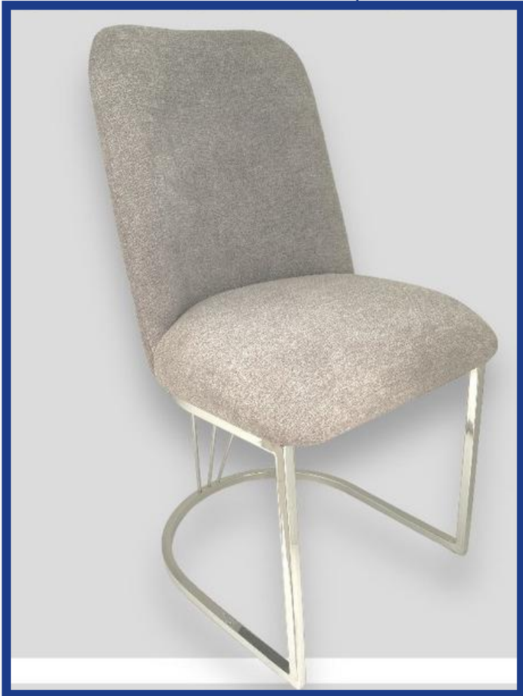
IRLANDA III Precio: Bs. 800.- Colores: Elección