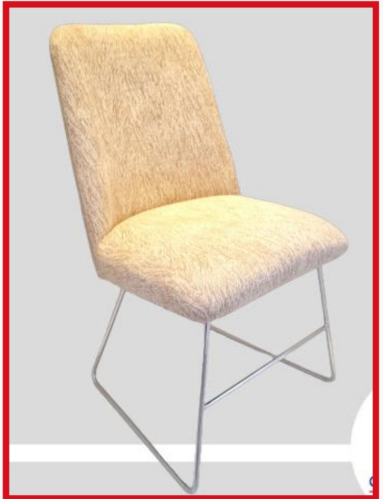
FRIDA Precio: Bs. 700.- Colores: Elección