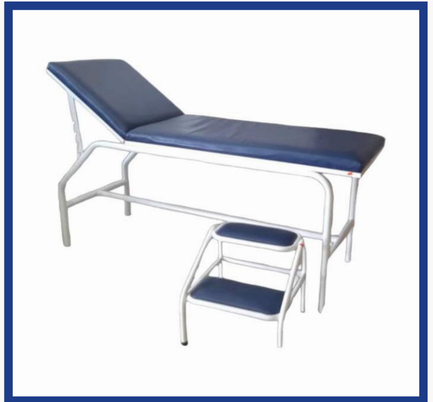
CAMILLA MOVIBLE Precio: Bs. 1.400.- Colores: Elección