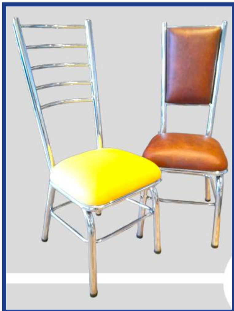
ESCALERA Precio: Bs. 400.- Colores: Elección