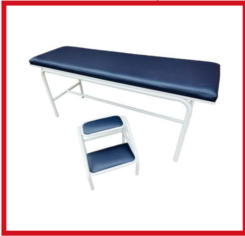
CAMILLA FIJA Precio: Bs. 1.200.- Colores: Elección