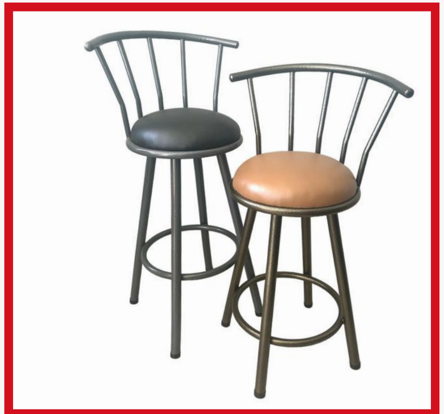
CAJERO PINTADO Precio: Bs. 450.- Colores: Elección