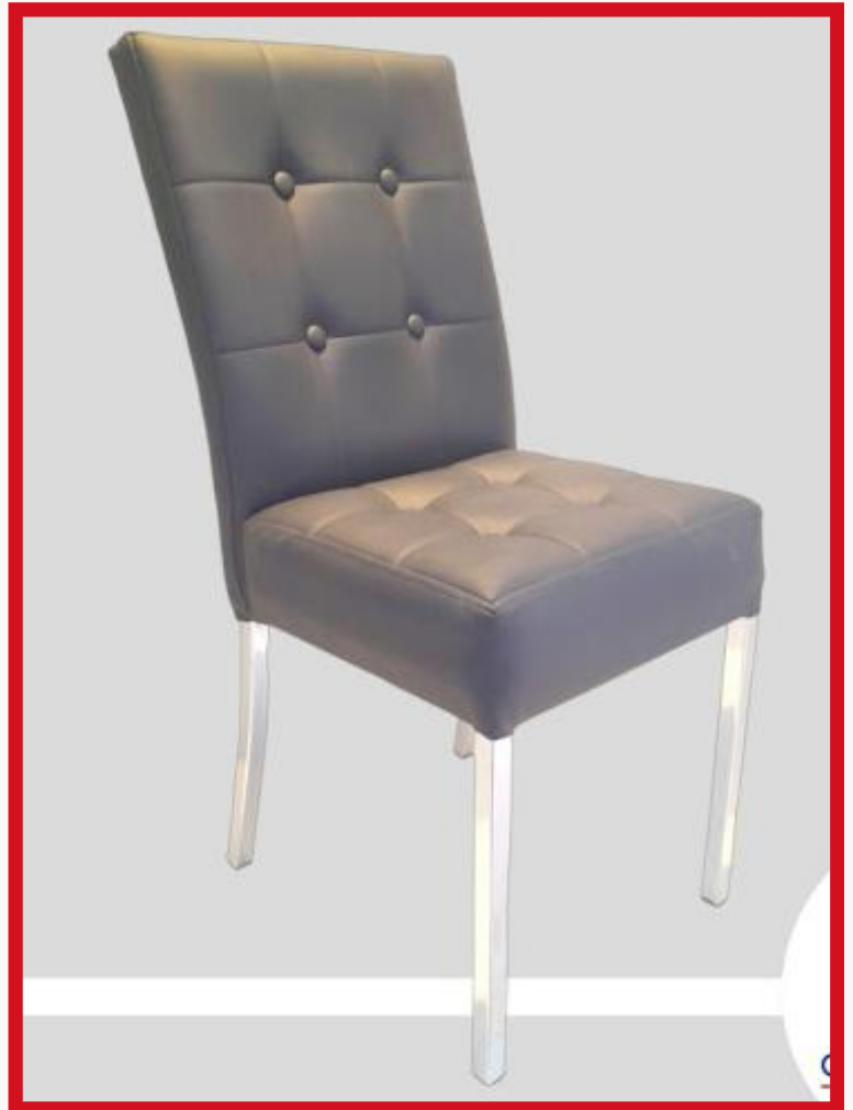
LONDRES Precio: Bs. 750.- Colores: Elección