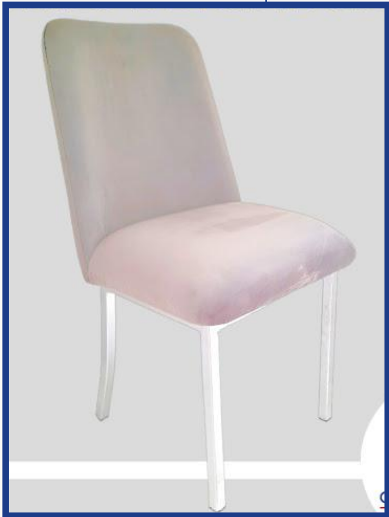
IRLANDA I-A Precio: Bs. 700.- Colores: Elección