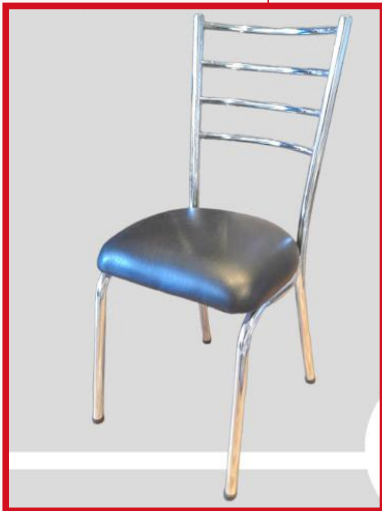
BANDERITA Precio: Bs. 350.- Colores: Elección