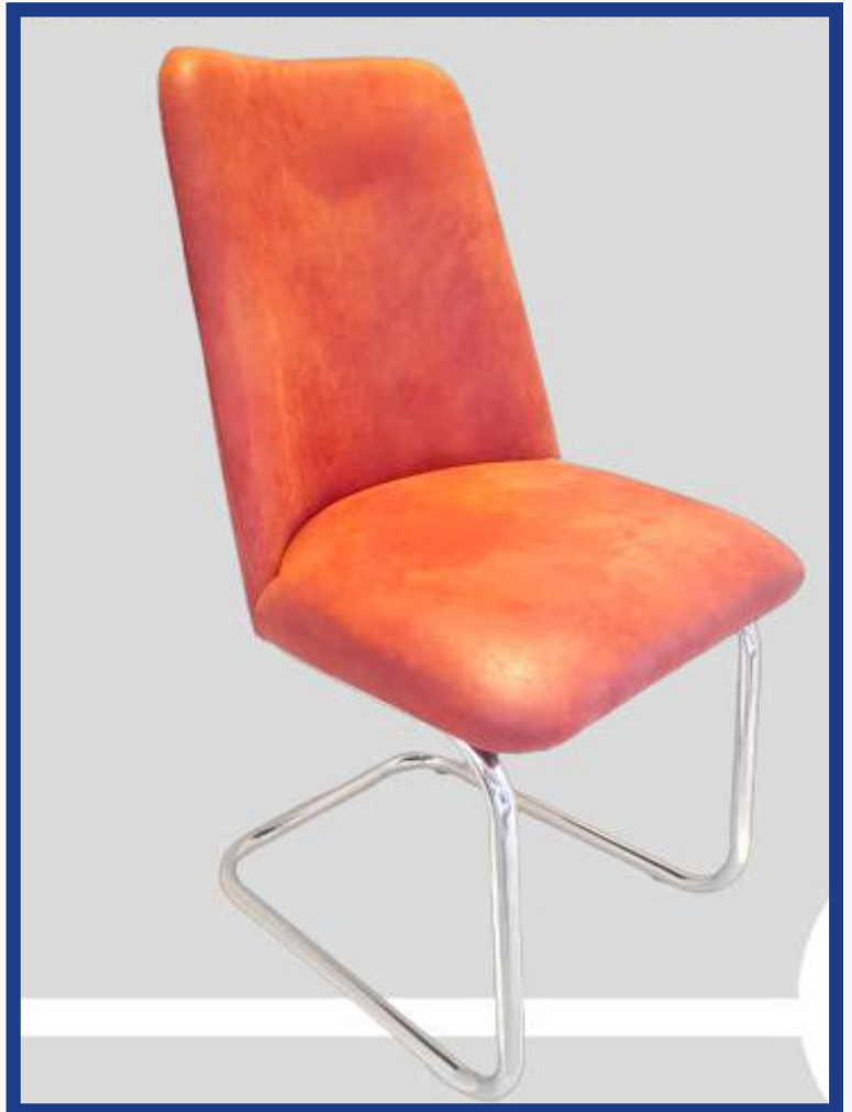
FLOTANTE Precio: Bs. 700.- Colores: Elección