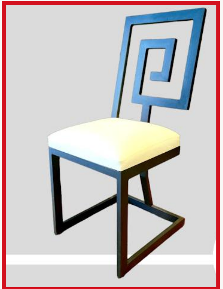
ESPIRAL Precio: Bs. 480.- Colores: Elección