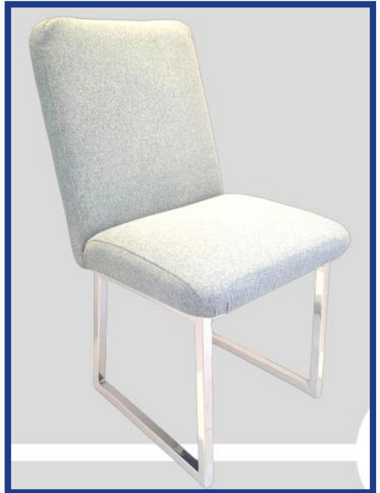
IRLANDA II-B Precio: Bs. 800.- Colores: Elección