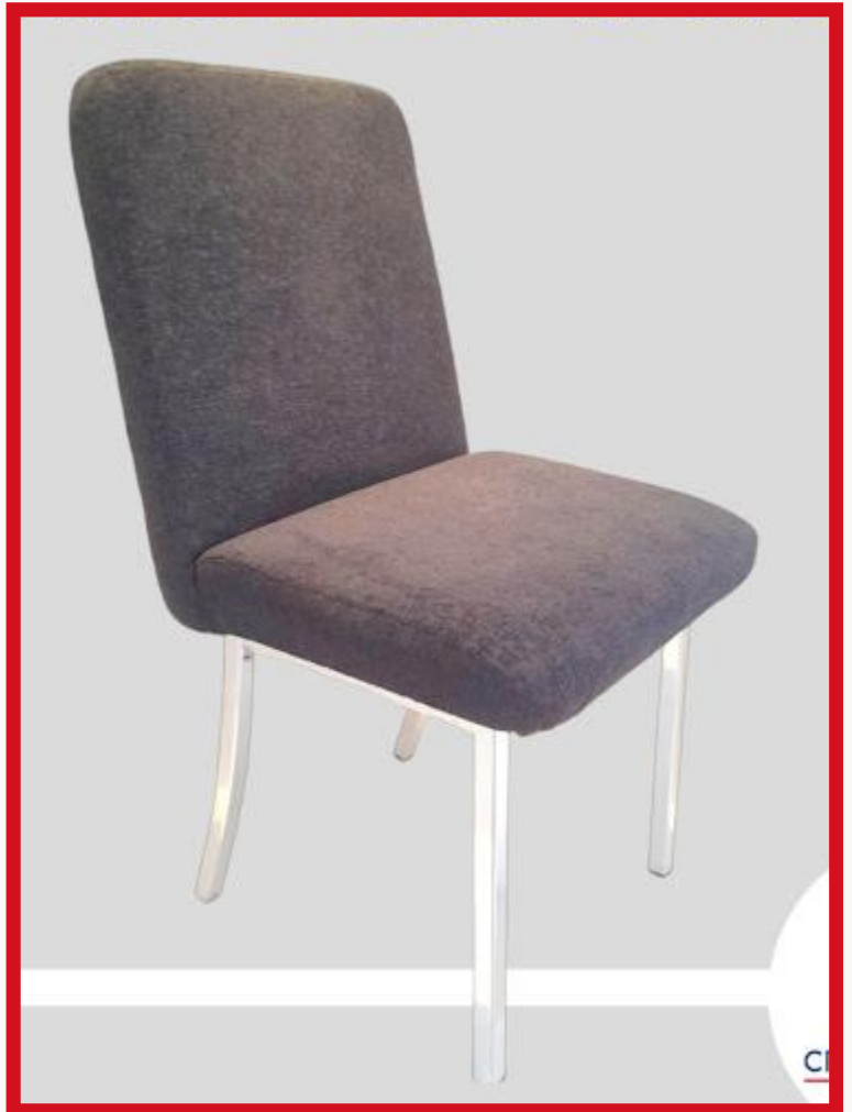
IRLANDA I-B Precio: Bs. 700.- Colores: Elección