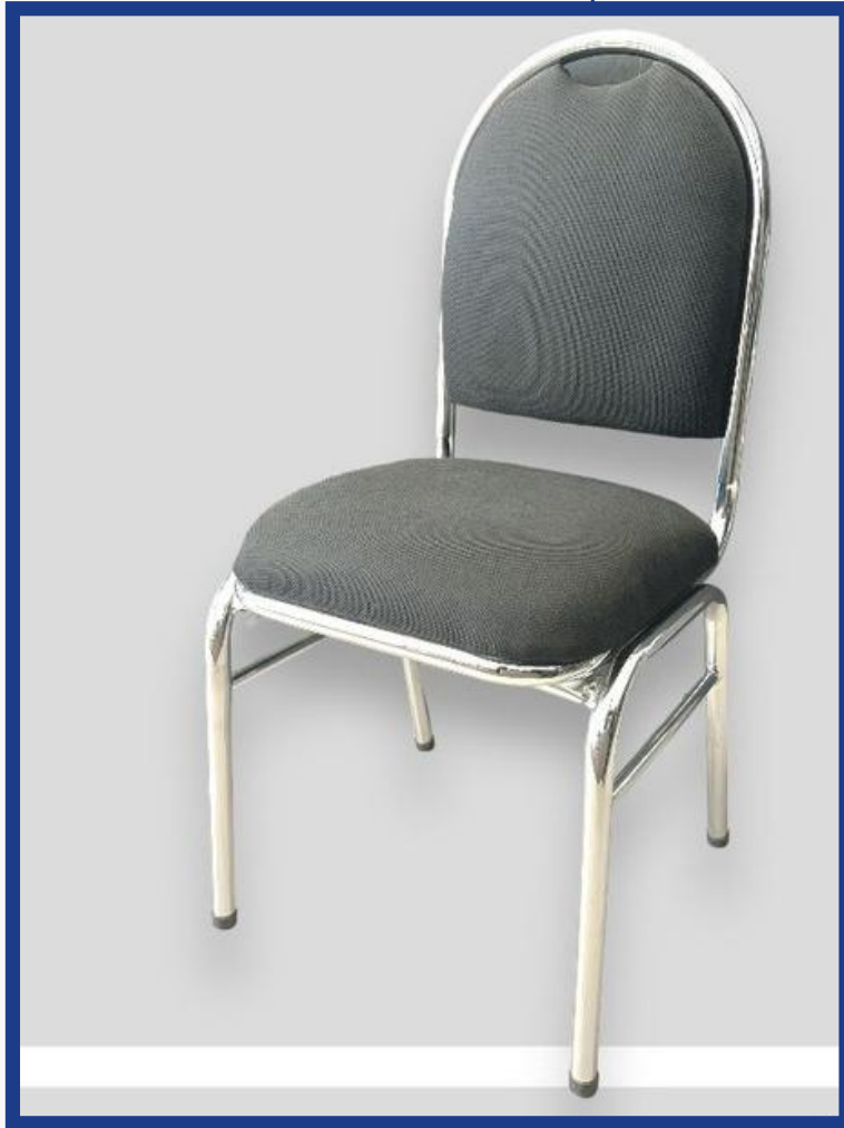
AUDITORIO Precio: Bs. 450.- Colores: Elección