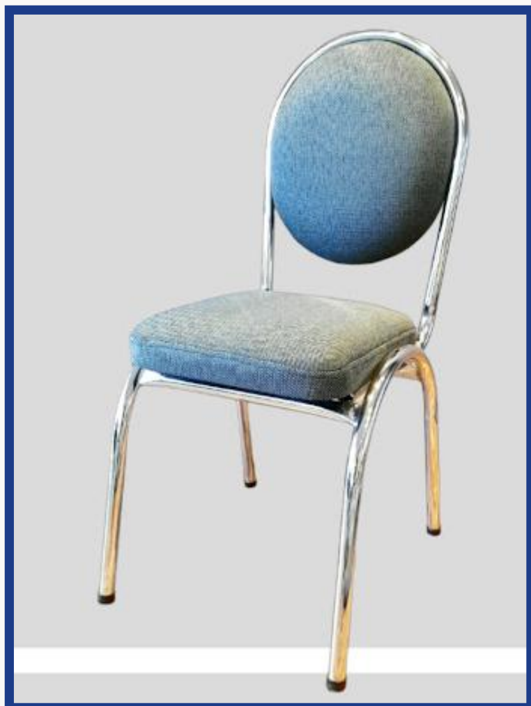
OVALADA Precio: Bs. 350.- Colores: Elección