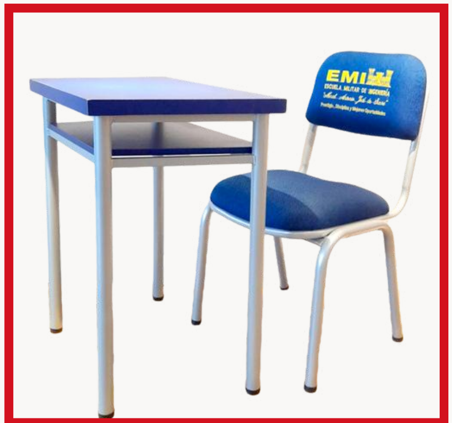
CONJUNTO EDUCATIVO II Precio: Bs. 1.200- Colores: Elección