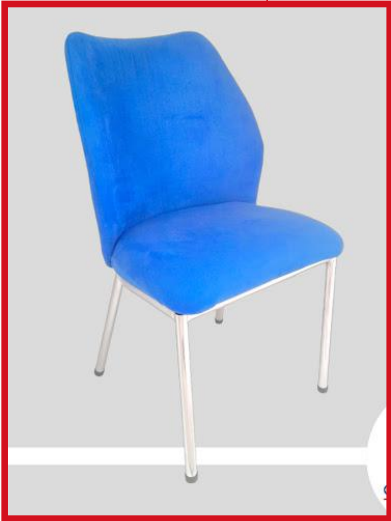
VENUS Precio: Bs. 750.- Colores: Elección