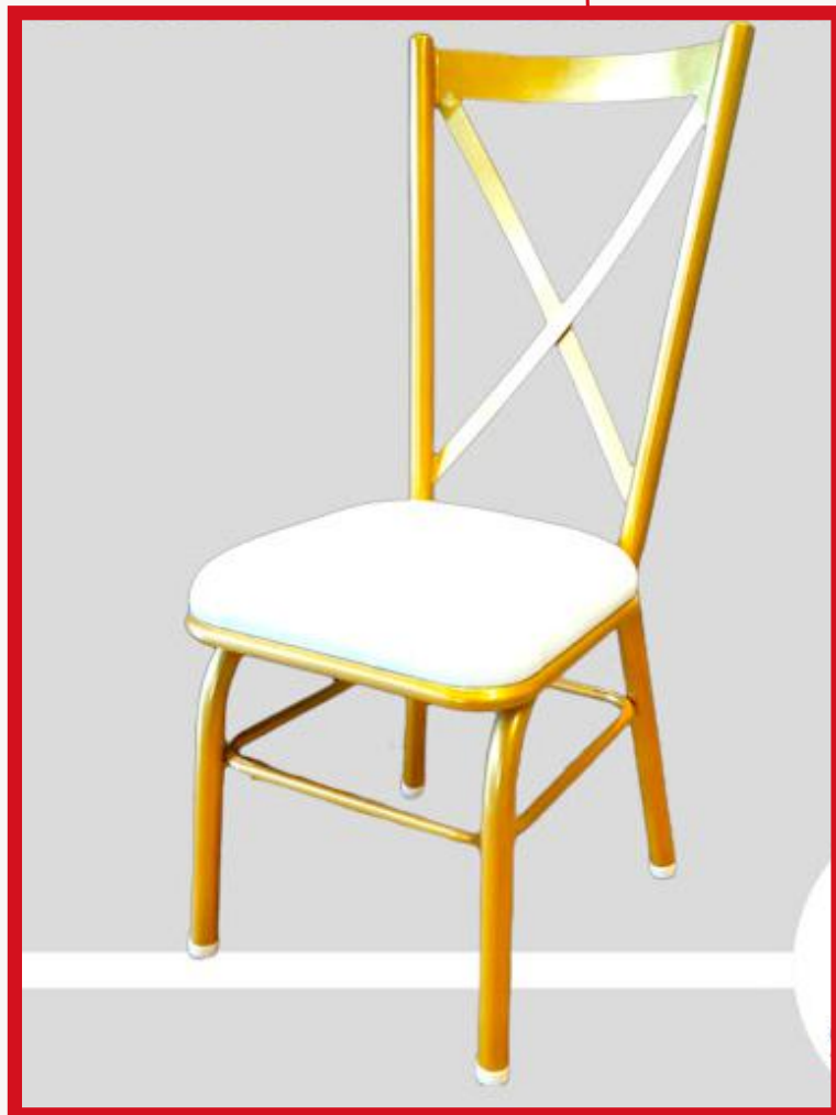
CROSBACK Precio: Bs. 400.- Colores: Elección