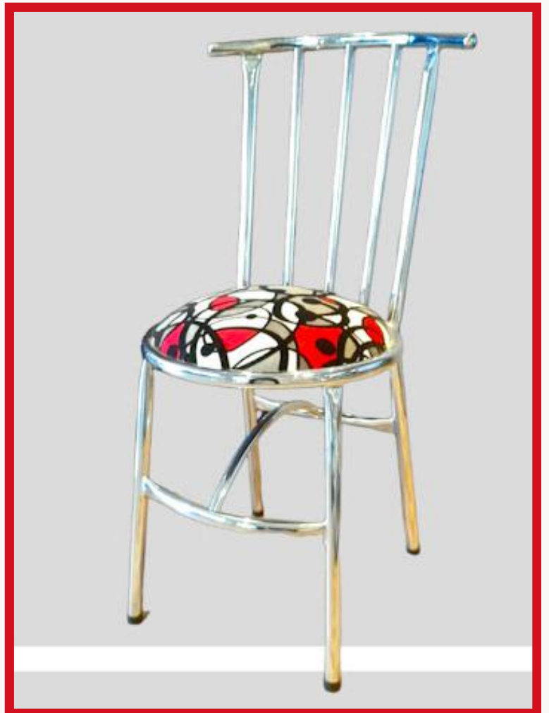
JULIETA Precio: Bs. 350.- Colores: Elección