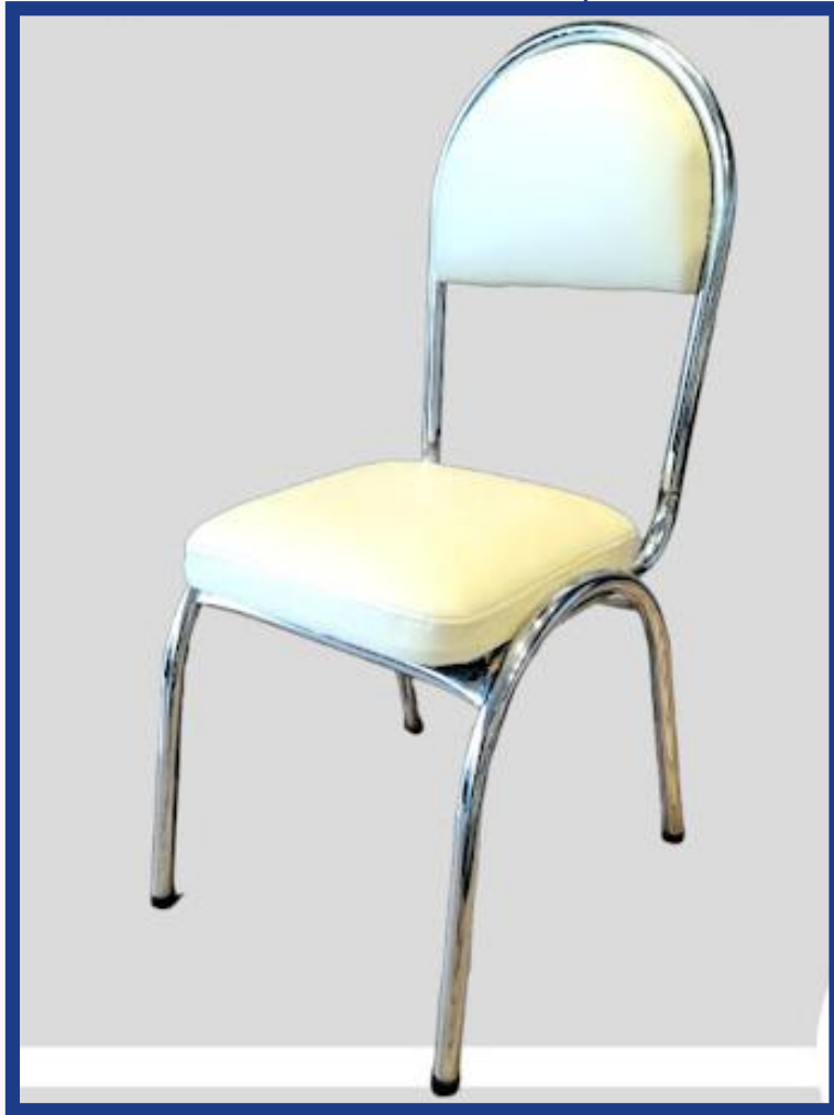
MEDIA LUNA Precio: Bs. 350.- Colores: Elección