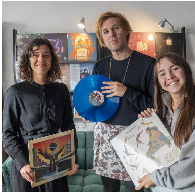
↑ Disquaire, lieu d'exposition, espace de travail... le Salon est un eldorado pour les créateurs.

Poussez les portes du Conservatoire et découvrez l'étendue de son offre pédagogique lors d'une journée foisonnante de propositions artistiques, avec près de 80 rendez-vous (cours publics, concerts, ateliers, auditions...) illustrant la pluralité des enseignements dispensés au sein de l'établissement. Samedi 3 février à partir de 13h, portes ouvertes sur les deux sites du Conservatoire : site Hoche - 26, rue Hoche (métro Sainte-Anne), au Blosne - place Jean-Normand (métro Le Blosne).