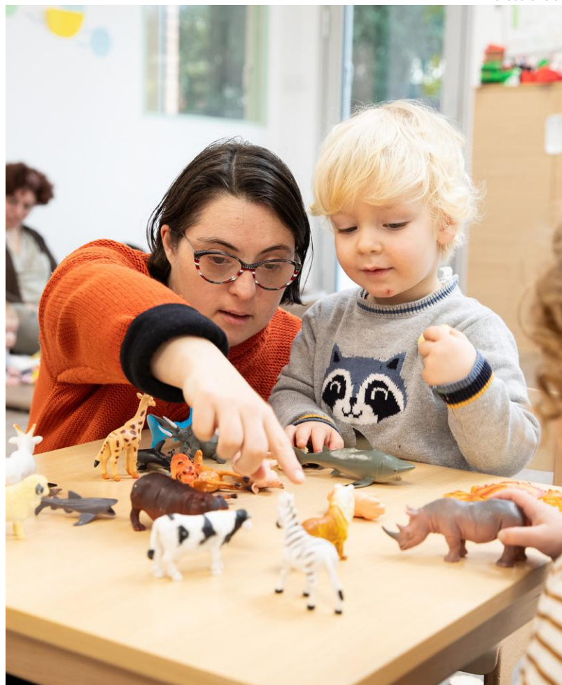
↑ Parmi les équipes des crèches Tournesol, des personnes en situation de handicap.