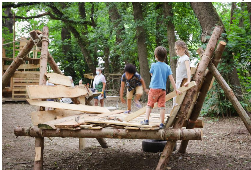
↑ Les terrains d'aventure, espaces de liberté pour les enfants.