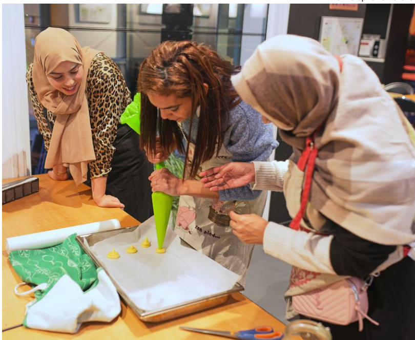
↑ Des pains et biscuits fabriqués avec amour... et vendus à prix solidaires!