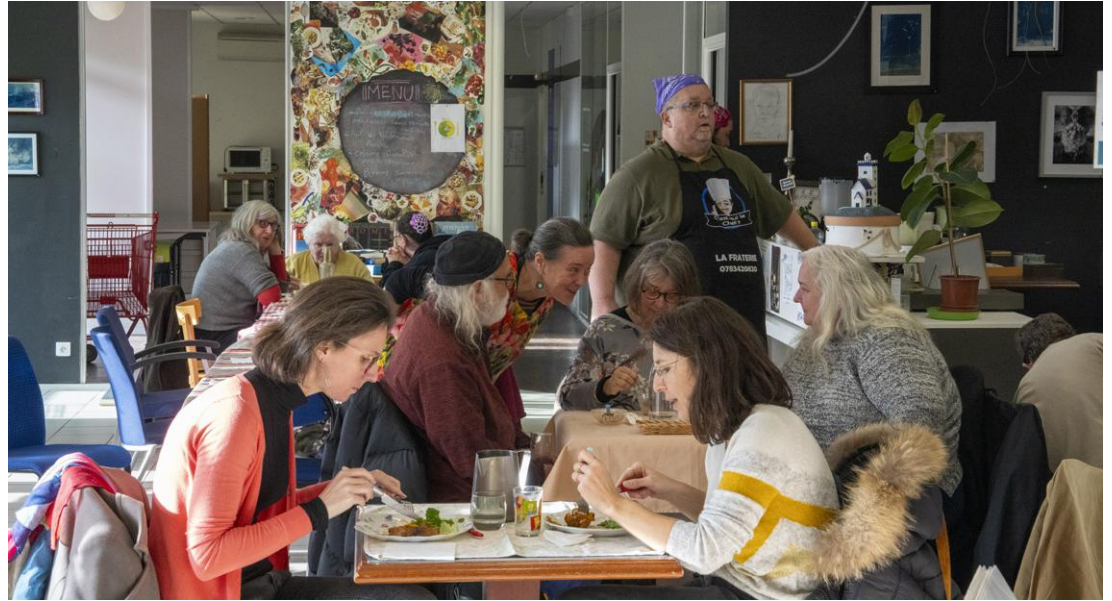
↑ Une vingtaine de repas sont préparés et servis par des personnes souffrant de troubles psychiques et deux bénévoles.

❖ En deux ans, la Fraterie a accueilli 32 personnes en souffrance psychique : 3 ont rebondi en formation, 2 en emploi adapté et 1 en stage d'insertion à Pépites, restaurant coopératif également installé à Maurepas.