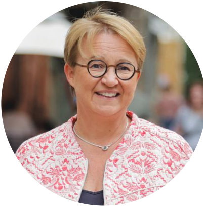
Nathalie Appéré, maire de Rennes, présidente de Rennes Métropole