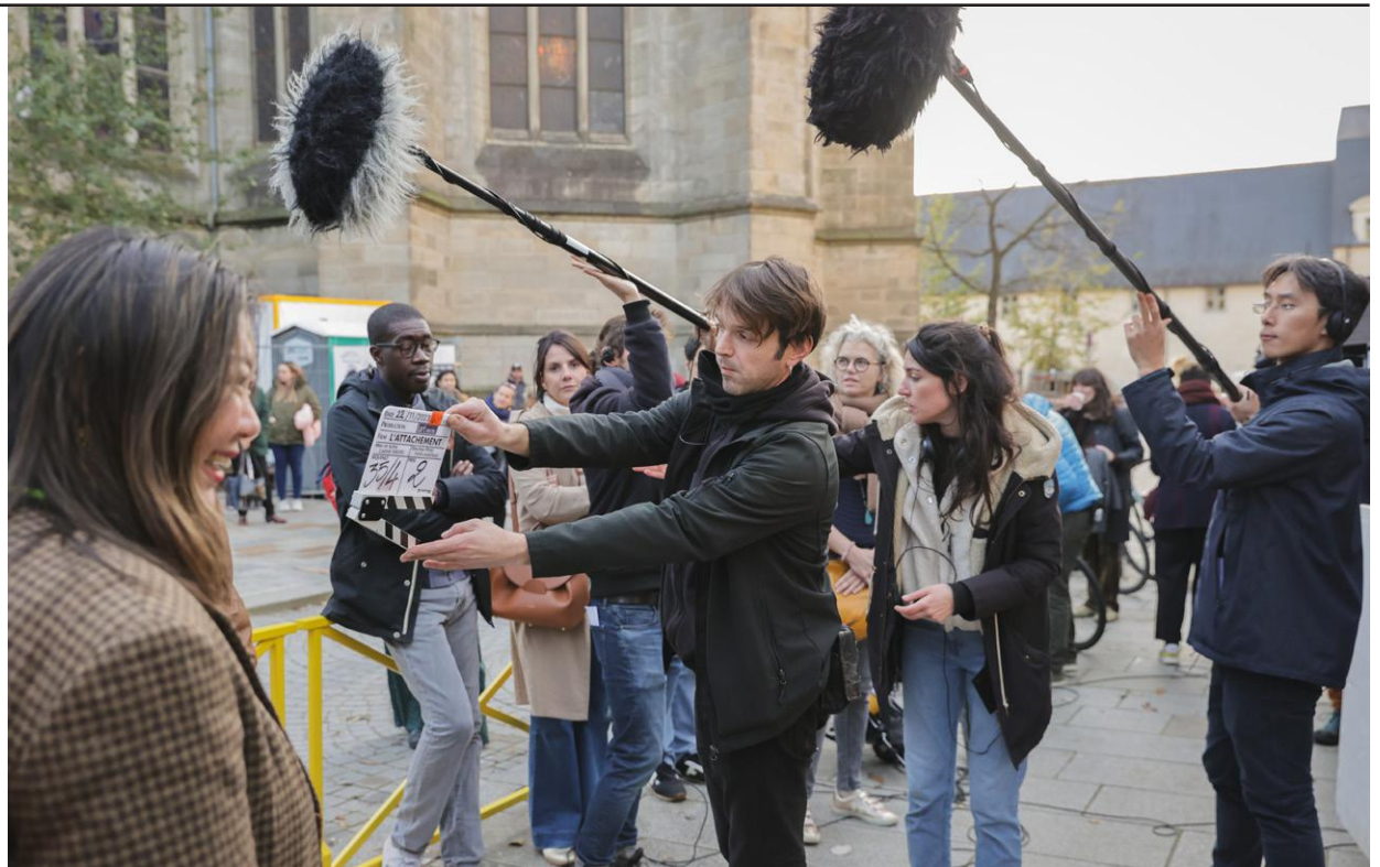
↑ Rue de Monfort, fin novembre, sur le tournage du film L'Attachement , de Carine Tardieu.

➤ Dimanche 14 janvier à 11h, cinéma L'Arvor. Gratuit, sans réservation, dans la limite des places disponibles.