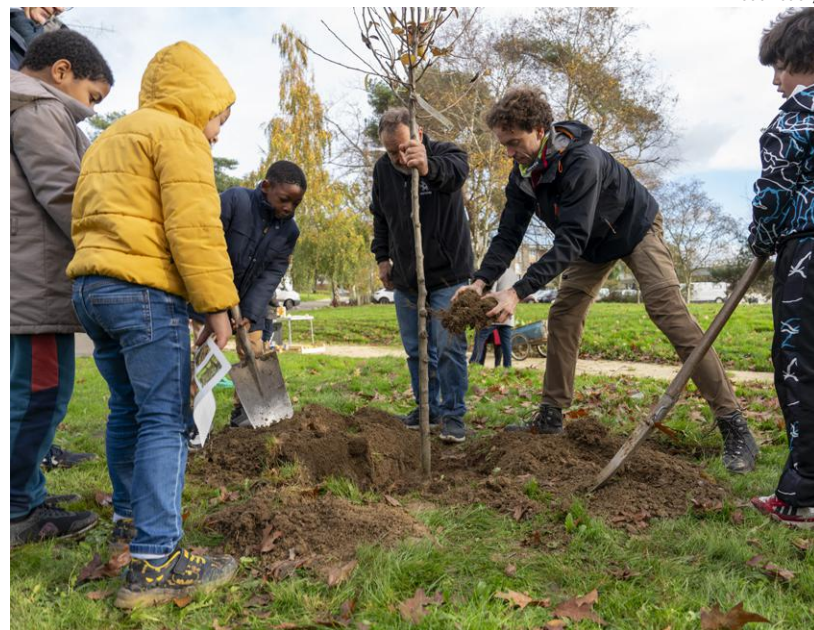
↑ Plantation d'arbres fruitiers avec les enfants du quartier, au Blossne.