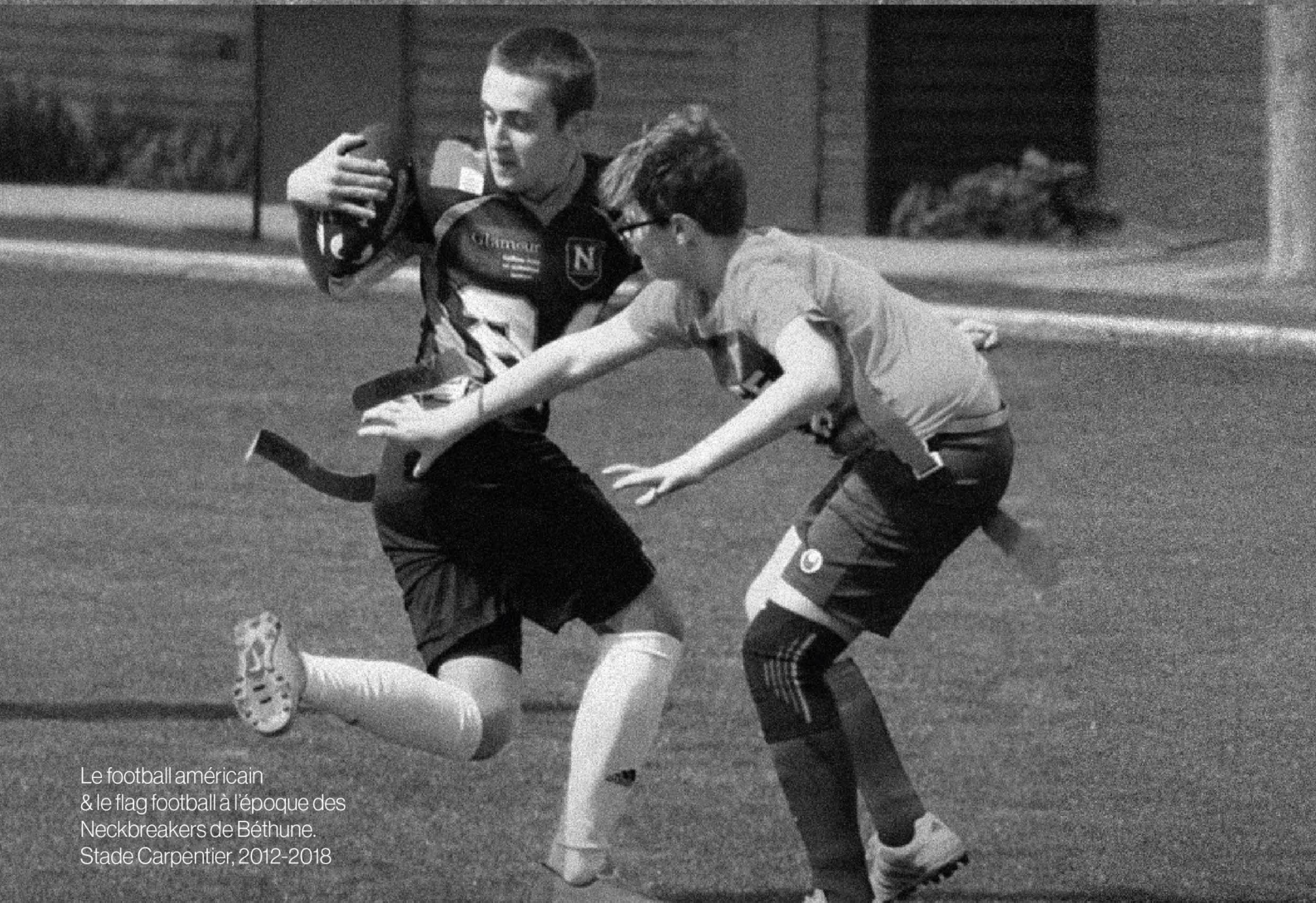
Le football américain & le flag football à l'époque des Neckbreakers de Béthune. Stade Carpentier. 2012-2018