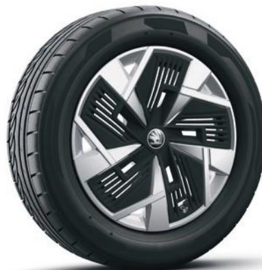
Cerchi in lega leggera 18" «Mazeno Aero», argento con copricerchi «Aero» nero