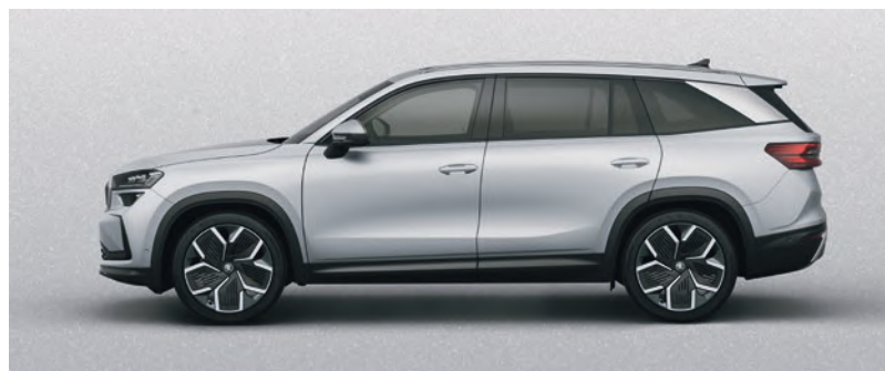
Argento Brilliant, metallizzato