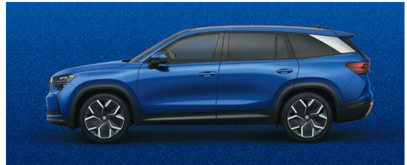
Blu Race, metallizzato