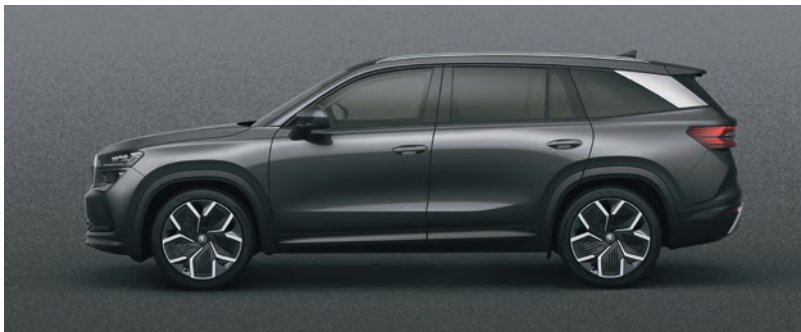
Grigio grafite, metallizzato