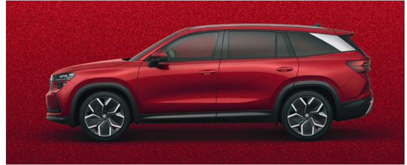
Rosso Velvet, metallizzato