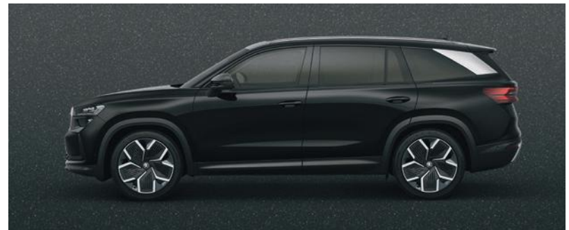
Nero Magic, metallizzato