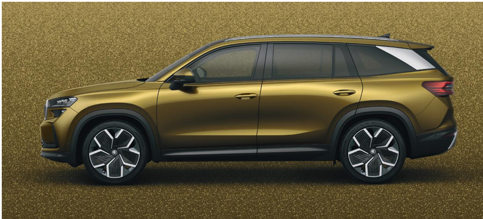
Oro Bronx, metallizzato