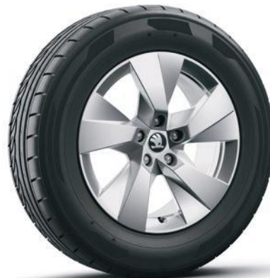
Cerchi in lega leggera 17" «Paget Aero», argento