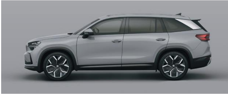
Grigio Steel, tinta unita