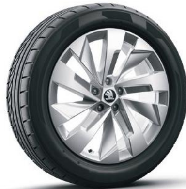
Cerchi in lega leggera 19" «Rapeto Aero», argento