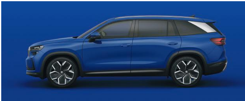
Blu Energy, tinta unita