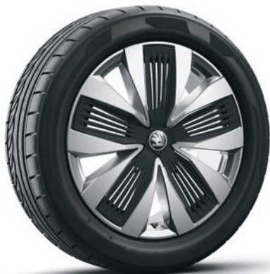
Cerchi in lega leggera 19" «Talgar Aero», argento con copricerchi «Aero» nero