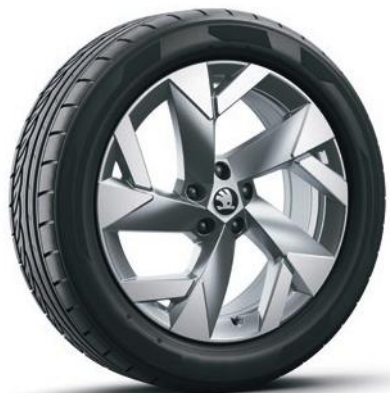
Cerchi in lega leggera 19" «Tirsuli Aero», antracite *