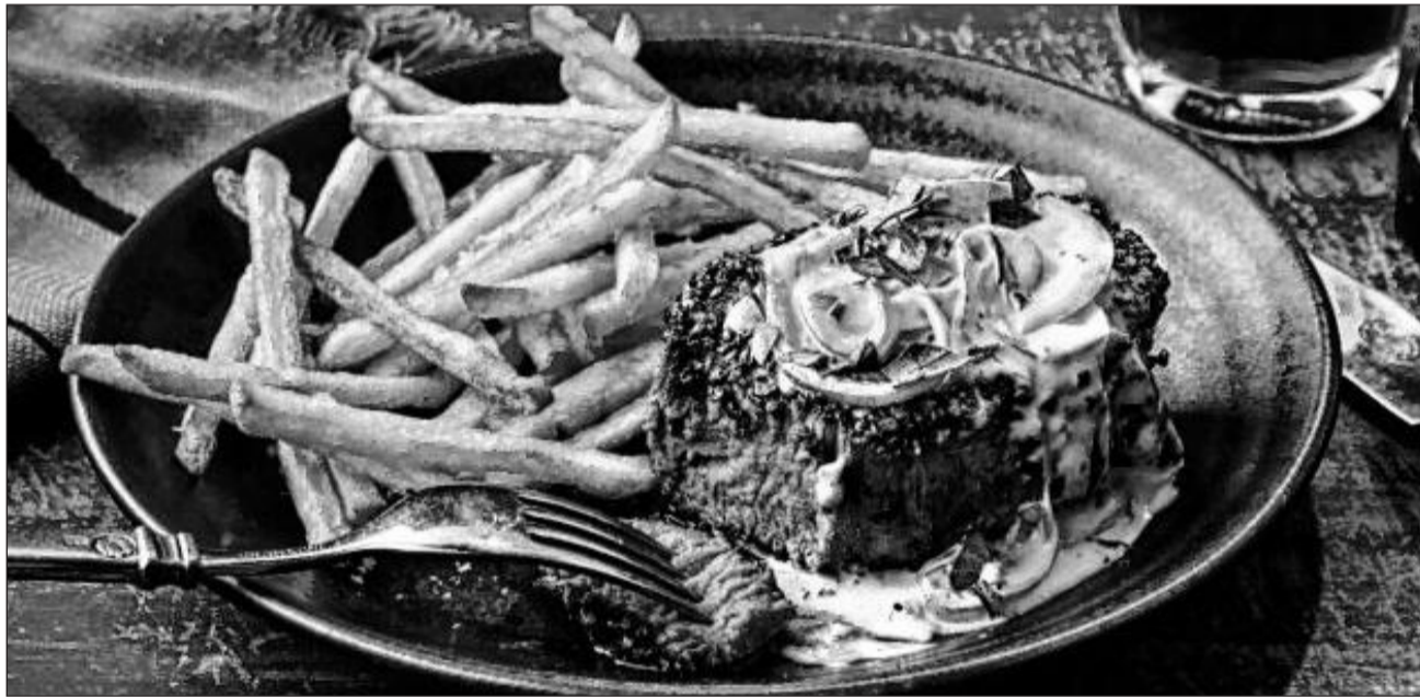
► El nuevo modelo fomenta el consumo de carne roja, huevos y manteca.

que las dietas ricas en proteínas aumentan los niveles de hormonas como la GLP-1, que ayudan a la saciedad. No obstante, Deierlein destaca que falta información sobre los efectos de estas dietas a largo plazo.