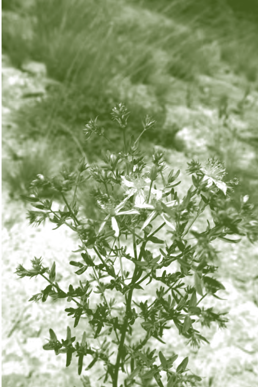
Herba de St. Joan o Hipèric