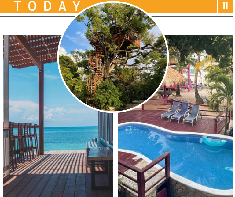
Instalaciones del Hotel Fosters Resort.

total de treinta dos cabañas y ofrecen una variedad de servicios. Cuenta con un restaurante (Gypsy) con un menú muy variado, se encuentran desde comidas típicas hondureñas como baleadas, hasta comida isleña, destacando platos como el pescado frito y la sopa de caracol. De igual forma, en el resort se encuentra un bar- restaurante llamado, Lala Llama Momma, en donde se puede disfrutar de la playa, música y ver una puesta de sol con un cóctel en la mano. Y es que, además de eso, el hotel cuenta con un kiosko de actividades con servicios como: el bote de vidrio, snorkeling,