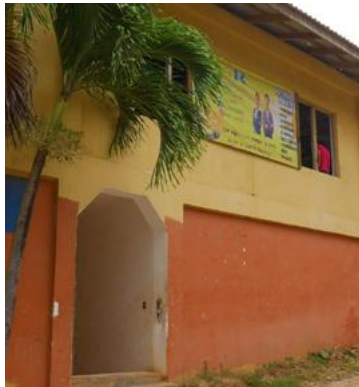
Kínder Ramón Villada Morales.

centros educativos, para garantizar un ambiente pedagógico para los niños y jóvenes del municipio.