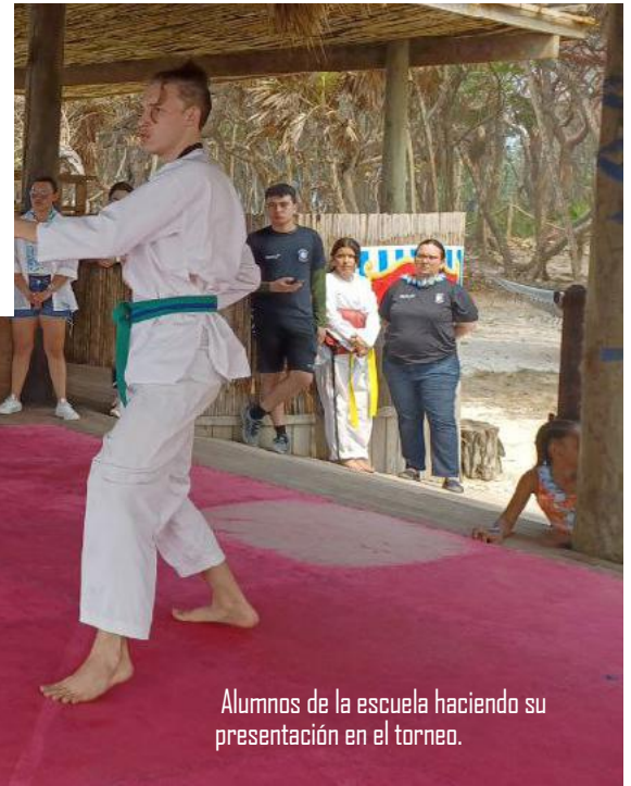
Alumnos de la escuela haciendo su presentación en el torneo.