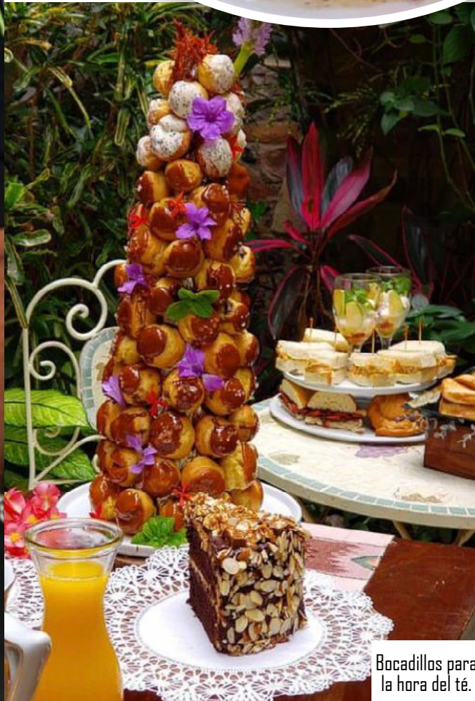
Bocadillos para la hora del té.