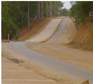
Calles en proceso de pavimentación.

Con el objetivo de modernizar la vial y con ello atraer el desarrollo del municipio, la alcaldía de Roatán continúa llevando a cabo los trabajos de pavimentación en el eje carretero que conduce desde el desvío de Mud Hole hasta la comunidad de West End. En ese sentido, los impuestos que se generan día a día se ven reflejados en las obras que están destinadas a atraer más inversión para el municipio.