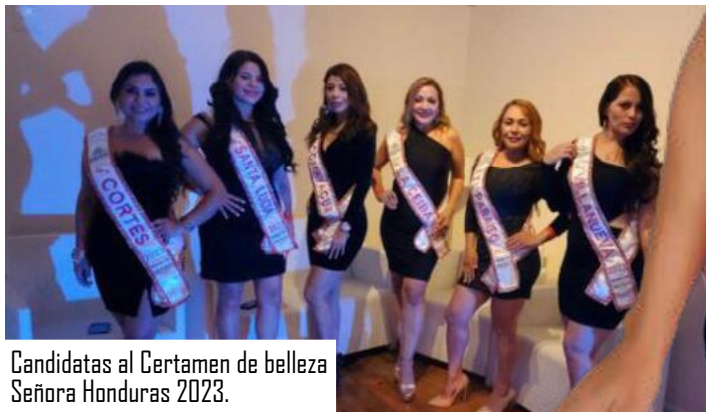
Candidatas al Certamen de belleza Señora Honduras 2023.