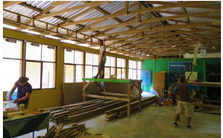
Trabajos de reparación en el Kinder Ramón Villeda Morales de Roatán.