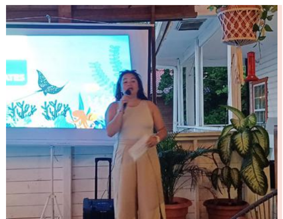
Representante de Marine Park.