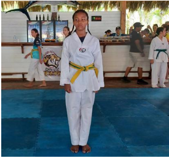
El taekwondo es un deporte que te ayuda a superarte a ti mismo.

Los premios que se entregaron fueron: medalla de oro, plata y dos terceros con medalla de bronce, finalmente se premiaron las escuelas.