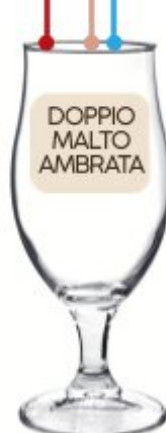
CALICE BIRRA EXECUTIVE 0,2 - 0,3 - 0,4