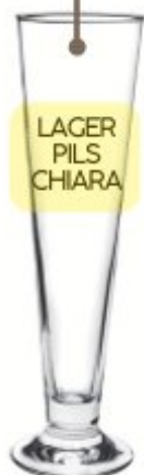
CALICE BIRRA PALLADIO 0,2 - 0,3 - 0,4