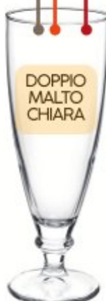
CALICE BIRRA HARMONIA 0,2 - 0,3 - 0,4