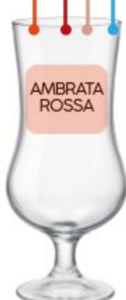
CALICE BIRRA ALE Cl. 42 - 50