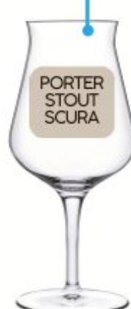
CALICE BIRRATEQUE BEER TESTER Cl. 42