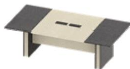
MESA DE REUNIÃO - 6 LUGARES COM CALHA PASSA FIO TOR052.394411 - 207,6 x 185 x 74 TOR052.394408 - 237,6 x 185 x 74