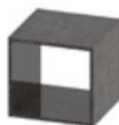
NICHO TOR052.394416 42,4 X 41 X 39,6