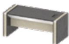
MESA RETA FRONTAL TOR052.394407 - 175,2 x 80 x 74 TOR052.394408 - 205,2 x 80 x 74