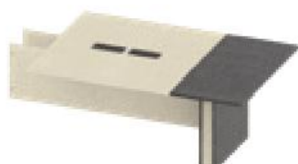
MESA DE REUNIÃO COMPON. 4 LUG. C/ CALHA PASSA FIO TOR052.394410 - 212,4 x 120 x 74

Obs. Só pode ser usada com a mesa de reunião TOR052.394409.