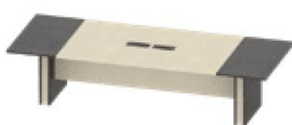
MESA DE REUNIÃO 8 LUG. C/ CALHA PASSA FIO TOR052.394422 - 312 x 120 x 74