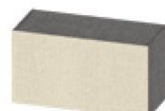
NICHO COM PORTA TOR052.394418 80 X 36,8 X 43,6