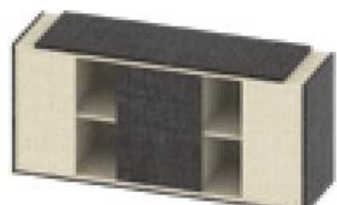
ARMÁRIO CREDENZA COM PORTAS TOR052.394421 - 160 x 45 x 71