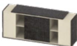
ARMÁRIO CREDENZA COM PORTAS TOR052.394421 - 180 x 45 x 71