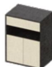
APARADOR COM PORTA TOR052.394417 64,2 x 45 x 85