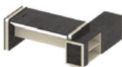
MESA CREDENZA DIR/ESQ TOR052.394411 - 207,6 x 185 x 74 TOR052.394408 - 237,6 x 185 x 74