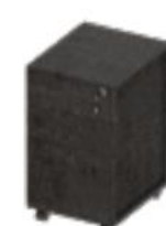
GAVETEIRO VOLANTE 2 GAVETAS E 1 GAVETÃO TOR052.394418 37,8 X 45 X 64,9