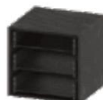
NICHO 3 GAVETAS TOR052.394425 42,4 X 42,8 X 39,6 Obs. Deverá ser utilizado com mais 3 itens TOR052.394430 (frente de gaveta)