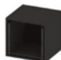
NICHO GAVETÃO TOR052.394426 42,4 X 42,8 X 39,6 Obs. Deverá ser utilizado com o item TOR052.394431 (frente de gavetão)