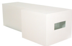
Atrapando espacios infinitos de la serie: Contornos del silencio. 2006. Madera y luz. 42 x 132 x 51