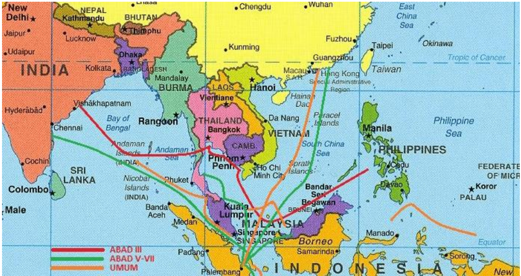
Gambar 8.7.1 Jalur Perdagangan India-Cina