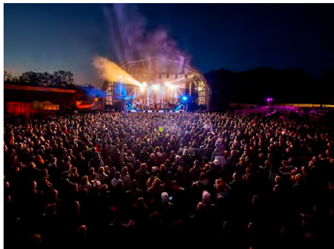
Le concert de Matmatah sur la grande scène des Moissons Rock, devant 4 300 personnes à Juvigny.