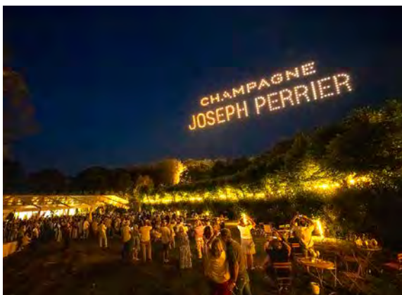
La première édition du Jojo festival a connu un beau succès, l'an passé à Châlons.