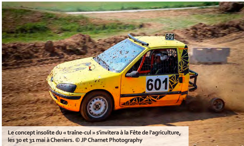
Le concept insolite du « traîne-cul » s'invitera à la Fête de l'agriculture, les 30 et 31 mai à Cheniers.

Après Bignicourt-sur-Saulx et Fère-Champenoise, c'est dans le petit village de Cheniers, près de Châlons, que la Fête de l'agriculture prendra ses quartiers les 30 et 31 mai. Plus précisément sur une parcelle de 14 hectares mise à disposition, le long de la RD5. Ce rendez-vous biennal, porté par les Jeunes agriculteurs de la Marne et leurs partenaires, promet son lot d'attractions : spectacles équestres, marché d'une cinquantaine de producteurs locaux, exposition d'engins agricoles, démonstrations de chasse, village animé autour du machinisme depuis le XIX e siècle jusqu'à aujourd'hui, etc. « On vise les 8 000 entrées cette année, contre 7 000 lors de la dernière édition, annoncent Corentin Mance et Loïc Guillaume,