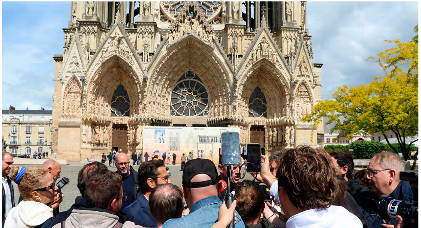
L'officialisation de Reims comme ville départ du Tour de France 2028 a attiré les médias, lundi 18 mai, au pied de la cathédrale.