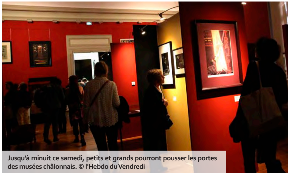
Jusqu'à minuit ce samedi, petits et grands pourront pousser les portes des musées châlonnais.

Et puisque le cirque s'impose comme un formidable vecteur de découverte et de partage, la ville associe le Palc à cette programmation. La soirée débutera avec le spectacle « Mascarade » de la compagnie BAL (à 18 h puis à 21 h), conçu pour être joué dans des espaces contraints. En l'occurrence, les jardins intimistes du musée Garinet, rue Pasteur. Portée par deux acrobates formés chez Fratellini, cette création, volontairement très proche des spectateurs, aborde les mouvements circassiens à travers le jeu et s'amuse de la prise de