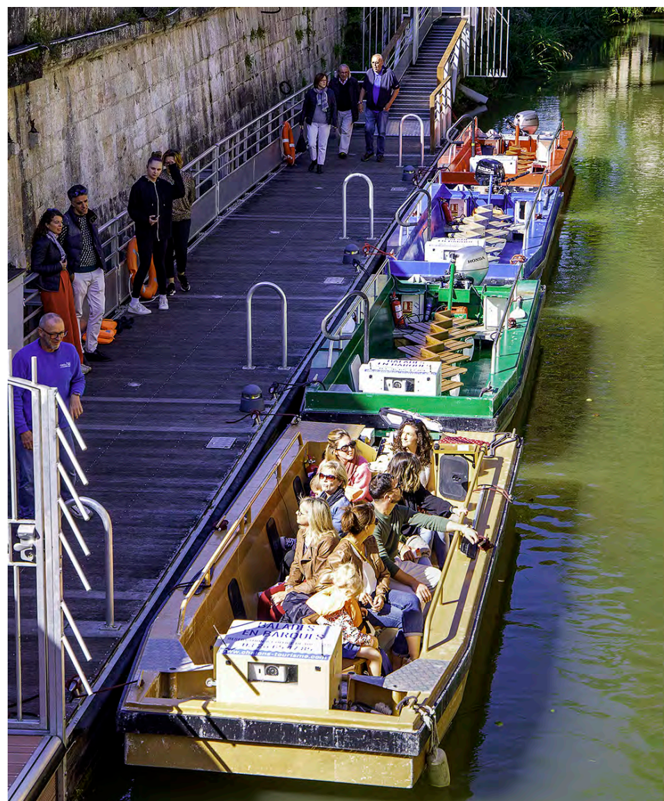
Les balades en barque ont accueilli 1 000 passagers de plus la saison passée.

Le tourisme d'affaires en nette progression