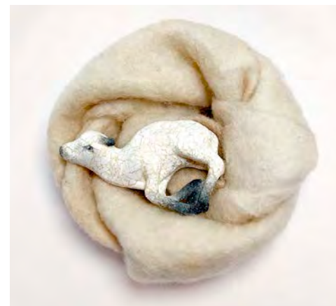
Les œuvres de l'artiste résultent d'un an et demi d'immersion auprès d'un cheptel de brebis et leurs agneaux.