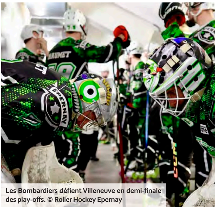
Les Bombardiers défient Villeneuve en demi-finale des play-offs.

mars lors de la 15e journée, avant de récidiver en finale de la Coupe de France (5-2). Seul bémol, une défaite en début de saison, lors de la 6e journée disputée en novembre (0-2).