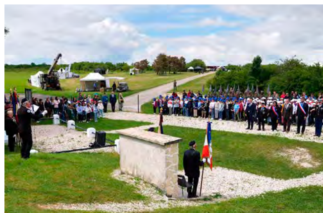
Treize écoles sont associées au 29 e Rallye de la liberté cette année.