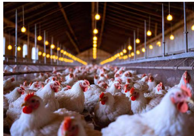
Les opposants à l'élevage industriel de poulets à Sarry n'ont pas obtenu gain de cause devant le tribunal administratif de Châlons. © illustration

D'autres recours doivent encore être étudiés par la justice, notamment contre l'arrêté préfectoral qui a délivré, en février dernier, l'autorisation environnementale d'exploitation à cet élevage de poulets de chair, pour une durée de trois ans.