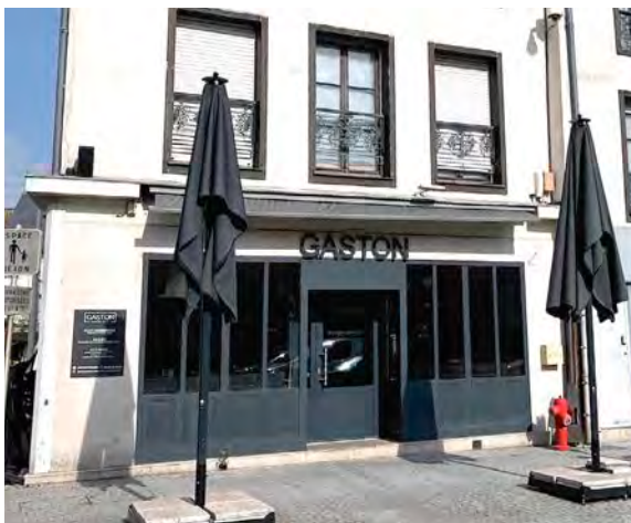
L'ex-Gaston va enfin reprendre du service grâce à l'équipe du Saint Alp'.