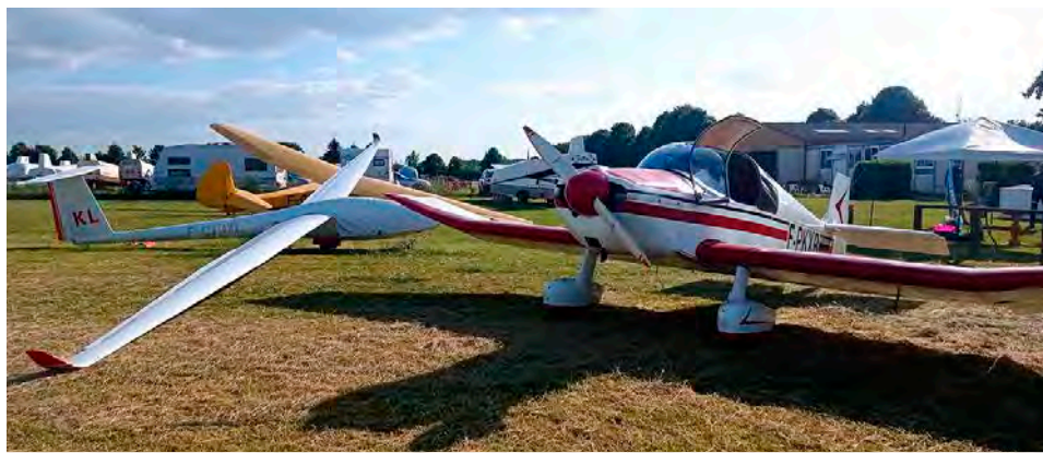
Le grand public pourra admirer et monter à bord des aéronefs du club.

On ne le sait pas toujours, mais l'aérodrome d'Écury-sur-Cooles, situé à une petite dizaine de kilomètres au sud de Châlons, dispose de sérieux atouts pour les aficionados des airs. Il se dote notamment de trois pistes en herbe, dont une s'étendant sur 1,5 km, et a été aménagé sur un terrain existant depuis 1936. Comme plus de 600 aéroclubs en France, parmi lesquels celui de Champagne, à Reims-Prunay, l'aéroclub de Châlons-Écury ouvre ses portes au grand public ce week-end pour faire connaître ses activités. Au programme : une présentation de sa flotte, des démonstrations, des baptêmes de l'air à bord d'avions, d'ULM et de planeurs pour admirer le territoire châlonnais vu du ciel ou encore une exposition de modèles réduits qui prendront eux aussi leur envol depuis l'aérodrome. Les bénévoles du club partageront leur passion avec les visiteurs et leur présenteront les différentes formations proposées sur place. Un barbecue et un espace buvette gérés par l'association Familles rurales ajouteront à la convivialité du moment. Le tout complété, dimanche, par une brocante et un marché du terroir, organisés en partenariat avec la mairie d'Écury-sur-Cooles.