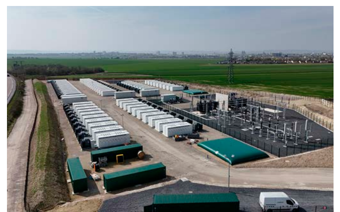
Le site est équipé de 140 unités de stockage Tesla Megapack.

L'ensemble marnais, composé de 140 conteneurs de stockage d'énergie de 9 mètres de long, a été installé sur un terrain de 3,5 hectares, proche de l'autoroute A34 et éloigné des habitations. Doté des accumulateurs électriques lithium-ion Tesla Megapack, le site est connecté à un poste de transformation électrique de 225 000 volts. La construction de cet équipement s'inscrit dans un contexte d'accélération du stockage énergétique : en cinq ans, la capacité installée en batteries dans l'Hexagone est passée de moins de 50 MW à environ 1 500 MW début 2026. Et le total pourrait s'élever à 20 000 MW en 2030, d'après un scénario de RTE, le gestionnaire du réseau de transport d'électricité, dans un contexte d'évolution du mix électrique et des besoins.