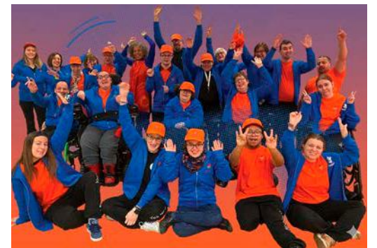
Le Festi'Cap vivra sa troisième édition, jeudi 4 juin.

La salle polyvalente de Cormontreuil accueillera, jeudi 4 juin, de 10 h à 17 h, la troisième édition du Festi'Cap, un événement consacré au handicap et à l'insertion professionnelle. Porté par l'association Atout Cœurs, ce rendez-vous entend favoriser les rencontres entre personnes en situation de handicap et acteurs économiques du territoire. Sur place, une quarantaine d'exposants (entreprises, associations, structures d'accompagnement et institutions) seront réunis pour informer, orienter et échanger avec les visiteurs. Objectif : rendre plus accessibles les dispositifs existants et faciliter l'accès à l'emploi, encore marqué par de nombreux obstacles. Des activités diverses, des ateliers, des représentations culturelles, des tables rondes et des animations rythmeront la journée. Soutenu par la région Grand Est, le Festi'Cap s'inscrit dans une dynamique locale en faveur d'une inclusion plus concrète.