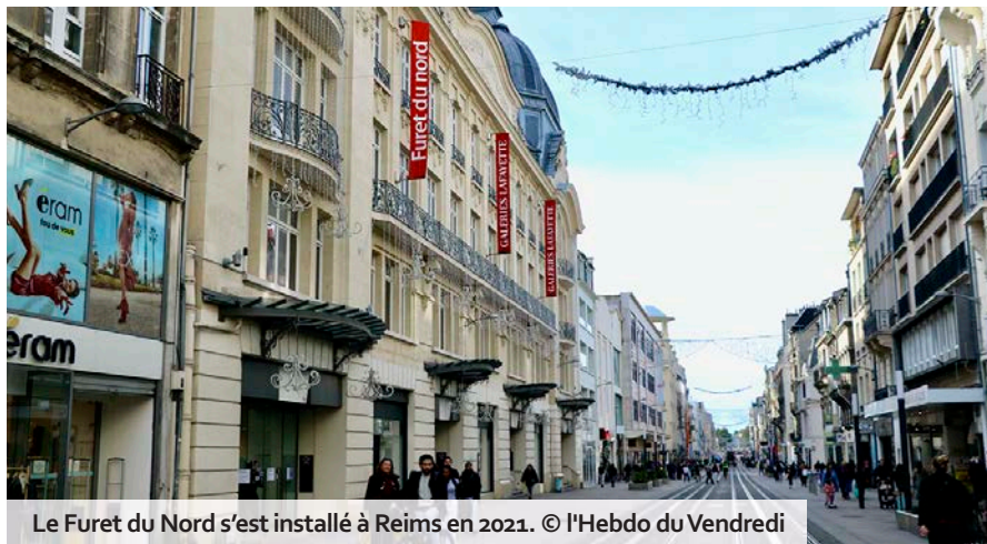
Le Furet du Nord s'est installé à Reims en 2021.

Un plan de redressement détaillé sera présenté « dans les prochaines semaines », indique le premier groupe de librairies en France dans un communiqué et les syndicats craignent déjà des fermetures et des licenciements. « Le marché des biens culturels traverse une crise profonde, marquée par une forte pression sur les marges et un recul des volumes de près de 15 % depuis 2021, dans un contexte encore fragilisé ces derniers mois