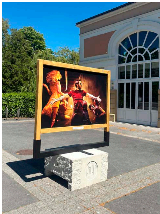
Les blocs élaborés à partir du béton des voies ferrées servent de supports pour les visuels du Cnac.

Environ 5 000 tonnes de béton issues de 30 000 traverses de chemin de fer ont ainsi pu être concassées et réemployées pour fabriquer ces blocs de haute performance technique. Avec une double vocation : servir de supports pour les affiches dédiées aux 40 ans du Cnac et, à plus long terme, lester les chapiteaux sous lesquels travaillent les élèves et les équipes pédagogiques de l'école circassienne. Une approche durable qui mêle circuits courts et valorisation des ressources naturelles, déjà éprouvée par l'entreprise cornicienne depuis 2018. L'année dernière, pour rappel, Capremib a réutilisé les gravats d'une barre HLM suite à sa démolition par le bailleur social Reims Habitat, au cœur du quartier Croix-Rouge. Grâce à un processus spécifique, ils ont été intégrés à des bétons préfabriqués pour la construction des gradins d'un amphithéâtre de l'école rémoise de commerce Neoma Business School. Cette stratégie vertueuse pourrait inspirer d'autres partenariats à l'avenir.