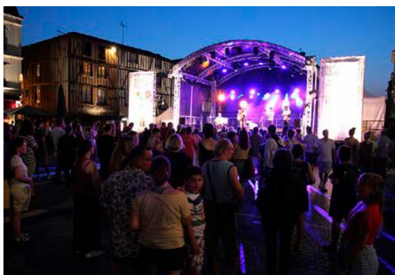
Les MIA, 35 e édition, s'installeront à partir du 26 juin à Châlons et ailleurs.

✓ Festival des Musiques d'ici et d'ailleurs, du 26 juin au 26 juillet, Châlons et alentour Accès libre – Programme complet : musiques-ici-ailleurs.com .