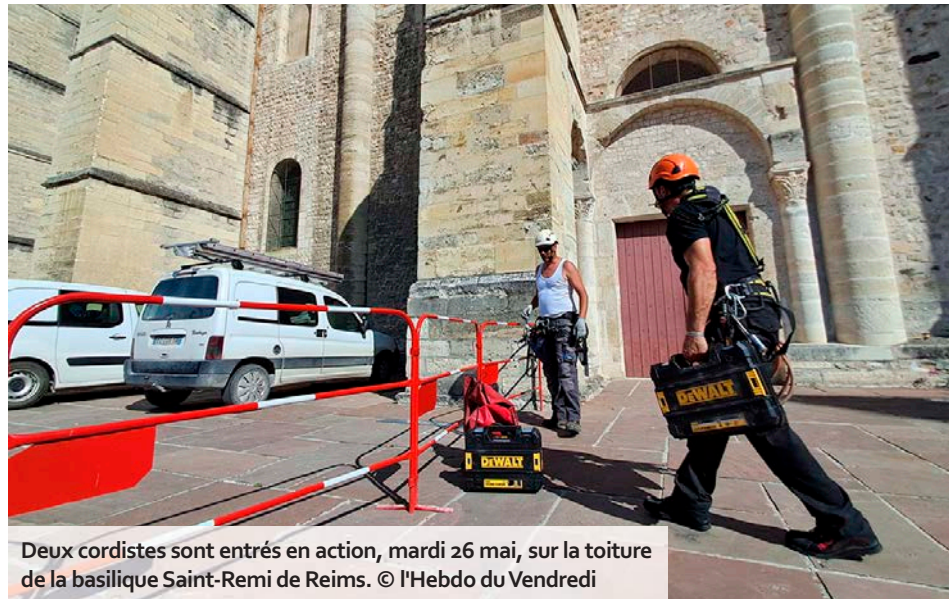
Deux cordistes sont entrés en action, mardi 26 mai, sur la toiture de la basilique Saint-Remi de Reims.

Partiellement fermé au public depuis le jeudi 30 avril à la suite de la découverte d'un glissement de toiture, l'emblématique édifice du XIII e siècle bénéficie de travaux d'urgence, annoncés par l'écu, vendredi 22 mai. « Le protocole de sécurisation a fait l'objet d'un accord entre la ville et la Drac (Direction régionale des affaires culturelles), ce qui permettra de lancer des travaux d'urgence le mardi 26 mai. »