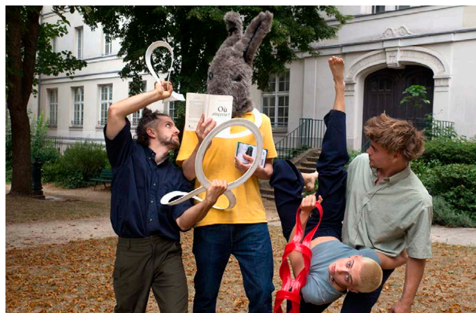
La création « Comme un vertige » explore notre rapport au vivant et à l'écologie.

Du mardi 2 au samedi 6 juin, le 37 e festival Furies va transformer Châlons en un terrain de jeux et d'expérimentations pour les arts vivants. Cirque, danse, théâtre, musique, marionnette ou encore pyrotechnie : de quoi réjouir les âmes et nourrir les esprits.