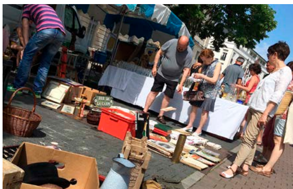
Les professionnels déballeront leur marchandise dès l'aube, place Godart à Châlons.

✓ Marché aux puces, dimanche 31 mai de 8 h à 18 h, place Godart, Châlons – Petite buvette sur place Accès libre.