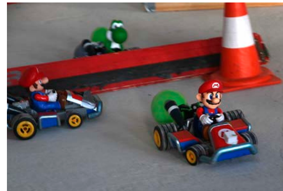
Les fans de Mario Kart pourront participer à un tournoi samedi à la médiathèque Pompidou.

✓ La Route des Jeux, vendredi 29 mai de 18 h à 22 h et samedi 30 mai de 10 h à 18 h, médiathèque Pompidou (atelier cartes à l'OctoLab de Diderot), Châlons – Gratuit, inscriptions obligatoires pour l'escape game « Le trésor du bunker » au 03 26 26 94 26 – Infos : bm.chalonsenchampagne.fr.