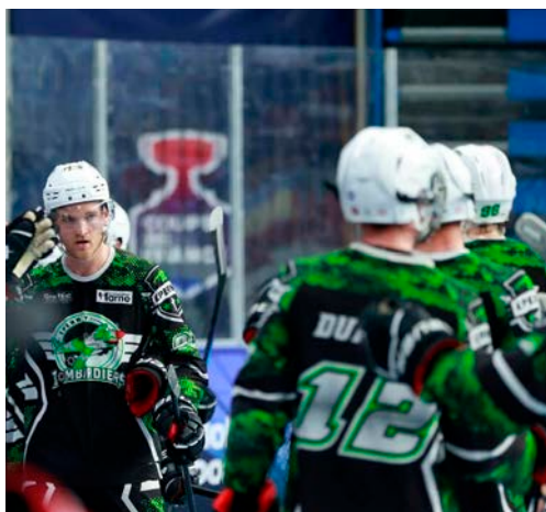
Les Bombardiers n'ont plus le droit à l'erreur.

Opposés au leader de la saison régulière, Villeneuve-la-Garenne, en demi-finale des play-offs, les Sparnaciens se sont inclinés 4-0 à domicile lors du premier match, samedi 23 mai. Un revers net face au favori pour le titre, déjà sacré à trois reprises.