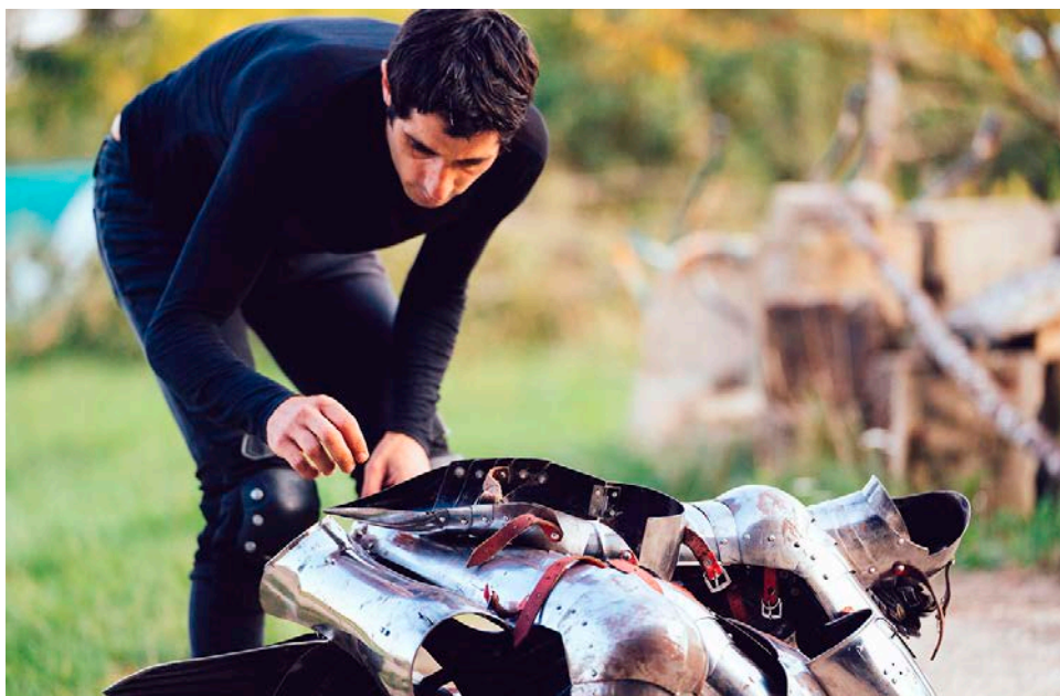
Le cirque et la danse en armure, une nouvelle discipline explorée par Muchmuche Company à découvrir pendant Furies.