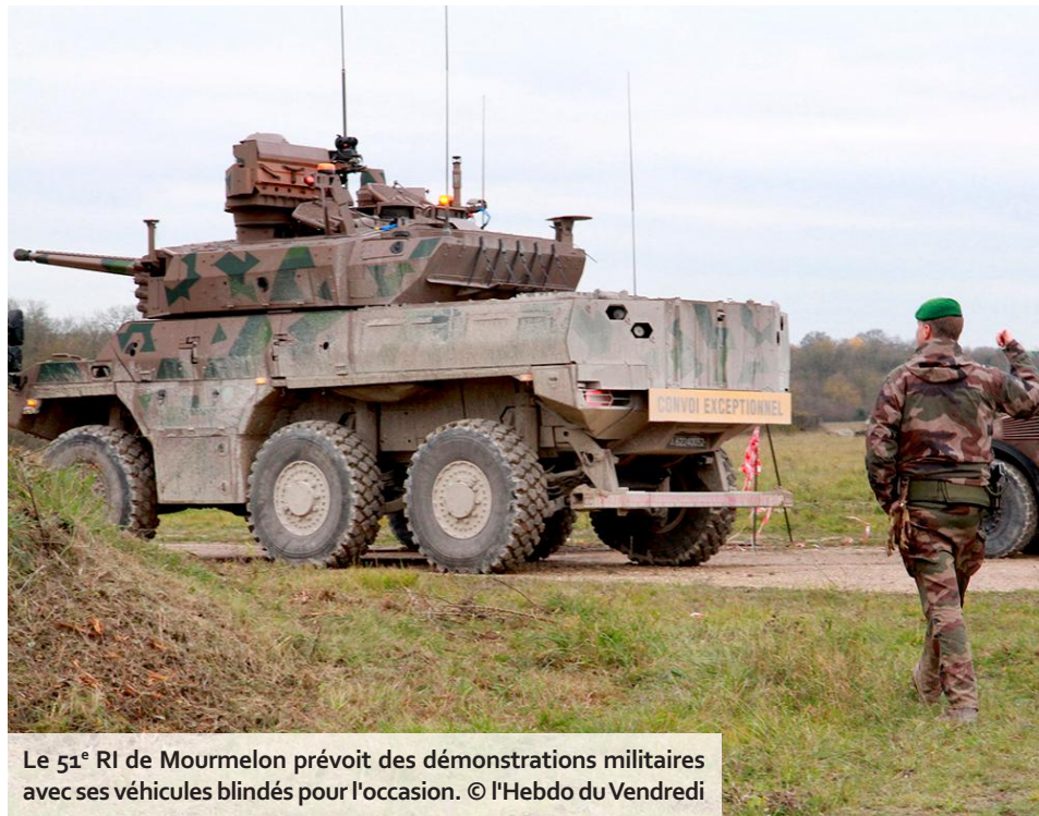
Le 51 e RI de Mourmelon prévoit des démonstrations militaires avec ses véhicules blindés pour l'occasion.

Pour célébrer son 375 e anniversaire et promouvoir ses missions auprès du grand public, le 51 e RI ouvre ses portes pendant deux jours. Plus précisément, celles du quartier Gallieni