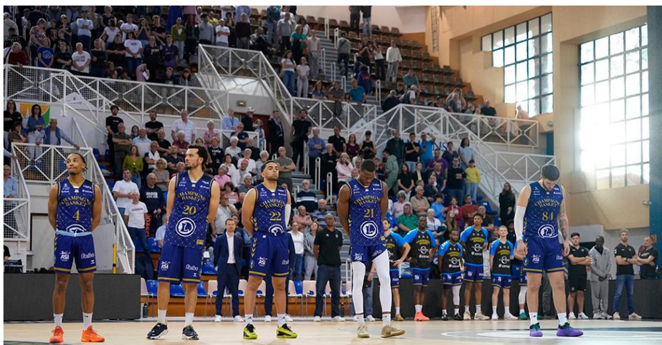
Le Champagne Basket accueille Pau-Orthez dans la salle Coubertin de Châlons, vendredi 29 mai.