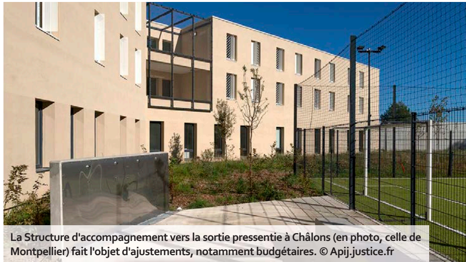
La Structure d'accompagnement vers la sortie pressentie à Châlons (en photo, celle de Montpellier) fait l'objet d'ajustements, notamment budgétaires.