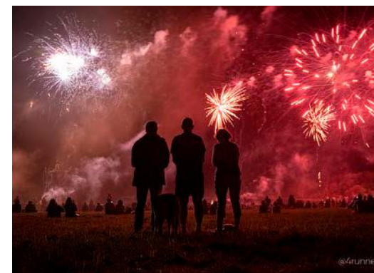
Un spectacle pyrotechnique va métamorphoser le lac du Der samedi soir à 23 h.

Côté musique, cinq concerts sont programmés en partenariat avec Bords 2 Scènes : Debout sur le Zinc (vendredi, 21h), iWho's The Cuban ? (samedi, 19h30), Sergent Garcia (samedi, 21h30), Swing Shady (dimanche, 15h) et Mac Guinness (dimanche, 17h). Temps fort du week-end : le spectacle pyrotechnique conçu par la société Aquarêve, prévu le samedi à 23 h, mêlant feu d'artifice, jeux de lumière et reflets de l'eau. Les amateurs de sensations pourront relever le challenge Watermen par équipes (jet-ski, voile, paddle, kayak) ou tester des baptêmes de plongée, de longe-côte, de dragon boat ainsi que des balades poétiques et musicales en montgolfière. Le dimanche à 10 h 30, place à la Color run du Der, une course de 5,69 km ouverte à tous à travers les forêts, les ports et les plages. De nombreuses autres activités familiales ponctueront ces trois jours : visites de la ferme pédagogique, bains de forêt, promenades en calèche ou encore initiations au combat médiéval. Liste non exhaustive !