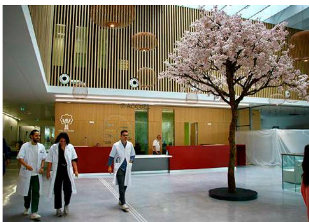
Le CHU de Reims s'est impliqué aux côtés des établissements de Montpellier, Toulouse et Genève.

Le CHU de Reims se distingue par son engagement dans ce programme, occupant le premier rang national en matière de contribution au « don croisé ». L'établissement avait déjà participé au premier « triplet » réalisé en France en 2024. Depuis la loi de bioéthique de 2021, il est désormais possible d'organiser des dons croisés impliquant non plus deux, mais jusqu'à six paires de donneurs et de receveurs. « Cette évolution permet d'augmenter les possibilités d'appariement et d'améliorer l'accès à la greffe pour les patients atteints d'insuffisance rénale chronique terminale », souligne le CHU de Reims. Illustration concrète de l'essor de cette pratique : un nombre croissant d'équipes médicales inscrivent, auprès de l'Agence de la biomédecine, des paires incompatibles dans le dispositif, contribuant ainsi à élargir les possibilités d'appariement et à faciliter l'accès à la greffe.