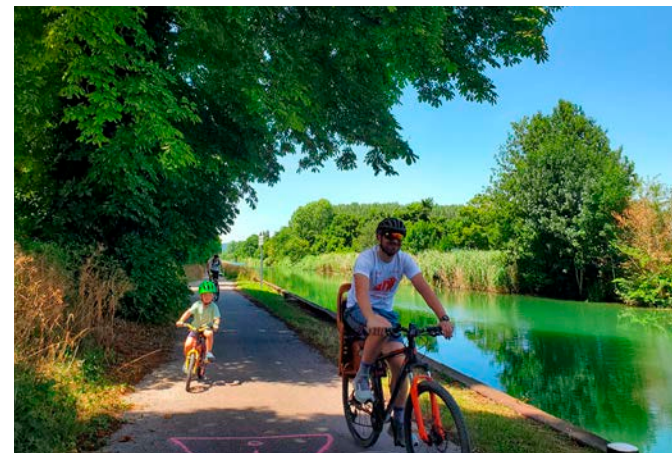
Au départ de Tours-sur-Marne, trois parcours sont au programme de cette 3 e édition.