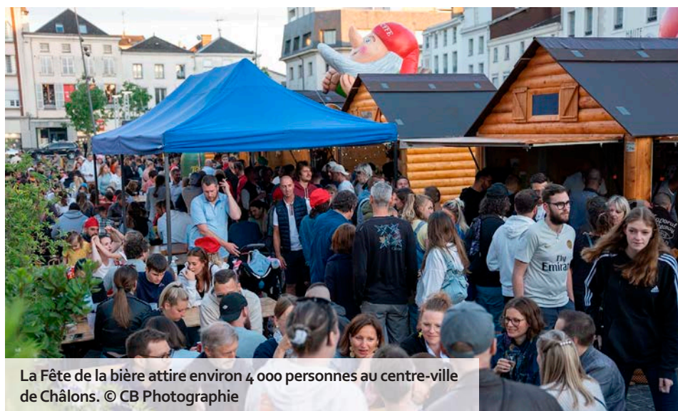
La Fête de la bière attire environ 4 000 personnes au centre-ville de Châlons.