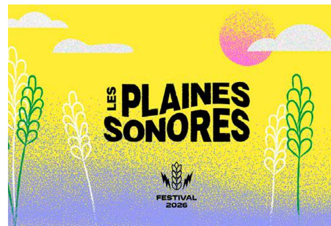
L'affiche est à l'image du festival qui s'installe dans un champs de blé de dix hectares.

✓ Festival Les Plaines sonores, vendredi 5 et samedi 6 juin à Sault-Saint-Rémy (Ardennes). Tarifs : pass un jour 37 €, pass deux jours 62 € (plus 10 € avec le camping). Infos : lesplainessonores.fr