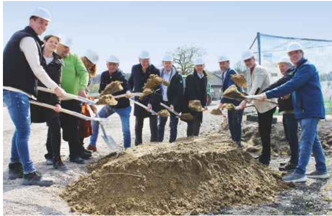
Am 9. April versammelten sich an der Altenberger Straße/Ecke Piggenweg in Steinfurt-Borghorst einige Projektbeteiligte zum symbolischen ersten Spatenstich.