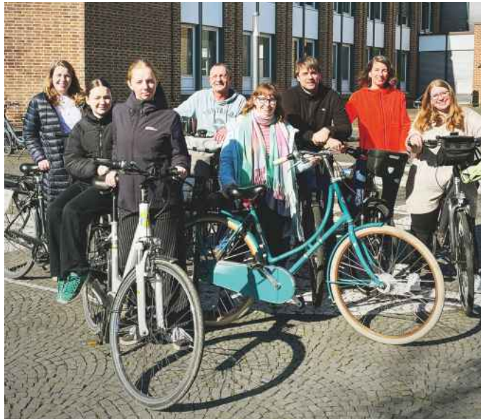
Das Rathaus-Team freut sich auf die kommende STADTRADEL-Aktion.

Auch in diesem Jahr lohnt sich die Teilnahme nicht nur im Hin-