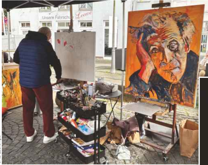
Malerei live erleben – dazu lädt der KunSTvoll Markt ein

(hak) Steinfurt. Die historische Innenstadt Burgsteinfurts erleben viele Besucher schon als ein Kunstwerk an sich. Die Straßen sind gefüllt mit Geschichte und bieten Platz für Begegnungen aller Art. Am Sonntag, 3. Mai präsentieren die Straßen der Innenstadt weitaus mehr als Historisches und liefern mit dem KunSTvoll Markt ein breites Spektrum an Kunst, Kunsthandwerk und kreativen Schätzen, das sich sehen lassen kann.