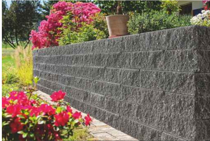
Das Mauer- und Böschungssystem Muro Renature besteht zu 30 Prozent aus einer Recyclingkörnung. Das ist gut für die Umwelt und wird zum nachhaltigen Hingucker im Außenbereich.

Weitere Infos zu den nachhaltigen Produkten gibt es unter www.kann.de/klimalieblinge .