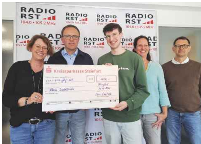
Ein Mitarbeiter von Radio RST (3.v.r.) bedankte sich bei der Übergabe des Schecks herzlich beim Chor Cantata.

Lichtblicke in Zusammenarbeit mit Radio RST zur Unterstützung von Kindern und Jugendlichen zu spenden. Die symbolische Übergabe des Geldes fand im Studio von Radio RST in Rheine statt. Zurzeit probt der Chor intensiv für sein nächstes Konzert am Samstag, 4. Juli in der Bagno Konzertgalerie und lädt dazu alle Interessierten herzlich ein.