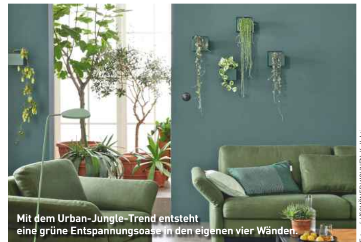
Mit dem Urban-Jungle-Trend entsteht eine grüne Entspannungs-oase in den eigenen vier Wänden.

(djd). Wenn draußen alle Zeichen auf Frühling stehen, wächst auch innen die Sehnsucht nach Natur, Harmonie und frischer Energie. Diesen Wunsch greift der Urban-Jungle-Trend gekonnt auf. Denn mit einer breiten Palette an Grüntönen erhalten Räume eine natürliche und zugleich behagliche Ausstrahlung. In den Farben der Natur präsentieren sich dabei Wände, Böden und Möbel gleichermaßen – abgerundet selbstverständlich durch eine passende Auswahl üppig sprießender Pflanzen. Zu angesagten Zimmerpflanzen, die diesem Anspruch gerecht werden, gehören Vertreter mit so klangvollen Namen wie Mons-