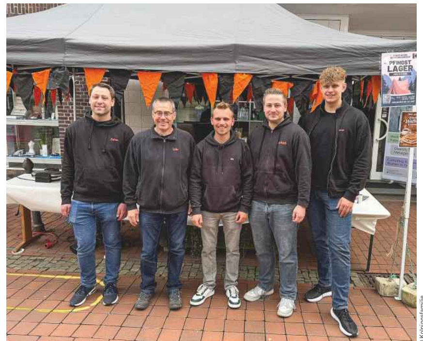
Das Orga-Team war auch auf dem Borghorster Brunnenfest vertreten.