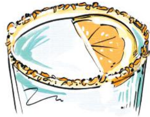
Cáscaras de cítricos