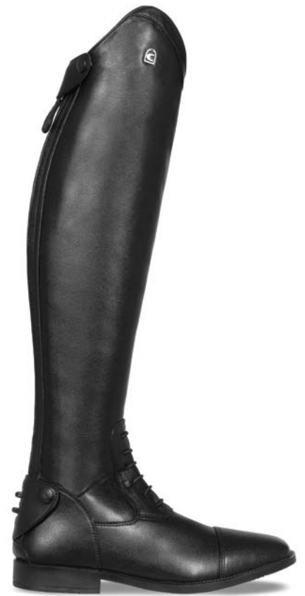
CAVALUNIQUE 541020 - 07 schwarz