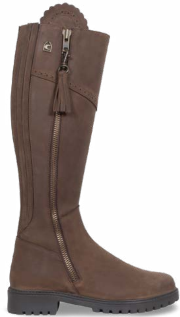
CAVALKATE 543000 - TN tan