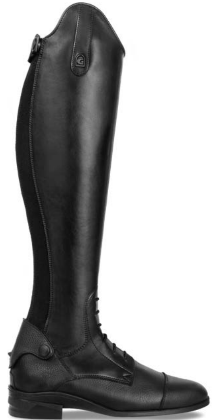
ATB ONE 201000 - 07 schwarz