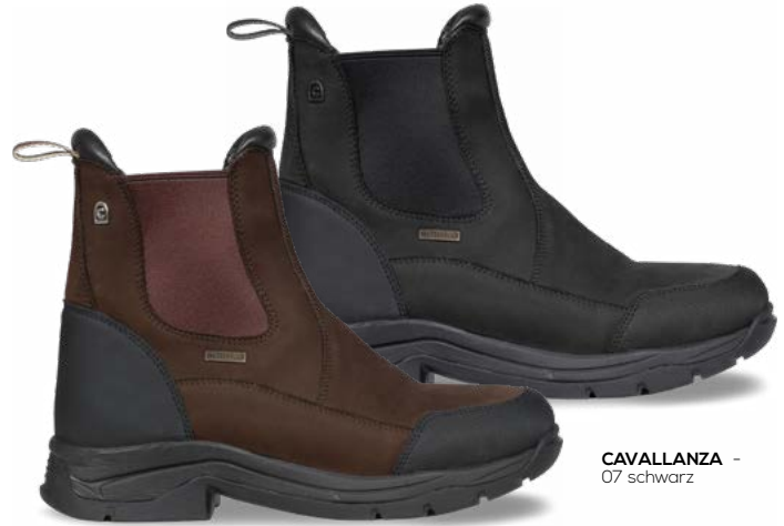
CAVALLANZA - 07 schwarz