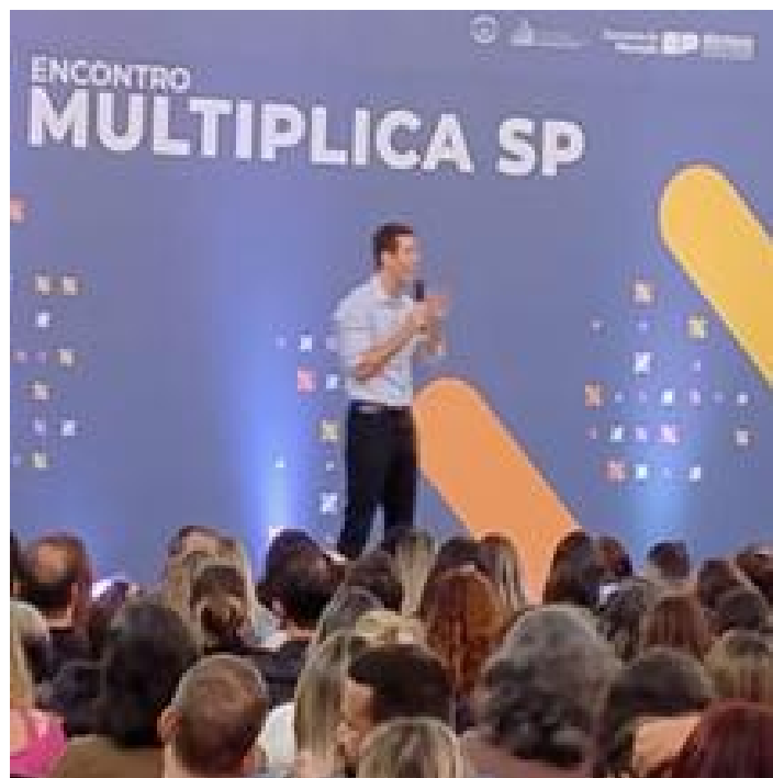
Secretário Estadual de Educação Renato Feder durante o Encontro Multiplica SP.