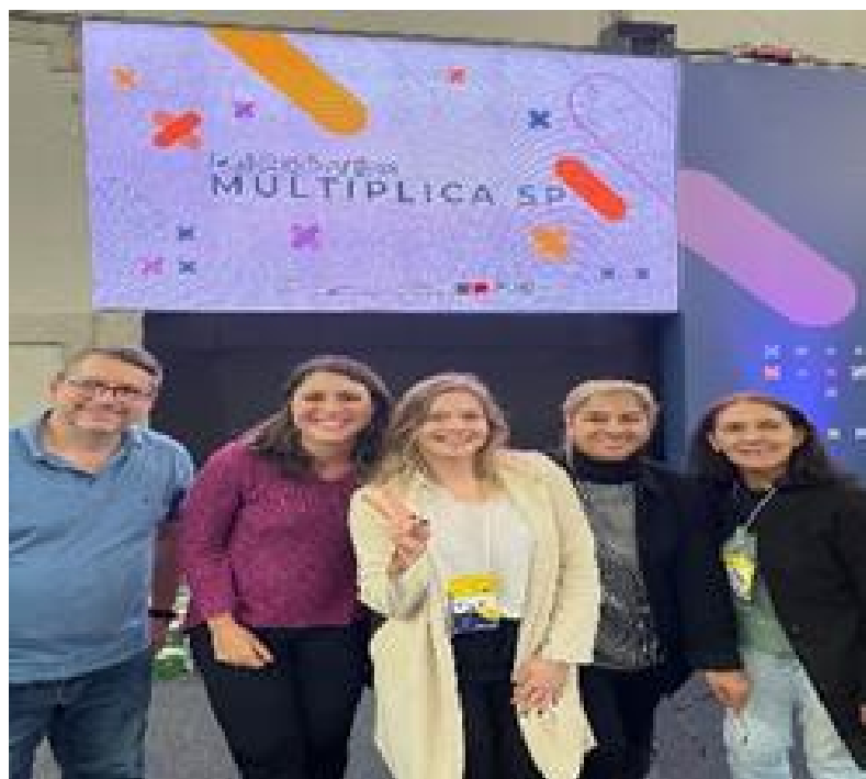
Professores Multiplicadores da Diretoria de Ensino de Limeira.