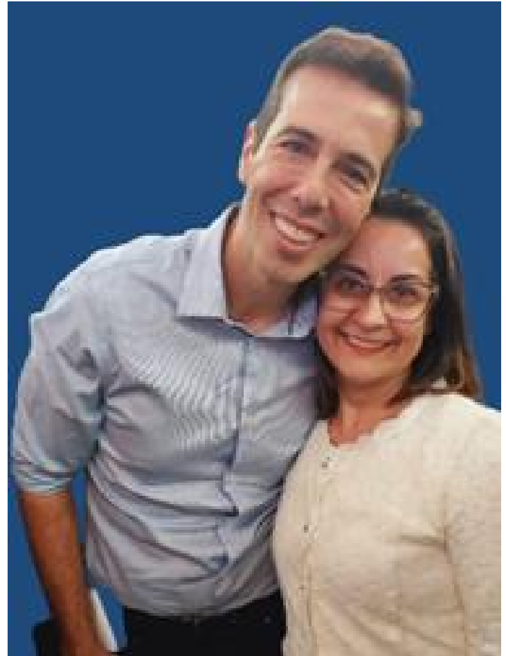
PEC Joceline e o Secretário Estadual de Educação Renato Feder.