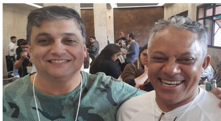
Professores Multiplicadores da Diretoria de Ensino de Limeira.