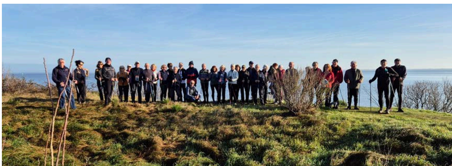
ET... MARCHE NORDIQUE