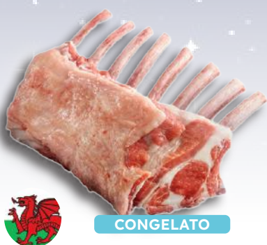
FRENCH RACK CON COPERTINA GALLES