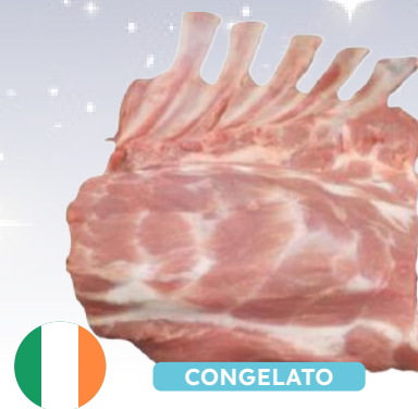
FRENCH RACK SARATOGA