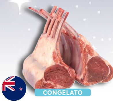
FRENCH RACK CARRÈ