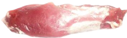
CONGELATO FILETTO DI SUINO IBERICO