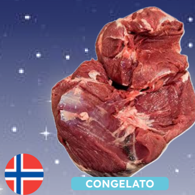
COSCIA DISOSSATA AGNELLO ARTICO