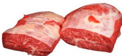
COPERTINA DI SPALLA