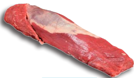
FILETTO 4/5 LBS NUOVA ZELANDA