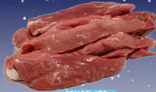
CONGELATO FILETTO DI CERVO