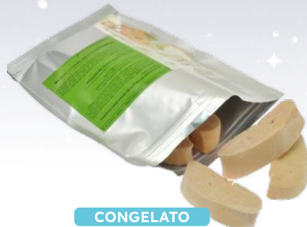
CONGELATO SCALOPPE DI FOIE GRAS D'ANATRA 70GR