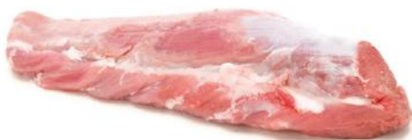
CONGELATO FILETTO ITALIA