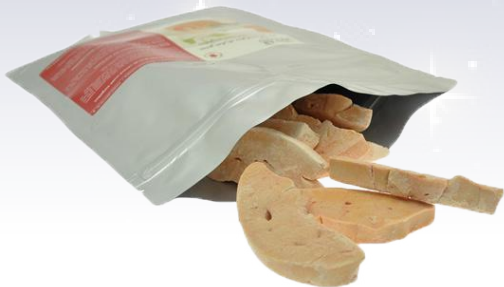
CONGELATO SCALOPPE DI FOIE GRAS D'ANATRA 30 GR