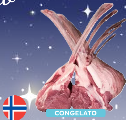
TOMAHAWK AGNELLO ARTICO