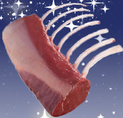
CONGELATO FRENCH RACK CERVO