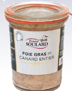
CONGELATO BLOC DI FOIE GRAS D'ANATRA 120 GR