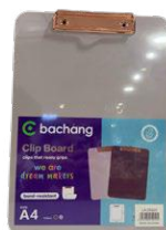
TABLA PORTABLOCK A4