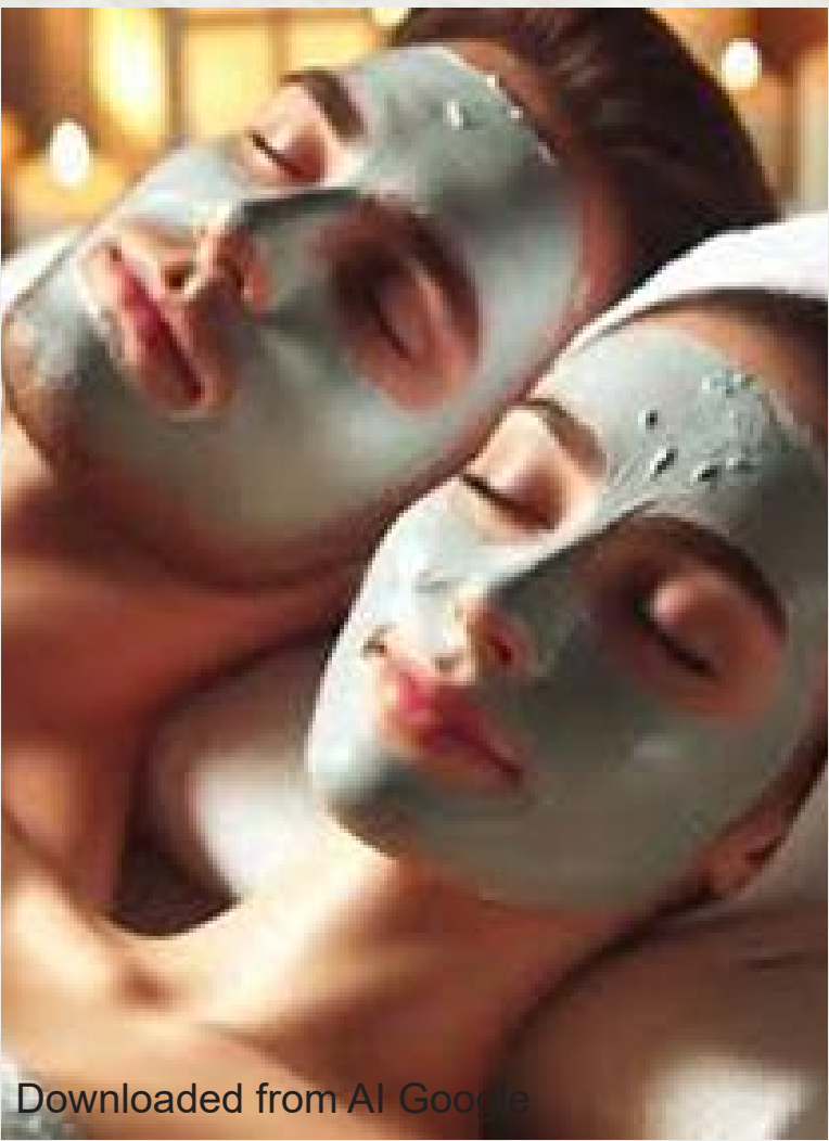
Downloaded from AI Google