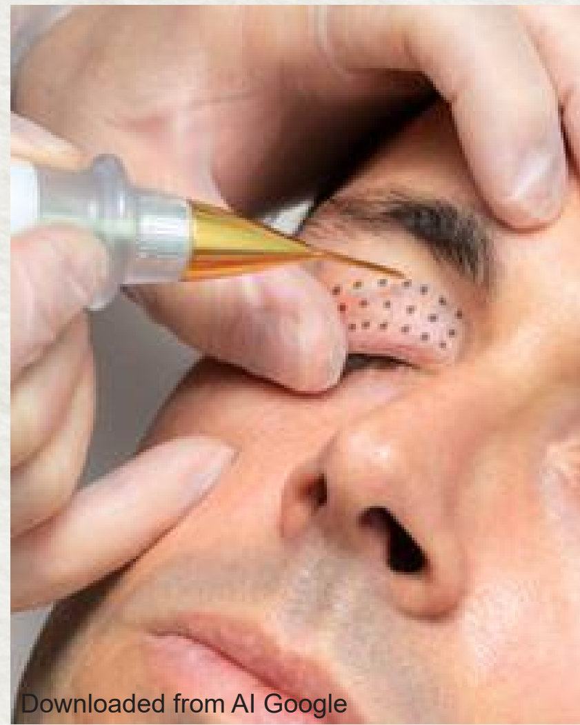
Downloaded from AI Google