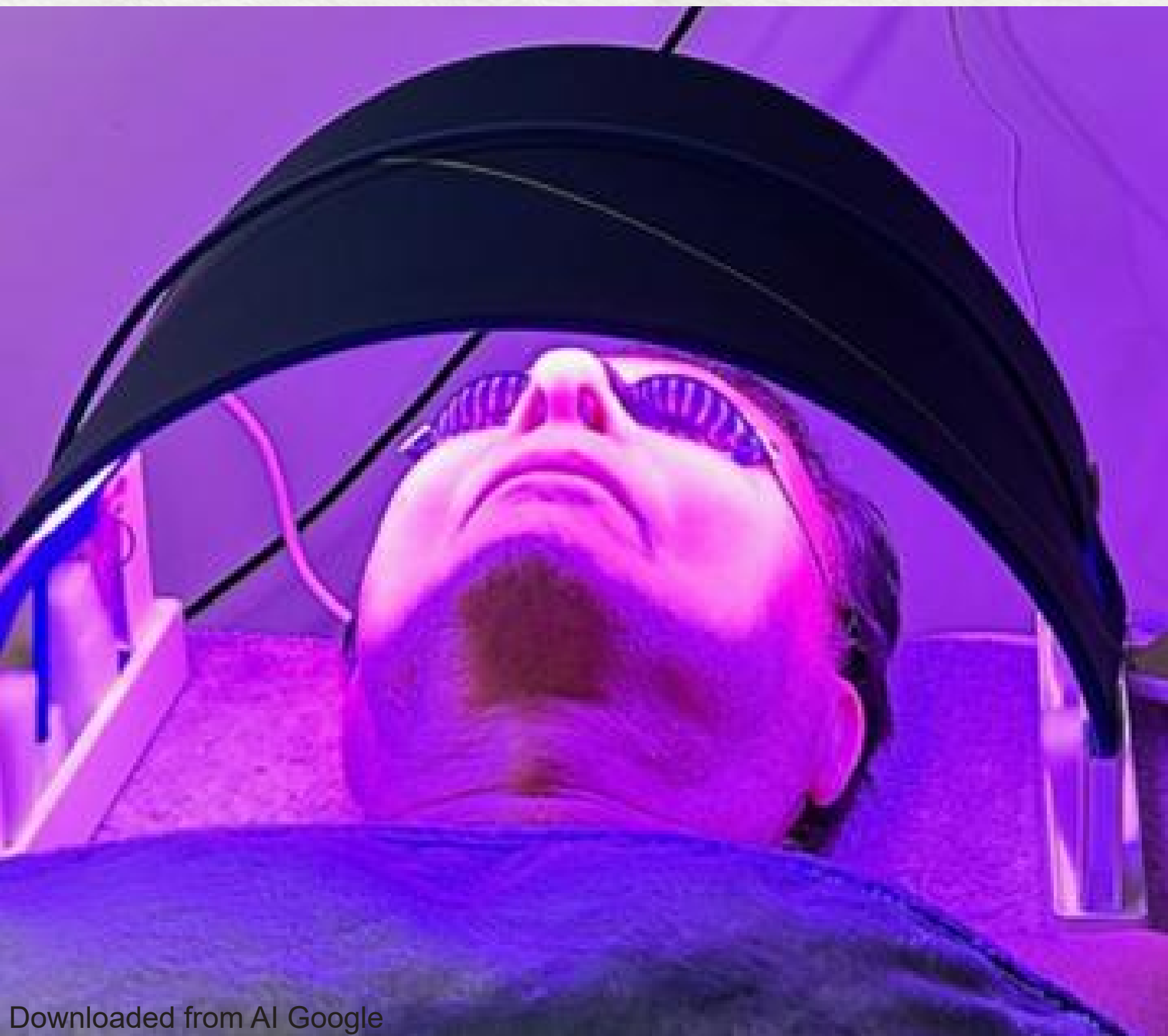
Downloaded from AI Google