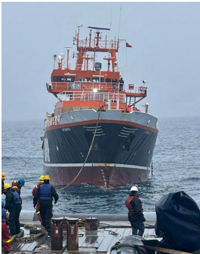
OPV "Marinero Fuentelba"