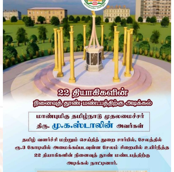
தமிழ் வளர்ச்சி மற்றும் செய்தித் துறை சார்பில், சேலத்தில் ரூ.3 கோடியில் அமைக்கப்படவுள்ள சேலம் சிறையில் உயிர்த்த 22 தியாகிகளின் நினைவுத் தூண் மண்டபத்திற்கு அடிக்கல் நாட்புனார்.