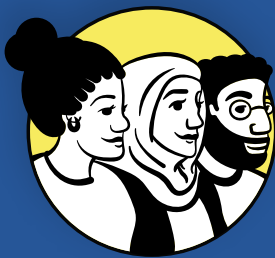
Diversity, Equity and Inclusion Diversidad, Equidad e Inclusión