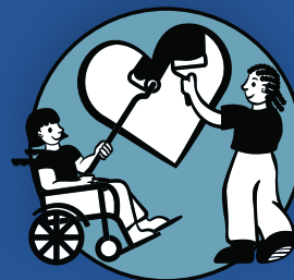
Adaptability and Creativity Adaptabilidad y Creatividad