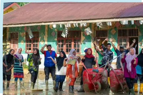
Tim Plan Indonesia bersama para mitra dan relawan membersihkan sekolah dasar di Aceh Tamiang agar ruang belajar segera dibuka kembali.