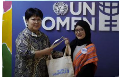
Amanda (19 tahun) mengambil alih peran Ulziisuren Jamsran, Perwakilan UN Women Indonesia dan Liaison untuk ASEAN, dengan menjadi UN Country Representative selama sehari melalui Girls Takeover 2025.