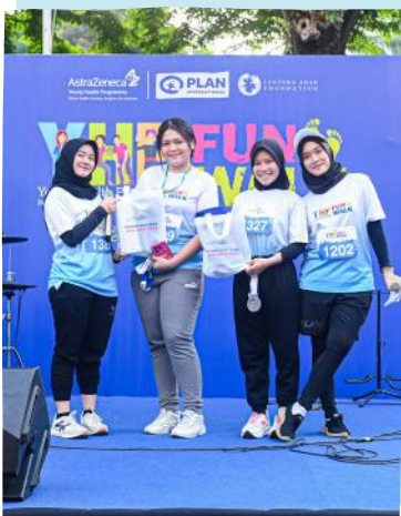
YHP Fun Walk, acara jalan santai yang merupakan bagian dari program Young Health Programme (YHP), yang bertujuan untuk mempromosikan gaya hidup sehat bagi remaja usia 10–24 tahun.