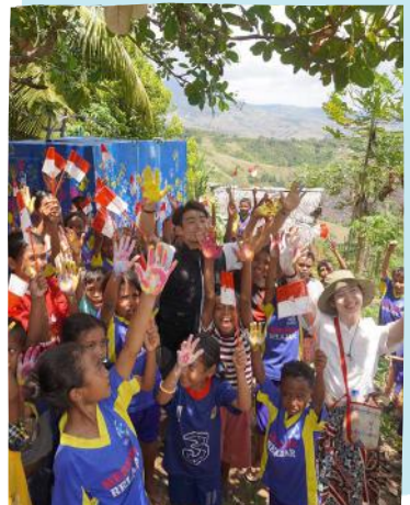
Anak-anak Desa Wokowoe menyambut air bersih dengan sukacita.