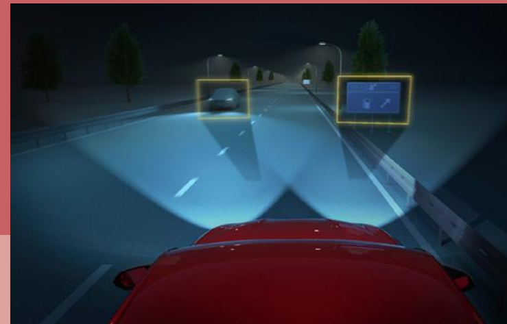
Matrix LED Scheinwerfer