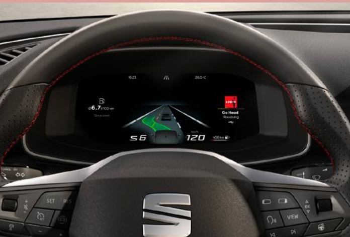
Automatische Distanzregelung ACC