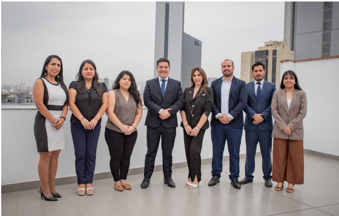
Equipo del Centro de Formación y Capacitación

11. Meritocracia: Se establece la igualdad de oportunidades para ejercer la defensa jurídica del Estado, mediante la selección y acceso al cargo de procurador público, exclusivamente en función a sus méritos profesionales y personales.