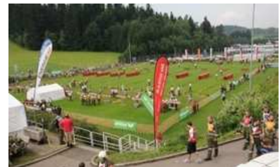
Landesfeuerwehrleistungs- Bewerb in Rohrbach.