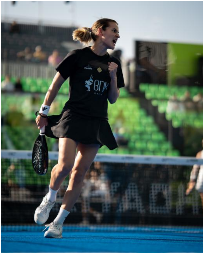
Pasión por su profesión

Ha sido reconocida incluso como una de las deportistas más influyentes de España, lo que demuestra su impacto más allá de la pista.