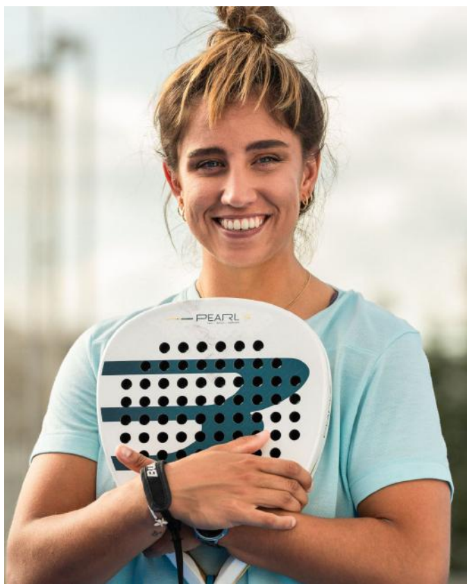
La sonrisa del pádel

Carisma. Naturalidad. Cercanía. Capacidad de generar identificación.