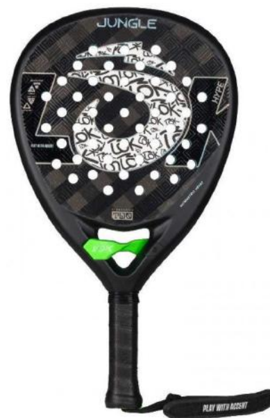
LÖK y su pala con abrebotellas

Por último, también hay espacio para propuestas más rompedoras. LOK, segunda