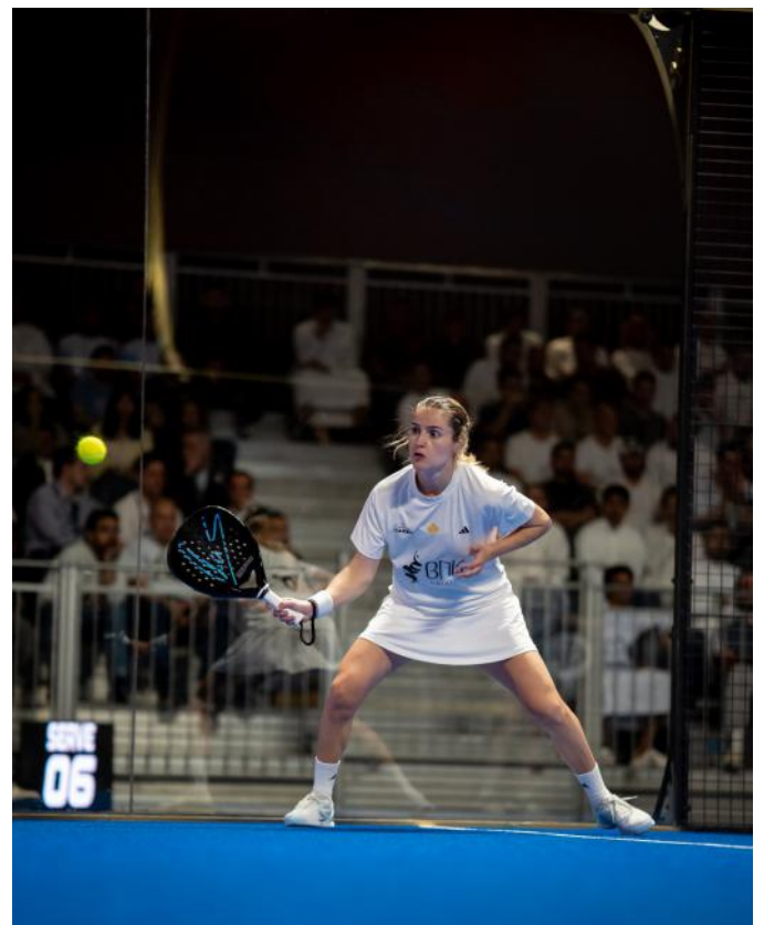
Garantía en el 20x10

Si miramos el palmarés de Ari, podemos ver que es simplemente impresionante. Un palmarés al alcance de muy pocas jugadoras en la historia de este maravilloso deporte. 54 títulos, dos años número uno del mundo y un largo etc... Además, junto a su histórica compañera Paula Josemaría, ha sido parte de la pareja femenina con más títulos en la historia del pádel(44), marcando una época dorada en este deporte.