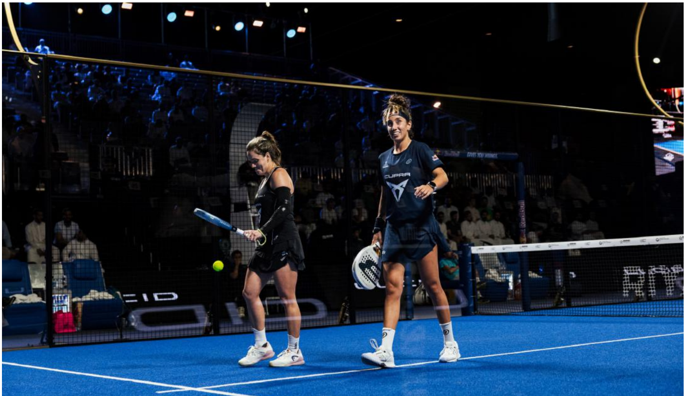
Lo que si, es una pareja que jamás va a perder su sonrisa

Riad no ofreció el estreno soñado para la pareja más esperada del año. Sin embargo, la temporada apenas comenzó y el calendario les dará múltiples oportunidades de revancha. Si algo demostró el primer P1 fue que el camino hacia la cima no va a admitir improvisaciones y que cada sociedad necesitará algo más que nombres para poder alcanzar lo que todas las parejas del circuito quieren, el N°1.