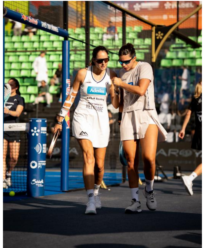
Unión durante la final