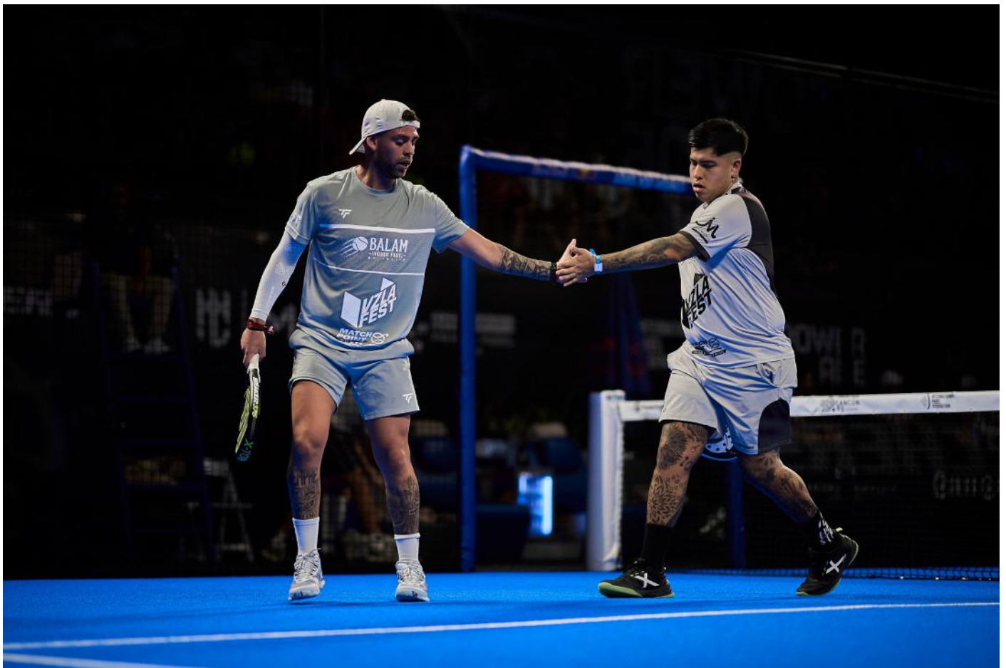
La pareja acortó plazos aprovechando el plante de los jugadores