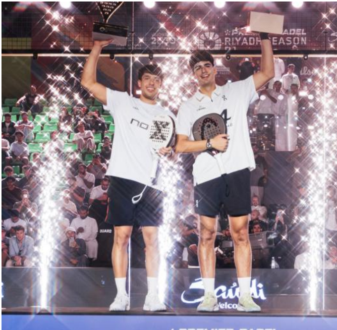
Los Números 1 siguen arrasando

Ya finalizado el primer torneo de la temporada podemos empezar a sacar conclusiones, aunque todavía es demasiado pronto para tomarlas demasiado en serio.