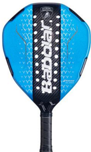
Babolat Lamborghini BL003

Diseño radical, estética inspirada en la automoción de lujo, unidades limitadas.