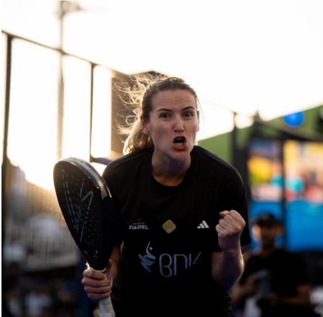
Siempre con ganas de ganar

En un deporte que cada vez gana más seguidores y reconocimiento internacional, el nombre de Ari Sánchez aparece con letras doradas en la historia del pádel. Sin embargo, a pesar de sus logros extraordinarios, su figura no siempre recibe el reconocimiento mediático y popular que merece. Ari Sánchez es, sin duda, una de las jugadoras más dominantes de su generación... pero también, es sin duda una de las más infravaloradas.