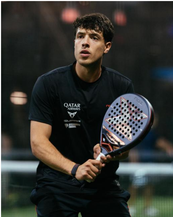
Tapia sigue reinando con NOX

Este baile de marcas no es solo una cuestión de patrocinios; es el reflejo de una industria que se profesionaliza a pasos agigantados. El jugador ya no elige solo por contrato, elige por sensaciones. Y nosotros, desde fuera, solo podemos disfrutar de cómo estas nuevas "armas" dictan sentencia en cada torneo.