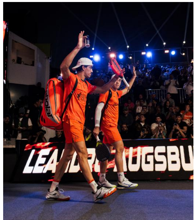
Empiezan el año dejando buenas sensaciones

¿Serán capaces de combatir a las dos mejores parejas de forma regular durante toda la temporada? ¿O solo veremos destellos espectaculares en algunos torneos mientras que a la larga los mismos de siempre se repiten en las finales?