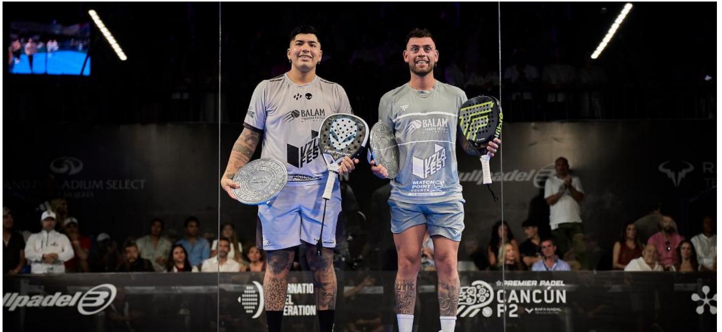
Subcampeones en Cancún

Un caso particular esta temporada es el de los “Mágicos” de A1 Pádel que en 2025 hicieron el cambio de circuito para aterrizar en Premier.