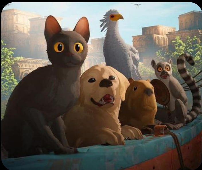
FOTO DE LA PELICULA FLOW

Gints Zilbalodis, es originario de la ciudad de Riga en Letonia, un país Europeo nació en 1994, actualmente tiene 30 años. Formado en Bellas Artes por la Escuela Superior Janis Rozentals de Riga, comenzó a estudiar animación 3D y composición musical de forma autodidacta.