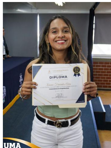
FOTOGRAFÍA DE LA UNIVERSIDAD MARISTA