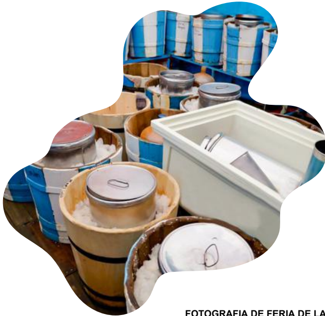
FOTOGRAFIA DE FERIA DE LAS NIEVES