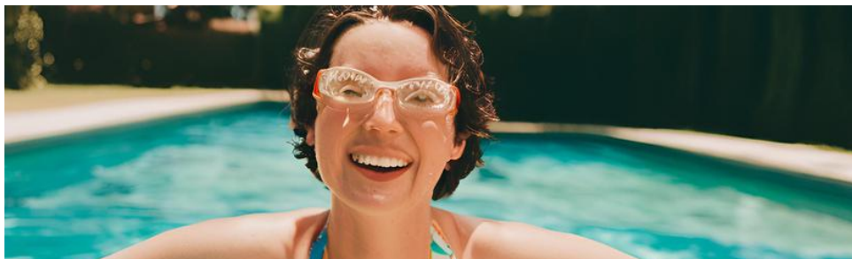
FOTOGRAFÍA CREADA CON IA

Ideal para: Diversión familiar y toboganes