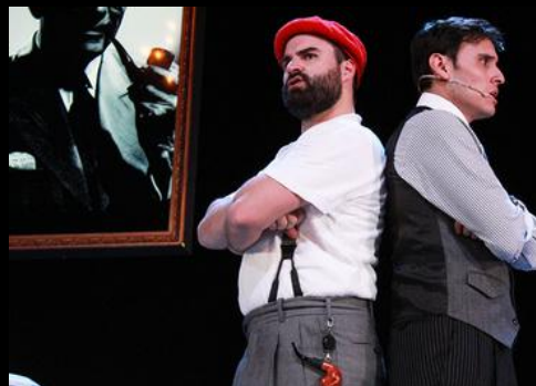
FOTOGRAFIA DE EL AQUELARRE.COM