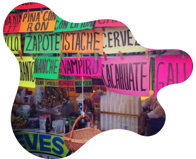
FOTOGRAFIA DE FERIA DE LAS NIEVES

Esta feria, reconocida como una de las más antiguas y emblemáticas de la Ciudad de México, se convirtió en el lugar de congregación de numerosos visitantes que deseaban degustar una gran diversidad de nieves artesanales, hechas con recetas heredadas a través de generaciones.