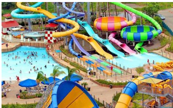
SIX FLAGS OAXTEPEC