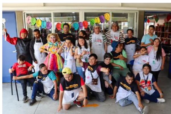
FOTOGRAFÍA DE LA UNIVERSIDAD MARISTA