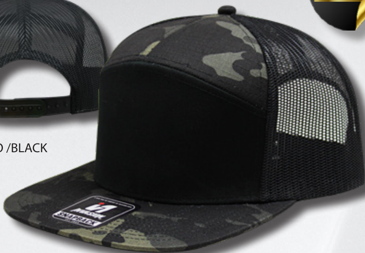
BLACK / CAMO / BLACK