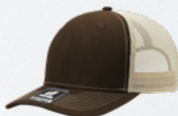
BROWN / STONE