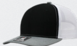
BLACK / HEATHER GREY / WHITE