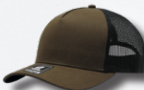
BROWN / BLACK