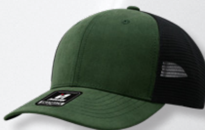
OLIVE / BLACK