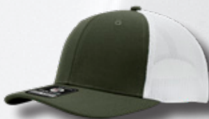
OLIVE HASTA AGOTAR EXISTENCIAS