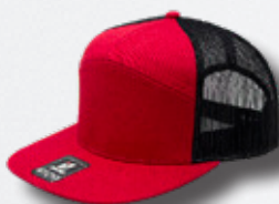
RED / BLACK