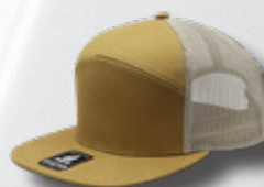
MUSTANG / BEIGE HASTA AGORTAR EXISTENCIAS