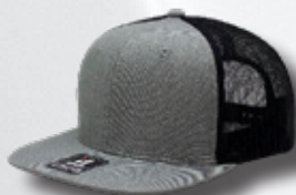
HEATHER GREY / BLACK