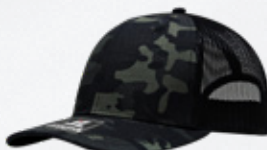
BLACK / CAMO