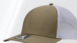
KHAKI / WHITE