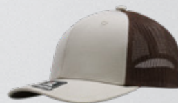
STONE / BROWN