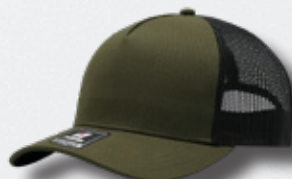
OLIVE / BLACK