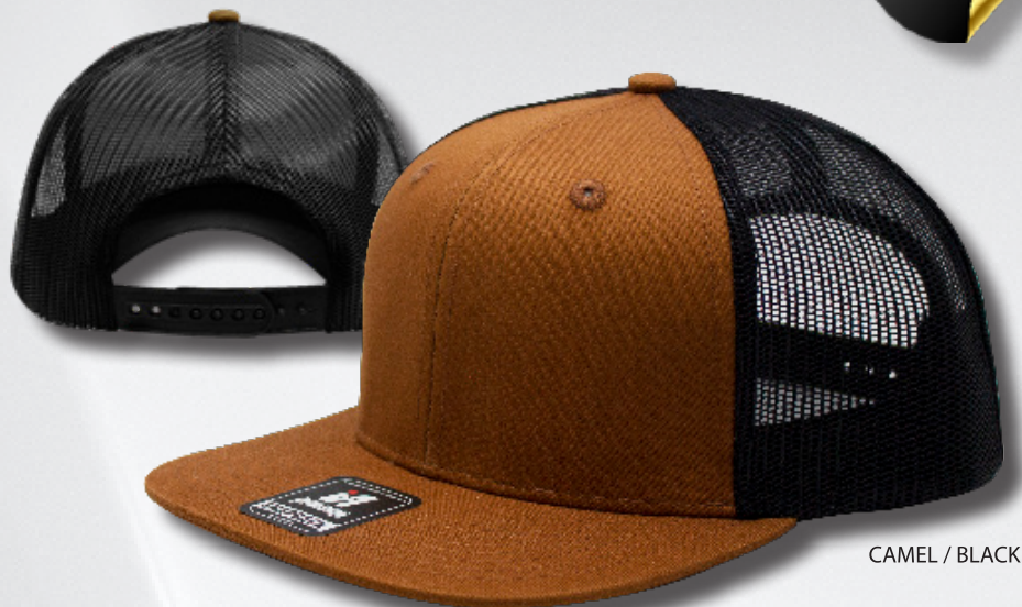
CAMEL / BLACK