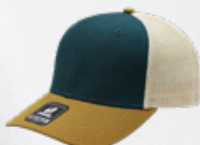
STEEL / CAMEL STONE