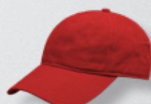
RED HASTA AGORTAR EXISTENCIAS