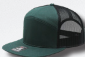
DK GREEN / BLACK