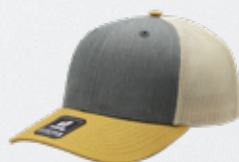
HEATHER GREY / MUSTARD / STONE