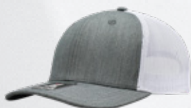
HEATHER GREY / WHITE