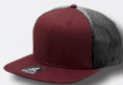
WINE / OXFORD