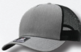
HEATHER GREY / BLACK