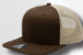
BROWN / KHAKI