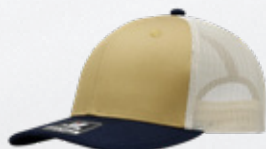
CORN / NAVY / STONE