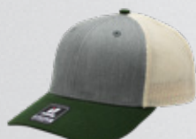
HEATHER GREY / OLIVE / STONE