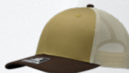
CORN / BROWN / STONE