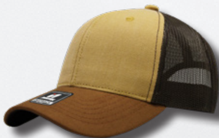
MUSTAGE CAMEL BROWN