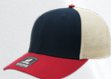
NAVY / WINE / STONE