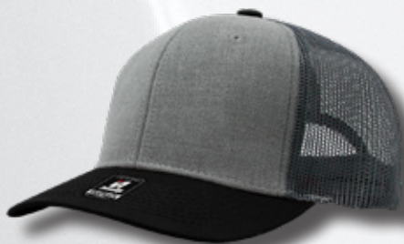
GREY / BLACK