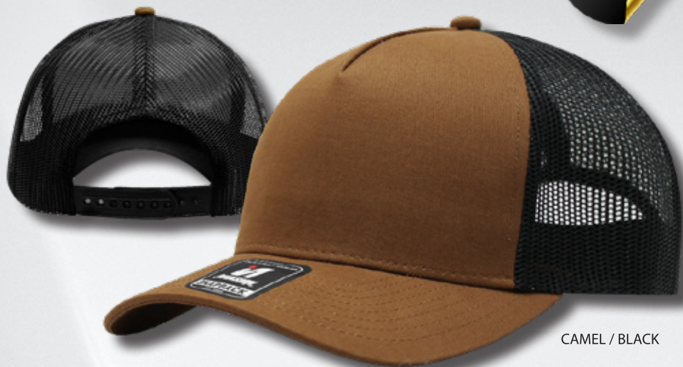
CAMEL / BLACK