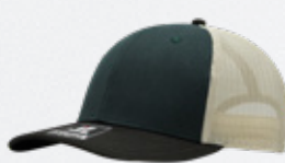
GREEN DK / BROWN / STONE