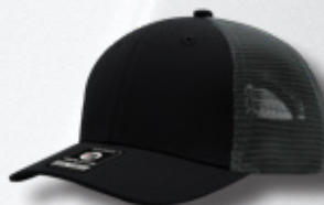
BLACK / OXFORD