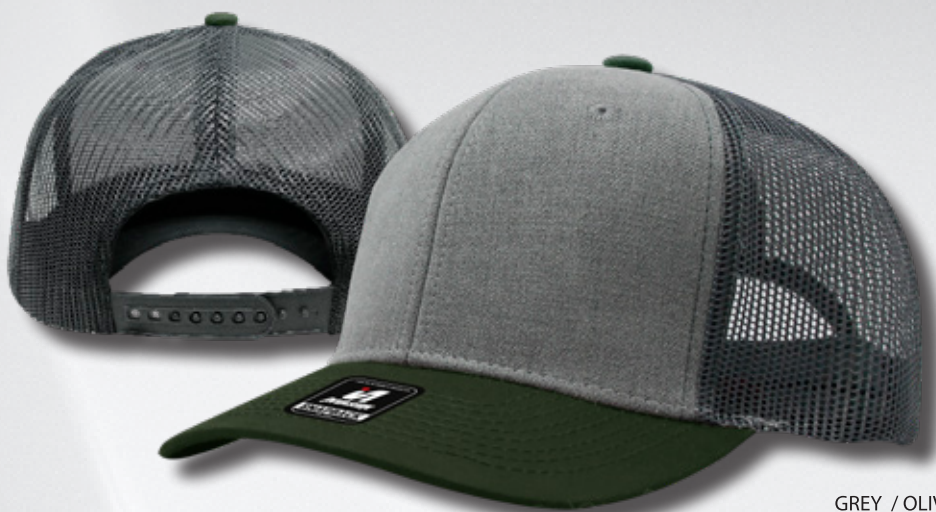
GREY / OLIVE