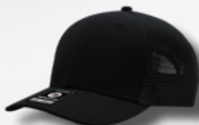
BLACK / BLACK