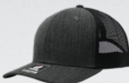
HEATHER BLACK / BLACK