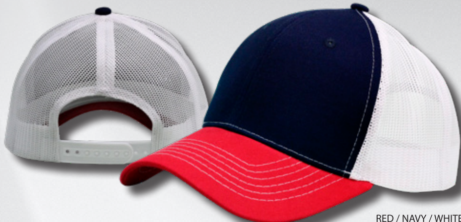
RED / NAVY / WHITE