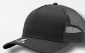
CHARCOAL / OXFORD