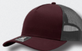
WINE / OXFORD