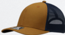
MUSTARD / NAVY