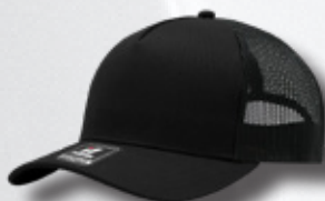
BLACK / BLACK