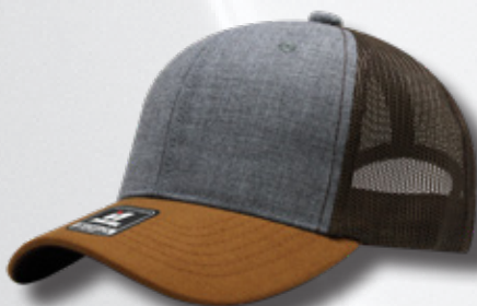
HEATHER GREY CAMEL BROWN