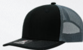
BLACK / OXFORD