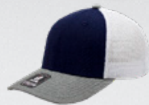
NAVY / HEATHER GREY / WHITE