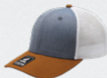
BLUE / CARAMEL / WHITE