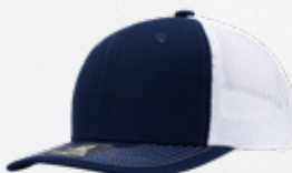
NAVY / WHITE