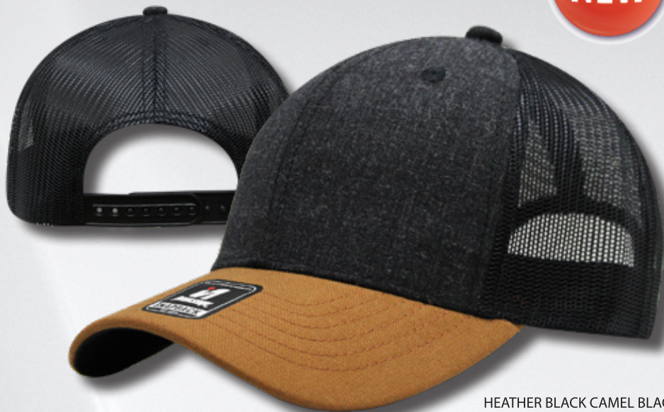
HEATHER BLACK CAMEL BLACK