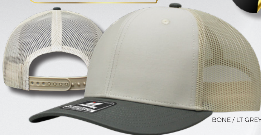
BONE / LT GREY / STONE