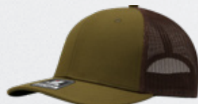
MOSS / BROWN