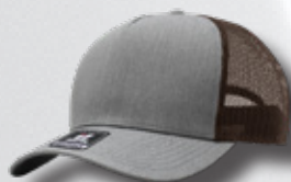
HEATHER GREY / BROWN HASTA AGORTAR EXISTENCIAS