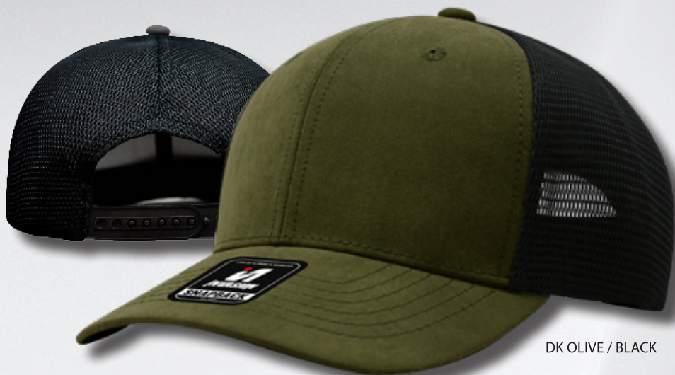
DK OLIVE / BLACK