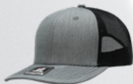
HEATHER GREY / BLACK