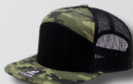
CAMO / BLACK HASTA AGORTAR EXISTENCIAS