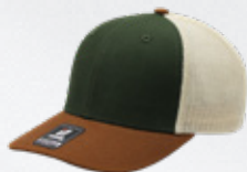
OLIVE / BROWN / STONE