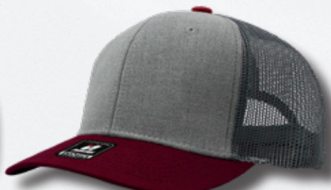
GREY / BURGUNDY