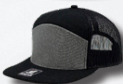
BLACK / HEATHER GREY / BLACK