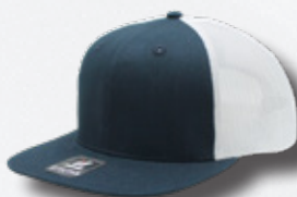
NAVY / WHITE