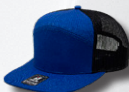
ROYAL / BLACK