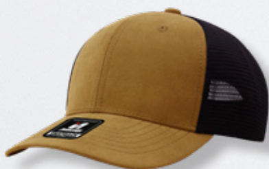
CAMEL / BLACK