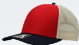
RED / BLACK / STONE