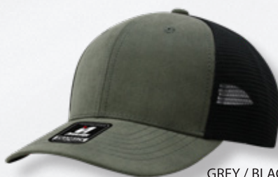
GREY / BLACK