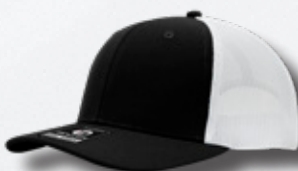
BLACK / WHITE