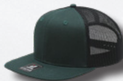
DK GREEN / BLACK