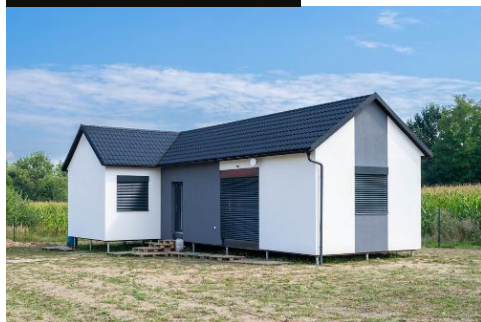
2 modules van 10 x 4,5 m + 8 x 4,5 m