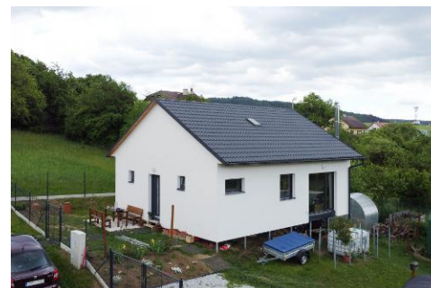
1 module van 10 x 8,4 m