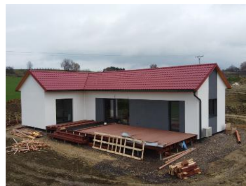
2 modules van 11 x 4,5 m + 8,5 x 4 m