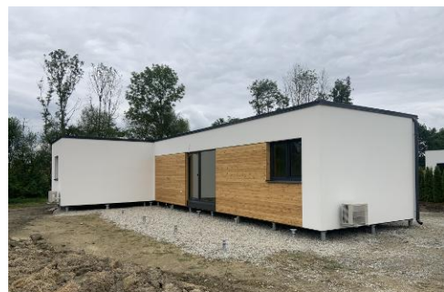
2 modules van 11 x 4,5 m + 11 x 3,1 m