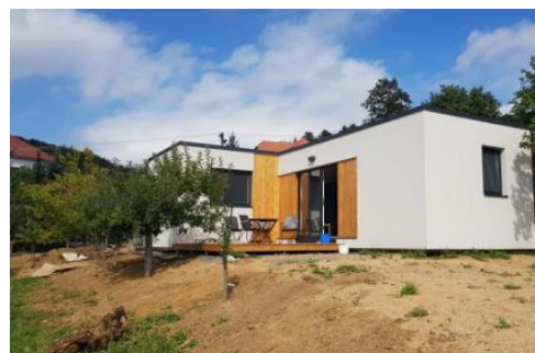
2 modules van 12 x 4 m + 4 x 3,5 m