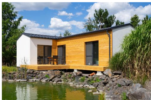
2 modules van 12 x 4,5 m + 4 x 3,1 m