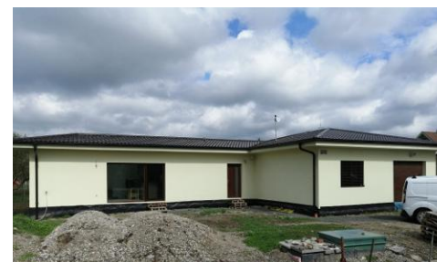
3 modules van 12 x 4 m + 10 x 4 m + 10 x 4 m