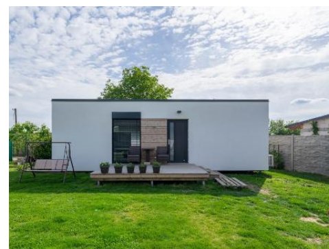
1 module van 13 x 4,5 m