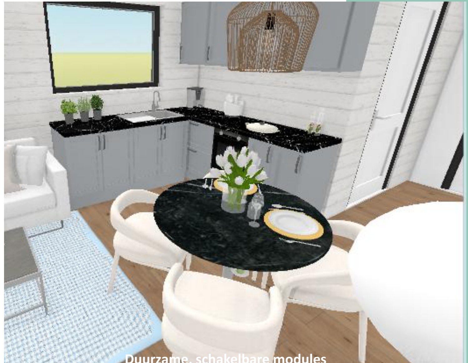
Duurzame, schakelbare modules

Want de flexibiliteit van dit concept zit hem ook in de verplaatsbaarheid. Wanneer je de modules niet meer nodig hebt, dan verkoop je ze gewoon.