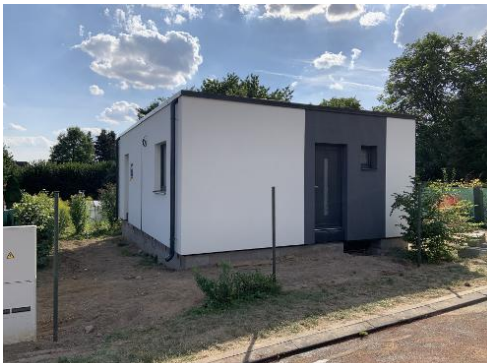
2 modules van 8,6 x 6,8 m