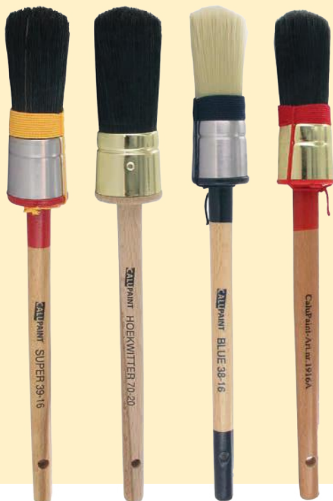
Art. nr. 139NR8

Voor het maken van een goede patentpuntkwast worden synthetische of natuurlijke haren - en dan met name varkensharen - gebruikt. Elk met hun eigen voordelen en toepassingen. Voor de verlijming van de haren wordt veel gekozen voor tweecomponenten kunsthars. Deze hars is bestand tegen oplosmiddelen, waardoor haaruitval voorkomen wordt. De ring of bus kan verzilverd of verkoperd zijn, maar ook bijvoorbeeld gemaakt worden van inox. Deze materialen kunnen tegen een stootje en u hoeft niet bang te zijn voor roest of verkleuring van de verf. Een ander belangrijk onderdeel is de katoenen touwwoeling die niet opstroopt op loslaat. En dan hebben we tenslotte de steel. Vaak gemaakt van beukenhout voor een gemakkelijke ligging in de hand en de perfecte balans bij het schilderen.