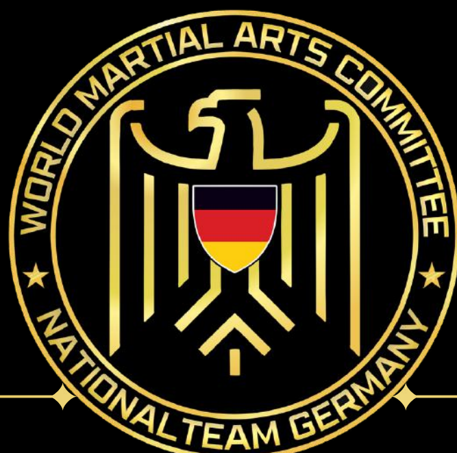
Das Logo des WMAC WORLD ELITE NATIONALTEAMS DEUTSCHLAND

Das ELITE-Logo Österreichs orientiert sich am Wappentier, dem Bundesadler der Republik Österreich, und ist an diesen angelehnt. Zusätzlich enthält es die Landesfarben Rot-Weiß-Rot im Wappen.