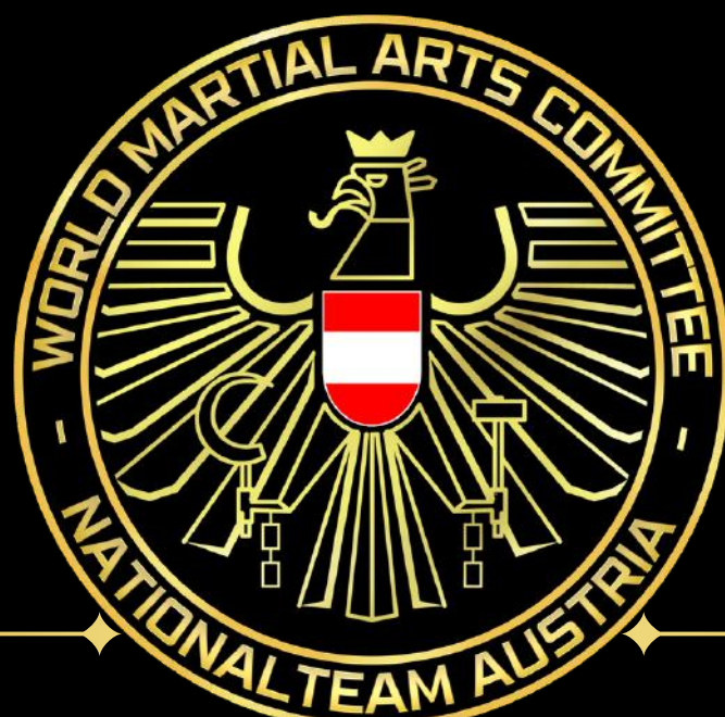
Das Logo des WMAC WORLD ELITE NATIONALTEAMS ÖSTERREICH

Wird nur durch das WMAC WORLD PRÄSIDIUM verwendet. Es gilt als Siegel für ELITE Dokumente. Elite Regularien und Dokumente die dieses Logo in Verbindung mit einem Präsidentensiegel enthalten, wurden vom World Präsidium verifiziert.