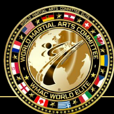
Das WMAC ELITE LOGO

Die Elite Logos sind weltweit in Gold-Schwarz gestaltet. Nur aktuelle Mitglieder und Trainer dürfen sie offiziell tragen; ehemaligen Mitgliedern ist das Tragen im privaten Raum erlaubt. Für Werbung oder Merchandising ist eine Genehmigung des WMAC WORLD Präsidiums erforderlich. Fan- und Unterstützerartikel mit dem ELITE Logo müssen entsprechend gekennzeichnet sein.