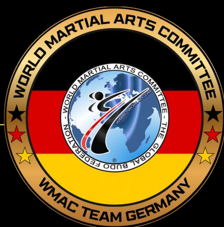
WMAC TEAM GERMANY

Die Logos für die Mitglieder der nationalen WMAC-Teams basieren auf den WMAC-Logos von Österreich und Deutschland. Sie sind zudem im Außenbereich in Gold gehalten und präsentieren die Sterne in den Farben der jeweiligen Nation.