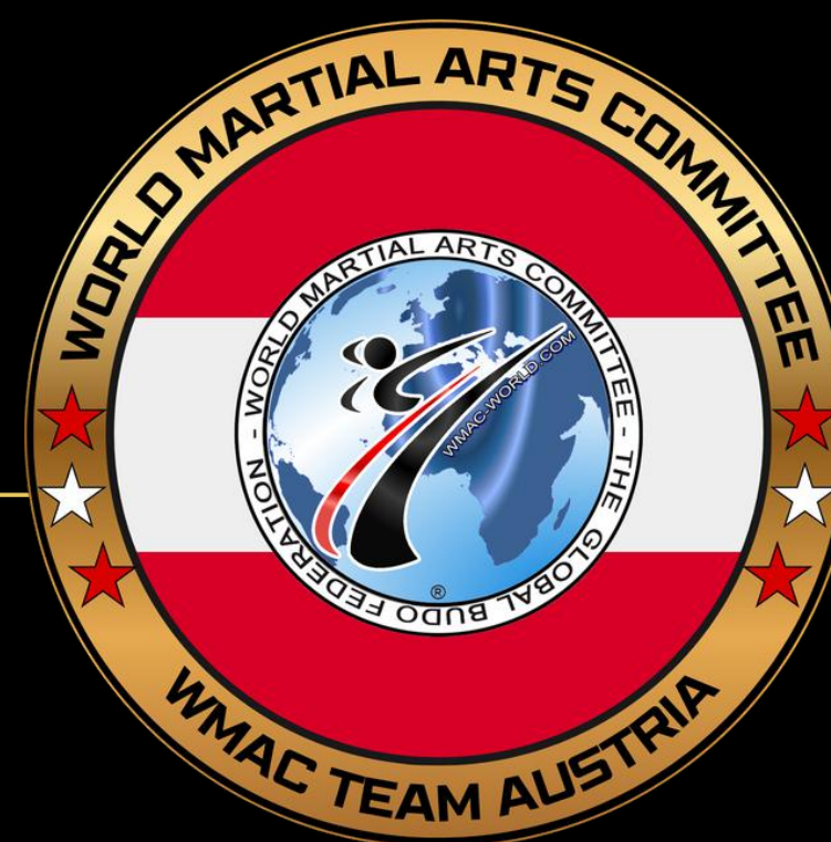
WMAC TEAM AUSTRIA