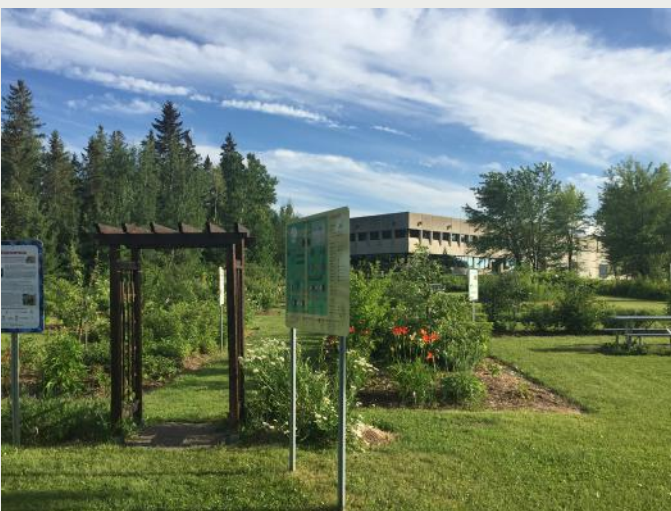
Forêt nourricière de Saint-Félicien sur les terrains du Cégep.

Le Cégep mise sur l'harmonisation de sa formation avec la réalité du marché du travail. Lors de tes études collégiales, tu auras l'opportunité de contribuer au dynamisme d'un monde en pleine évolution. Par exemple, en collaboration avec l'entreprise Euréko!, la Ville de Saint-Félicien et d'autres partenaires du milieu, une forêt nourricière a été aménagée en 2017 sur le terrain du Cégep selon un concept de permaculture. Le but est bien sûr d'offrir des produits comestibles frais et biologiques, mais aussi accessibles et gratuits, à la communauté.