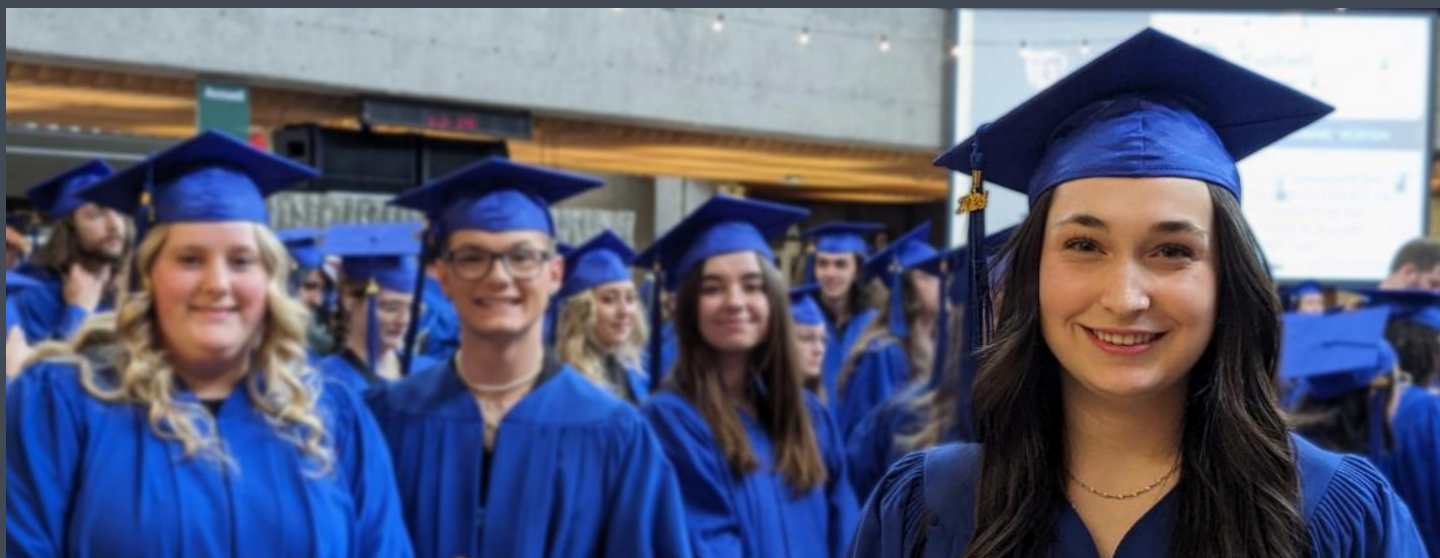
Cérémonie de remise des diplômes pour célébrer en grand la réussite, l'engagement et la persévérance des finissant.e.s, mai 2024.

Services adaptés offerts aux personnes présentant des limitations fonctionnelles causées par une déficience physique, organique et sensorielle, un problème de santé mentale, un trouble d'apprentissage, etc.