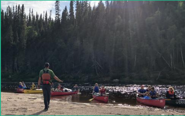
Séjour en canot dans le cadre d'un cours en éducation physique sur la rivière Mistassini.