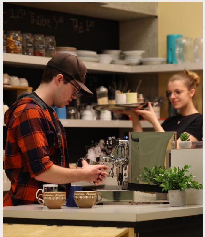
Le Café étudiant du Cégep, le Cafénomade-Abioki, offre des produits biologiques, équitables et abordables.

Si tu as à cœur le développement durable et l'environnement, tu pourras t'impliquer dans le cadre d'activités parascolaires supportées, entre autres, par le comité étudiant environnement Les Bleuets verts et l'équipe du Café étudiant.