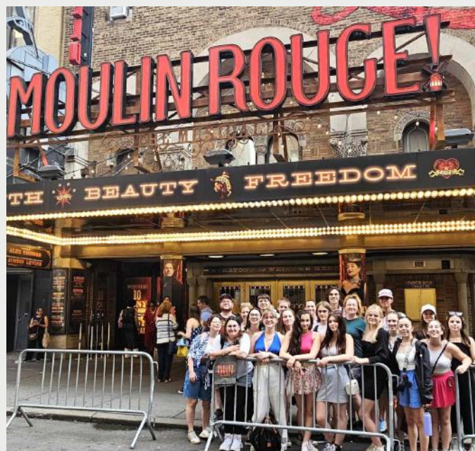
Voyage culturel à New York pour les étudiant.e.s en Arts, lettres et communication, juin 2024.