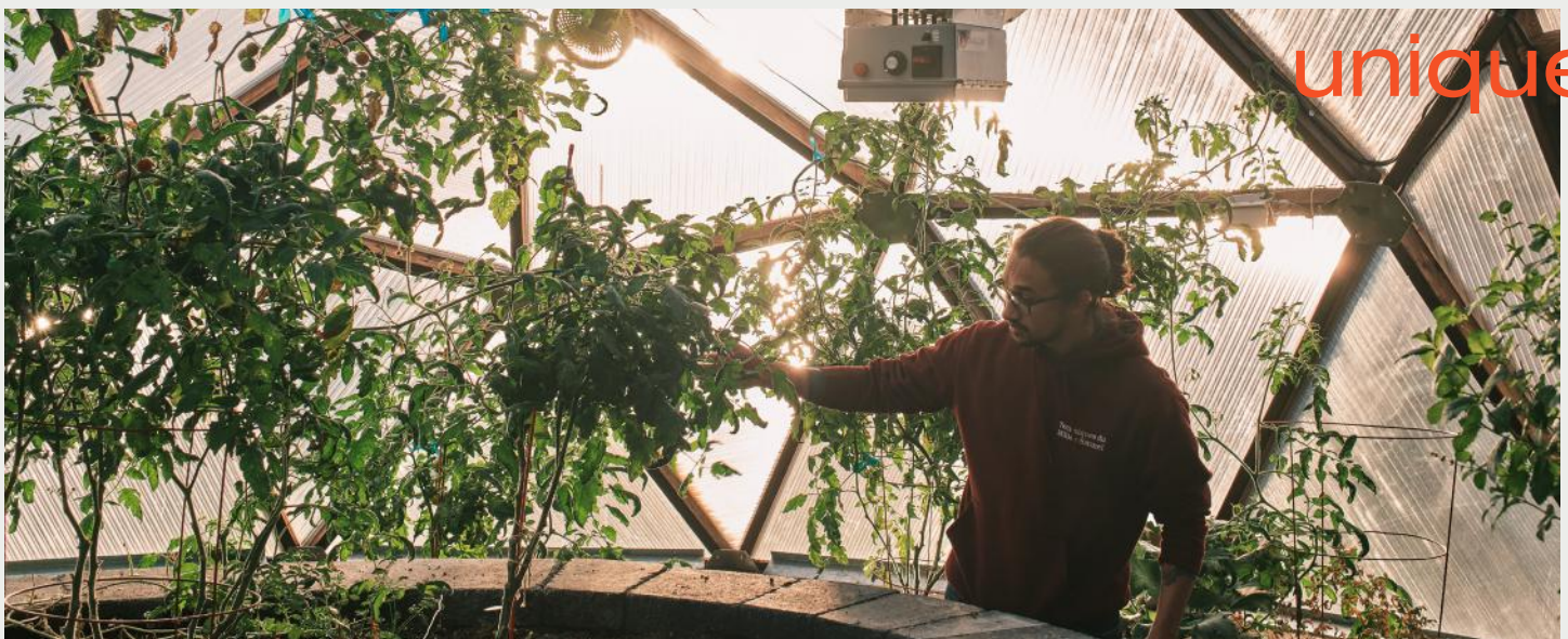
La serre passive du Cégep a été créée sous l'initiative de l'équipe Alimaculture dans les cours de Gestion de projet en développement durable.