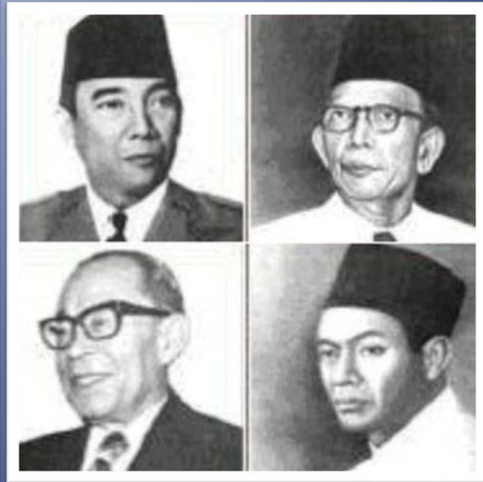
Empat Serangkai pendiri Pusat Tenaga Rakyat (Putera), (searah jarum jam), Soekarno, Ki Hajar Dewantara, KH Mas Mansyur, dan Moh Hatta.