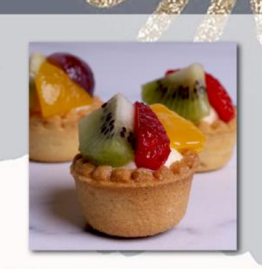
Τάρτα xss • Tart xss