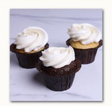
Muffin με Βουτυρόκρεμα