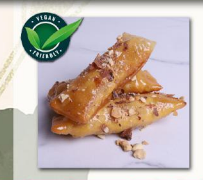
Δάχτυλο με Αμύγδαλο