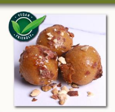
Μπουκιά με Αμύγδαλο