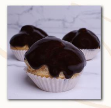
Choux with Cream