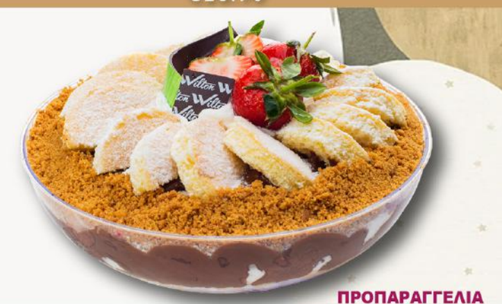
Viennese Waltz €22.00ss / €27.00ls 🗪 ORDER