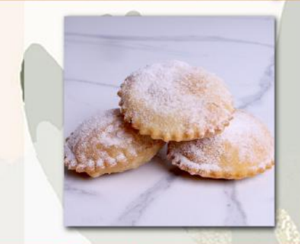
Πουρέκι • Poureki