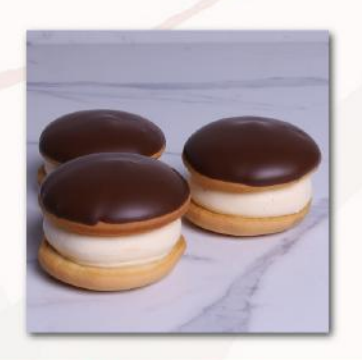
Κοκ • Kok

Orders Must Be Placed 7 Days Before Your Event. Cancellation Is Accepted 5 Days Before Your Event. (Minimum Quantity 10pcs)