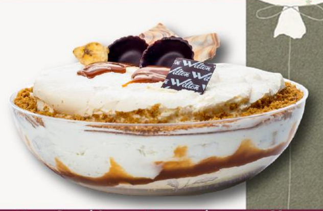
Καρδινάλιος Μπανάνα Toffee