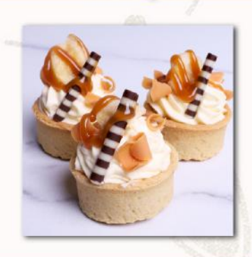
Τάρτα Μπανάνα Toffee