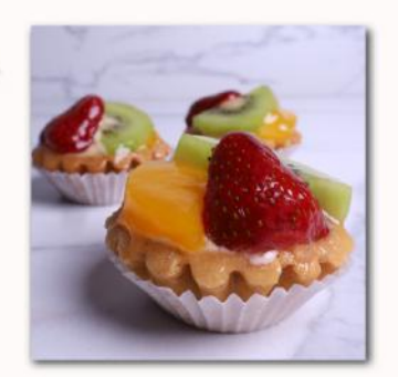
Τάρτα ss • Tart ss