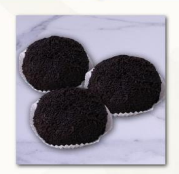
Τρούφα • Truffle