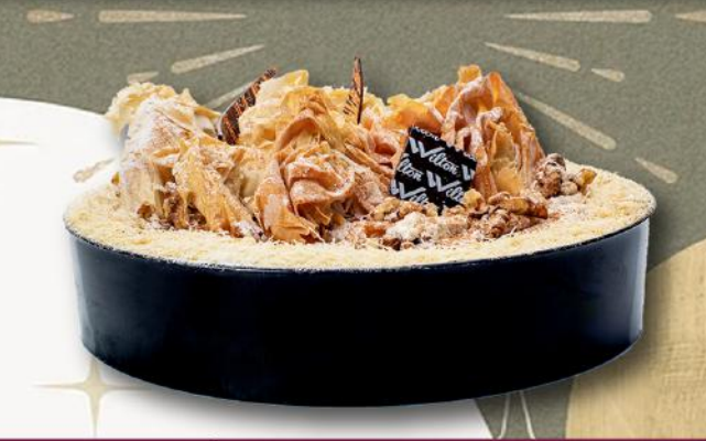
Αναρόκρεμα • Anari Cream