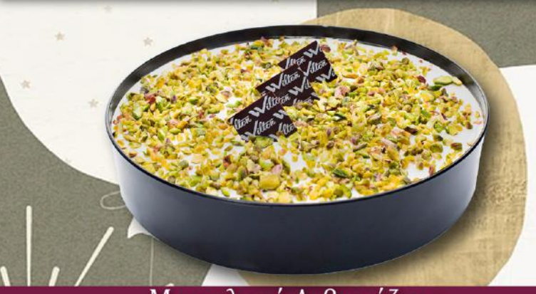
Μαχαλεπί Λιβανέζικο Lebanese Mahalepi €18.90