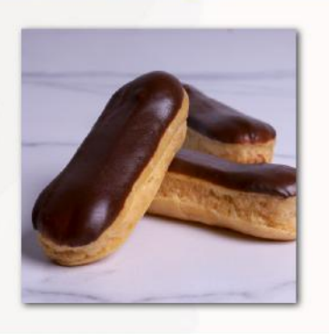
Εκλαίρ • Éclair