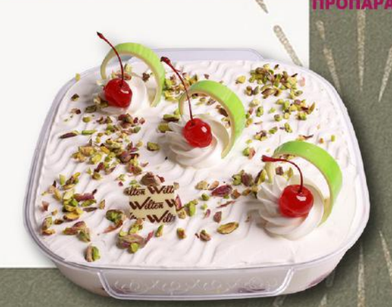
Εκμέκ Βατόμουρο • Ekmek Raspberry