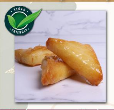
Τρίγωνο με Κρέμα