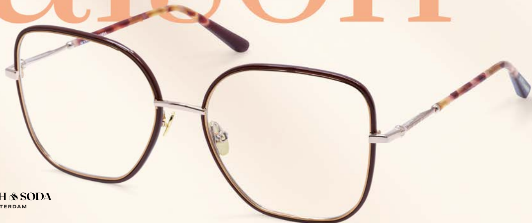
SCOTCH & SODA AMSTERDAM