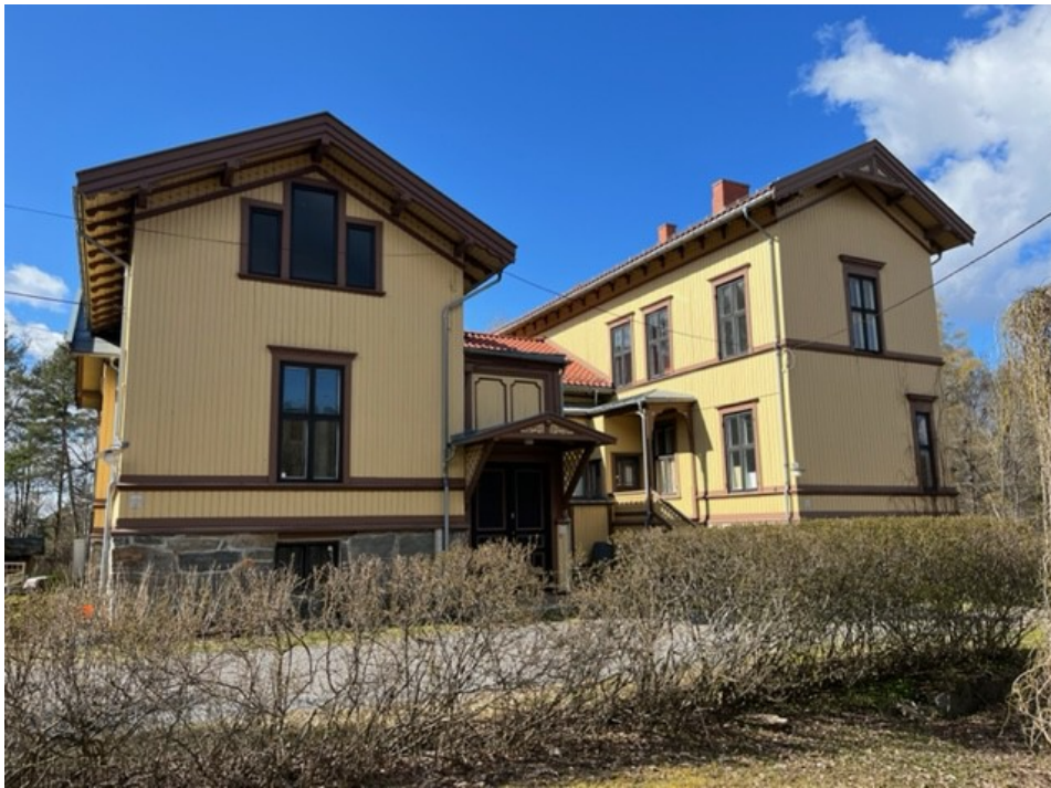
Våningshuset på Store Ljan gård Foto: Gunnar Hauger, april 2023