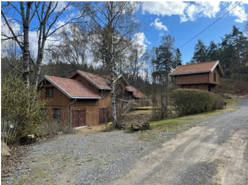
Låven og stabburet på Store Ljan gård

Vognskjulet/garasjen ligger et stykke bak (sør for) stabburet.