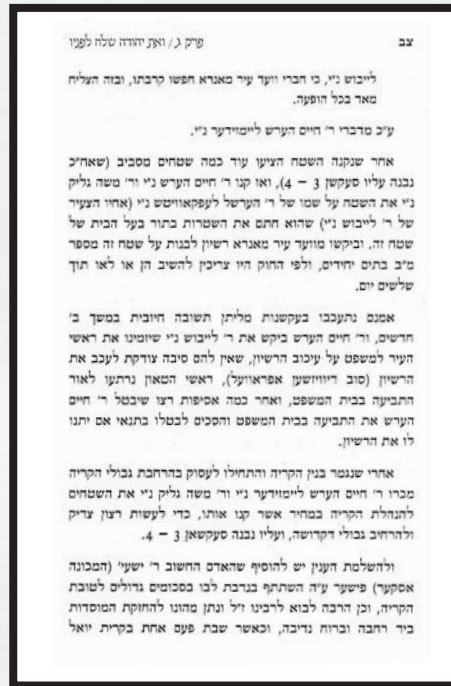
פּאָטאַסטאַט פון ספר רצון צדיק ווי עס ווערט געשילדערט די שוועריגקייטן פון טאון און מאנרא צו באקומען די אפראוועל'ס און די געריכט געראנגעל איבער דעם

דאס קומענדיגע מאל וואס די אגענטן פון די באנק זענען געקומען פאר אן אינספעקשאן ביי די הייזער, כדי מען זאל קענען באשטעטיגן דעם מארגעזש, איז געווען ארום 7-8 וואכן בעפאר דעם דעדליין פון יולי דער ערשטער. די דירות זענען שוין געווען גרייט, חוץ די עלעקטעריק ווי דערמאנט, אבער דעמאלט איז דער עיב צוגעלאפן צו די באנק אינספעקטארס און ער זאגט זיי: "איך בין דא א שכן, ענק ווייסן פאר וועמען מען בויט דא? דאס איז פאר אידן. זיי זענען שווינדלער און באטריגער, איר וועט קיינמאל נישט