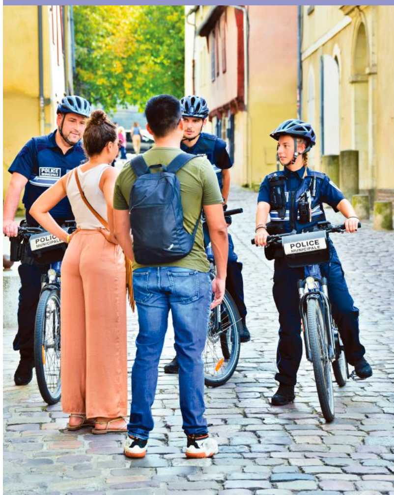
40 policiers municipaux supplémentaires ont été recrutés pour renforcer les équipes