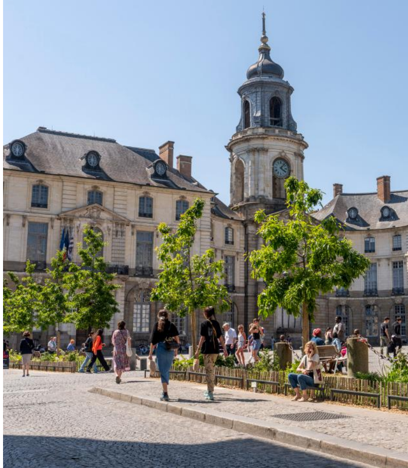
Plantation d'arbres en pleine terre sur la place de l'Hôtel de Ville