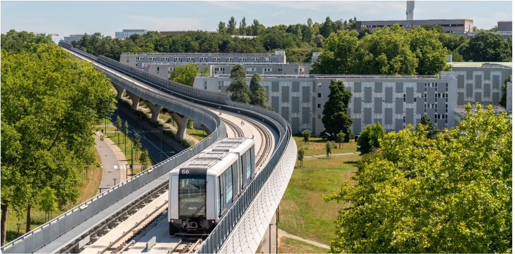
80 000 voyages par jour sur la ligne b du métro depuis son ouverture