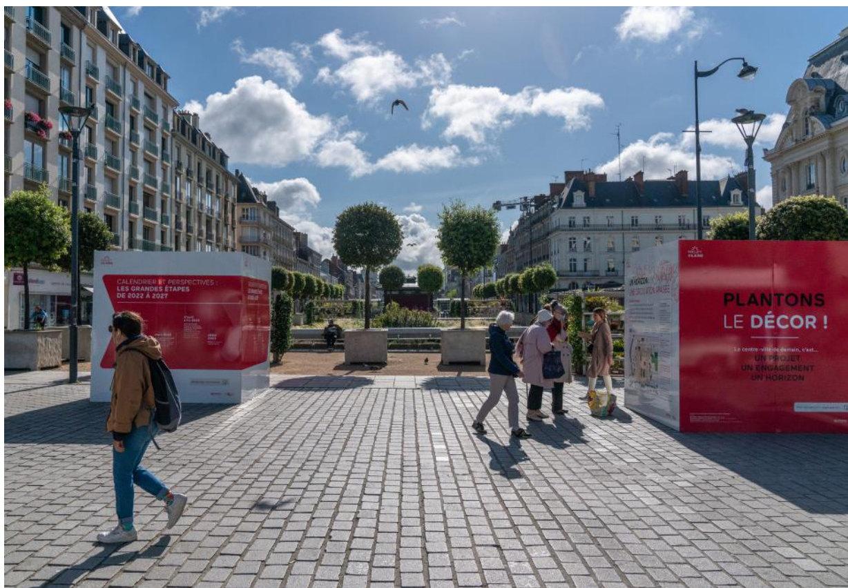
Un jury citoyen a été tiré au sort pour penser le devenir du parking Vilaine

associatif et multiplie les initiatives pour renforcer la démocratie participative. La Ville poursuit sa lutte résolue contre toutes les formes de discrimination.