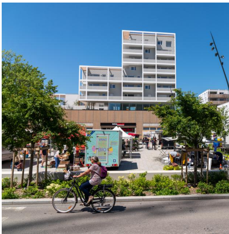
700 millions d'euros investis pour la rénovation urbaine de Maurepas, Le Blosne et Villejean