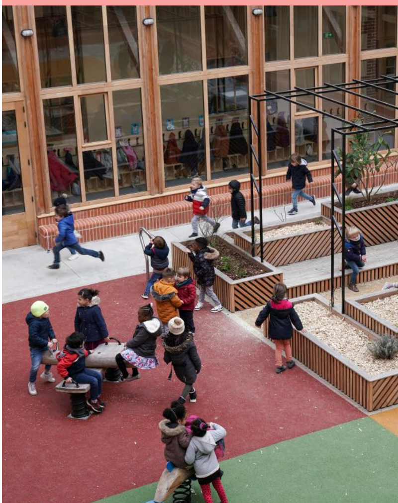
Ouverture de la nouvelle école Pasteur, après rénovation de l'ancienne faculté dentaire

Pour continuer à faire la ville avec ses habitantes et ses habitants, Rennes confirme son lien historique avec le monde