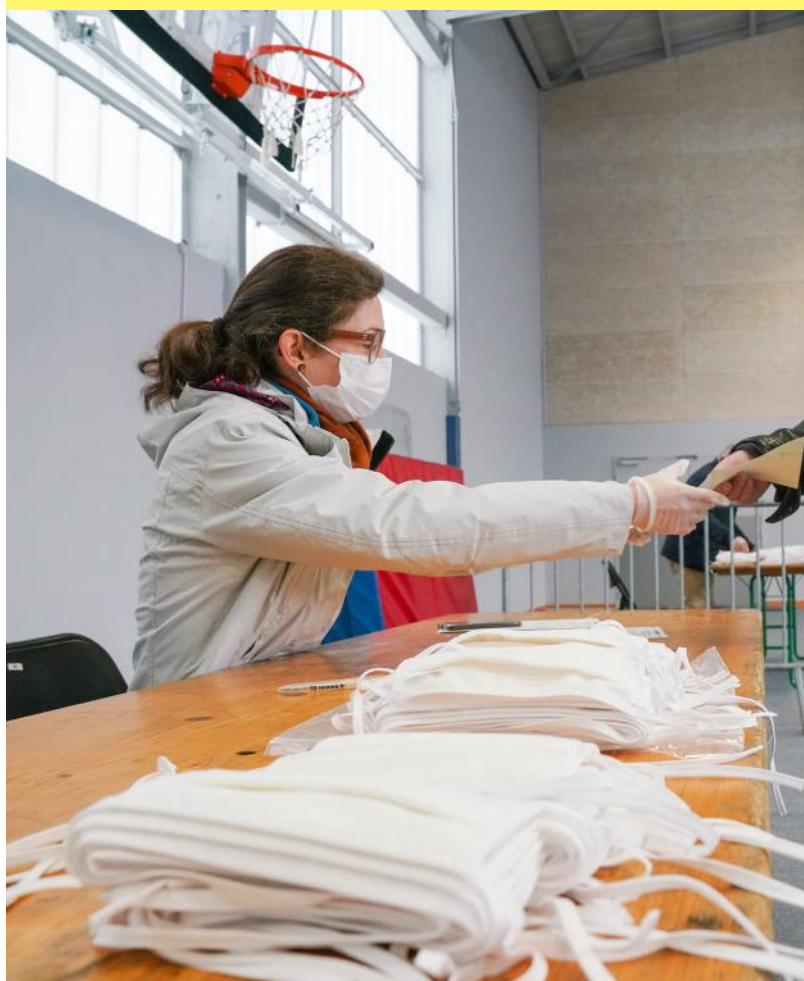
440 agents volontaires de la Ville de Rennes ont distribué des masques en tissu aux habitants

→ Le choix de la solidarité et de la protection