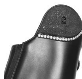
557220 Glamour Line Zucchero