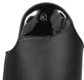
557222 Glamour Line Lack