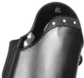
557218 Diamond Curve Zucchero

Ausstattungsvarianten immer Logo klein, schwarz