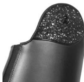
557221 Glamour Line Sparkling