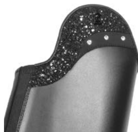
557219 Diamond Curve Sparkling