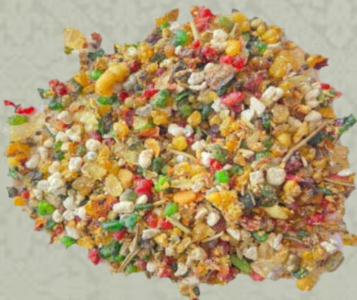
Esperanza de Triana