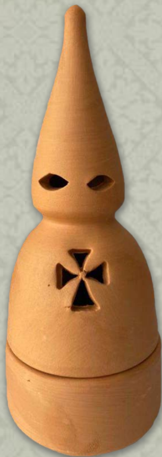
Cód. Paez: 140751

Incensarios hechos de barro que están pensados para ofrecer una visualización armoniosa y estética, consiguen aromatizar el recinto y desprender las propiedades del incienso adecuadamente. Medidas: 20 x 8 cm.