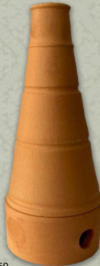
Cód. Paez: 140750