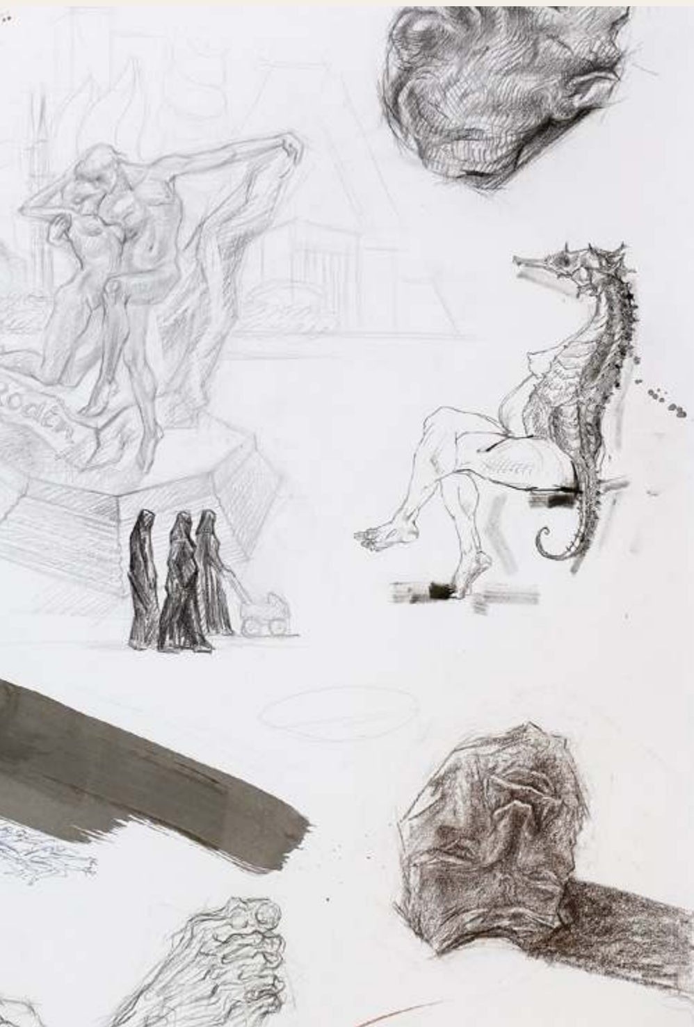
מרים גמבורד, HomoVulgaris (פרט), רישום, 160*100, 2018