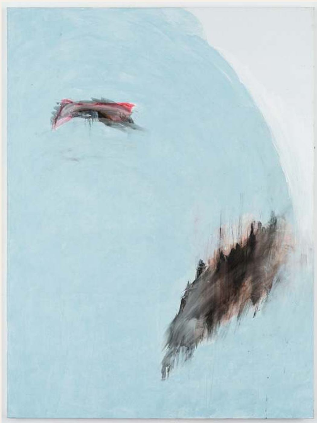
יהודית לוי, הליתן, חוף עזה, אקריליק על בד 150*200, 2012