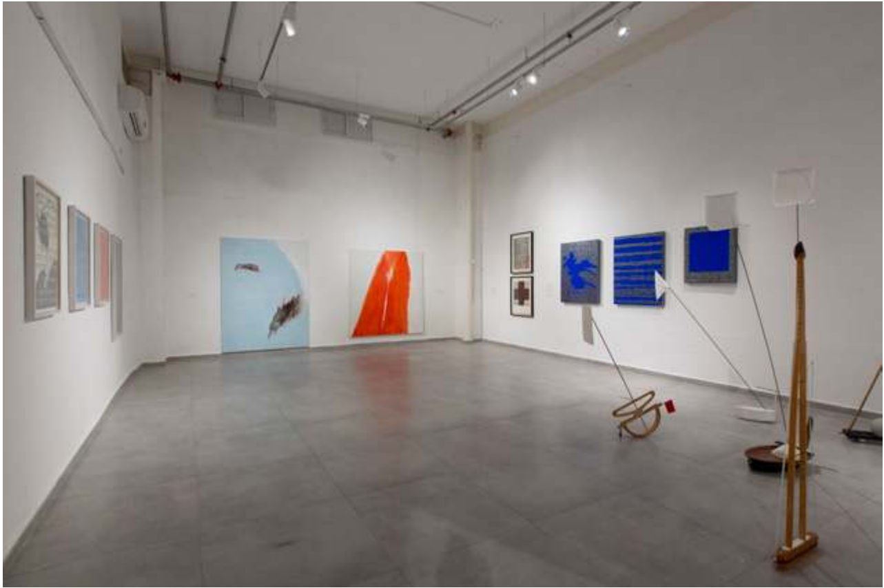
מראה הצבה מתוך התערוכה