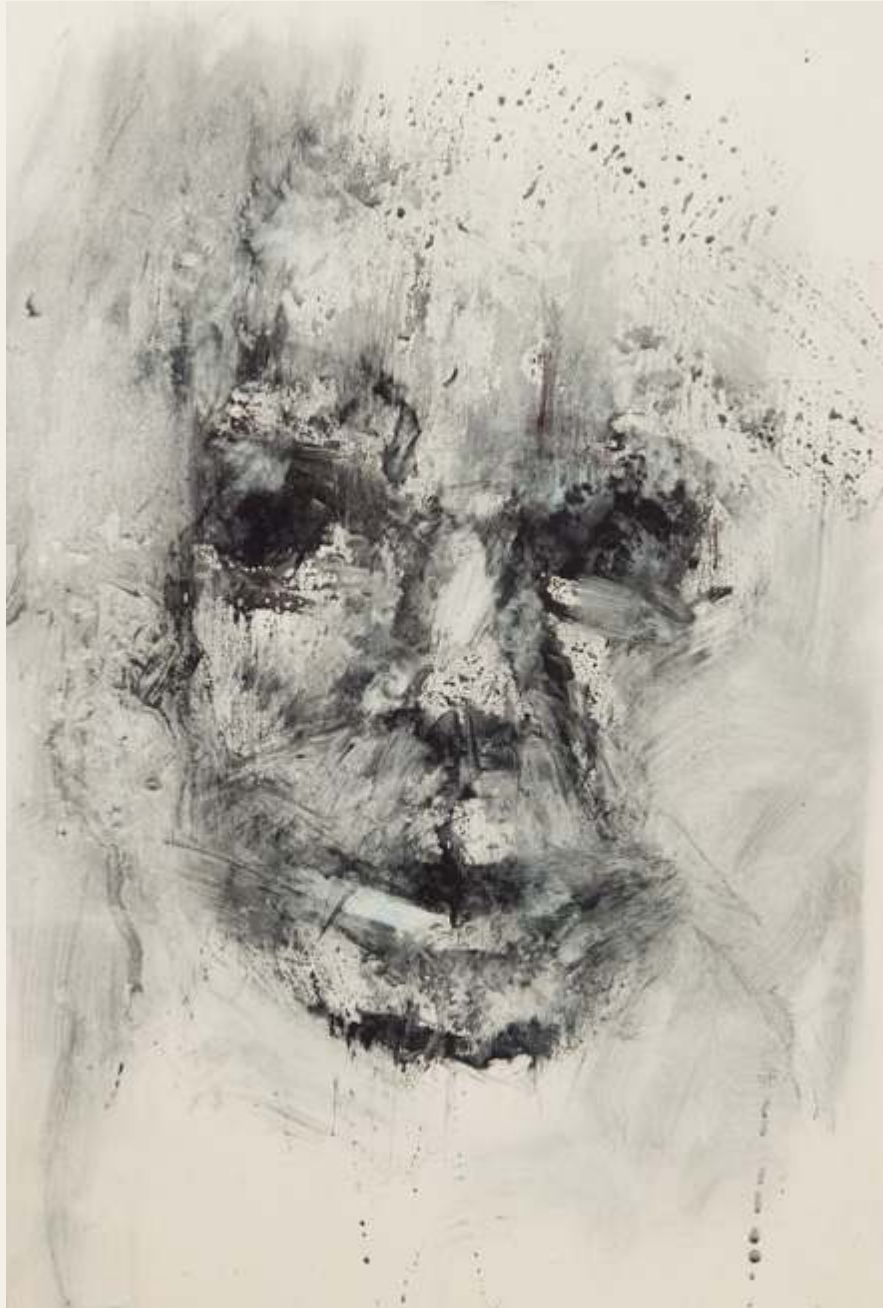
נעמי בריקמן, זום, צבע הדפס על נייר חלק, 25*35, 2020