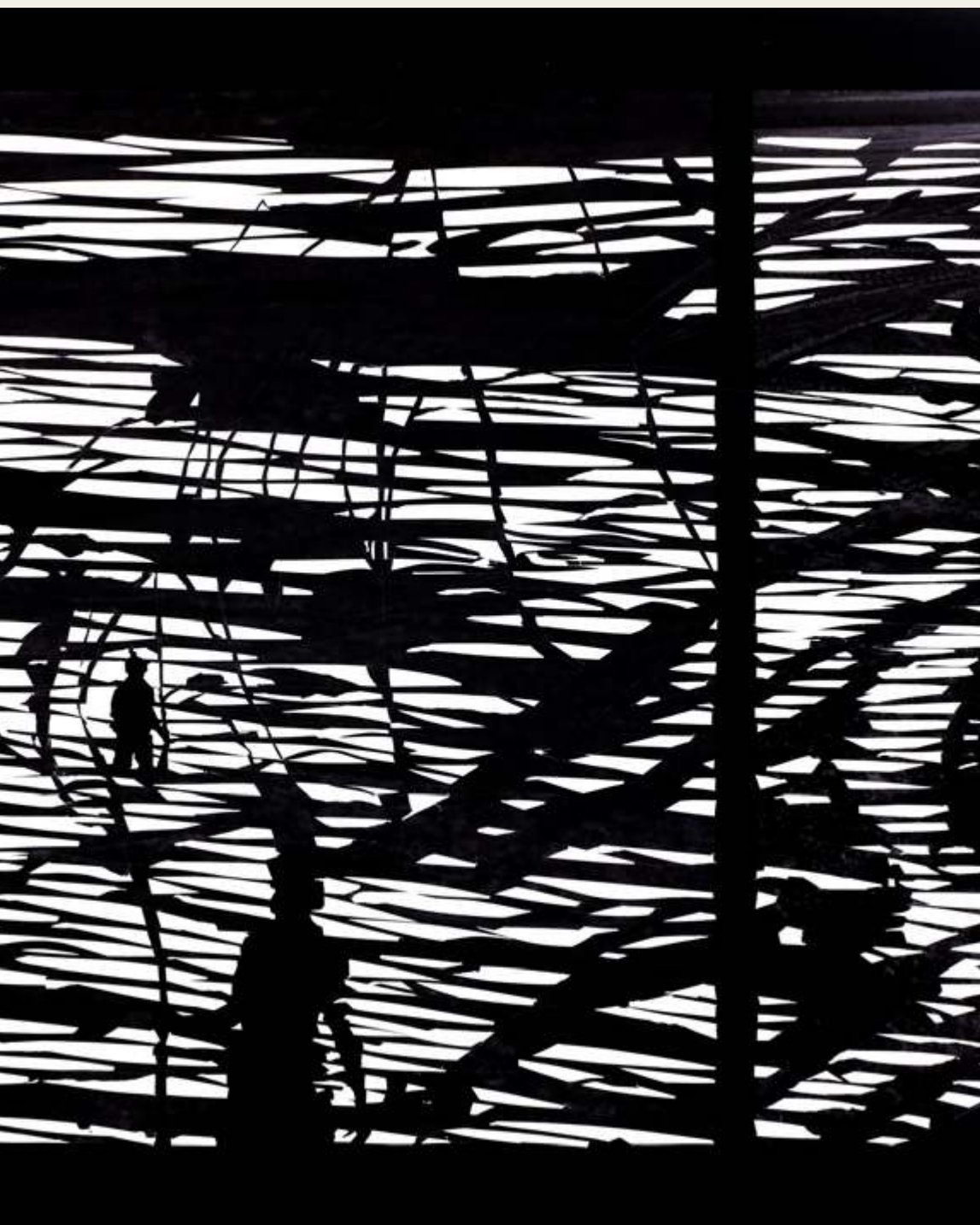
מאיה כהן לוי, הלך, מתוך נדודי לילה (פרט), צילום מקולף, 2016