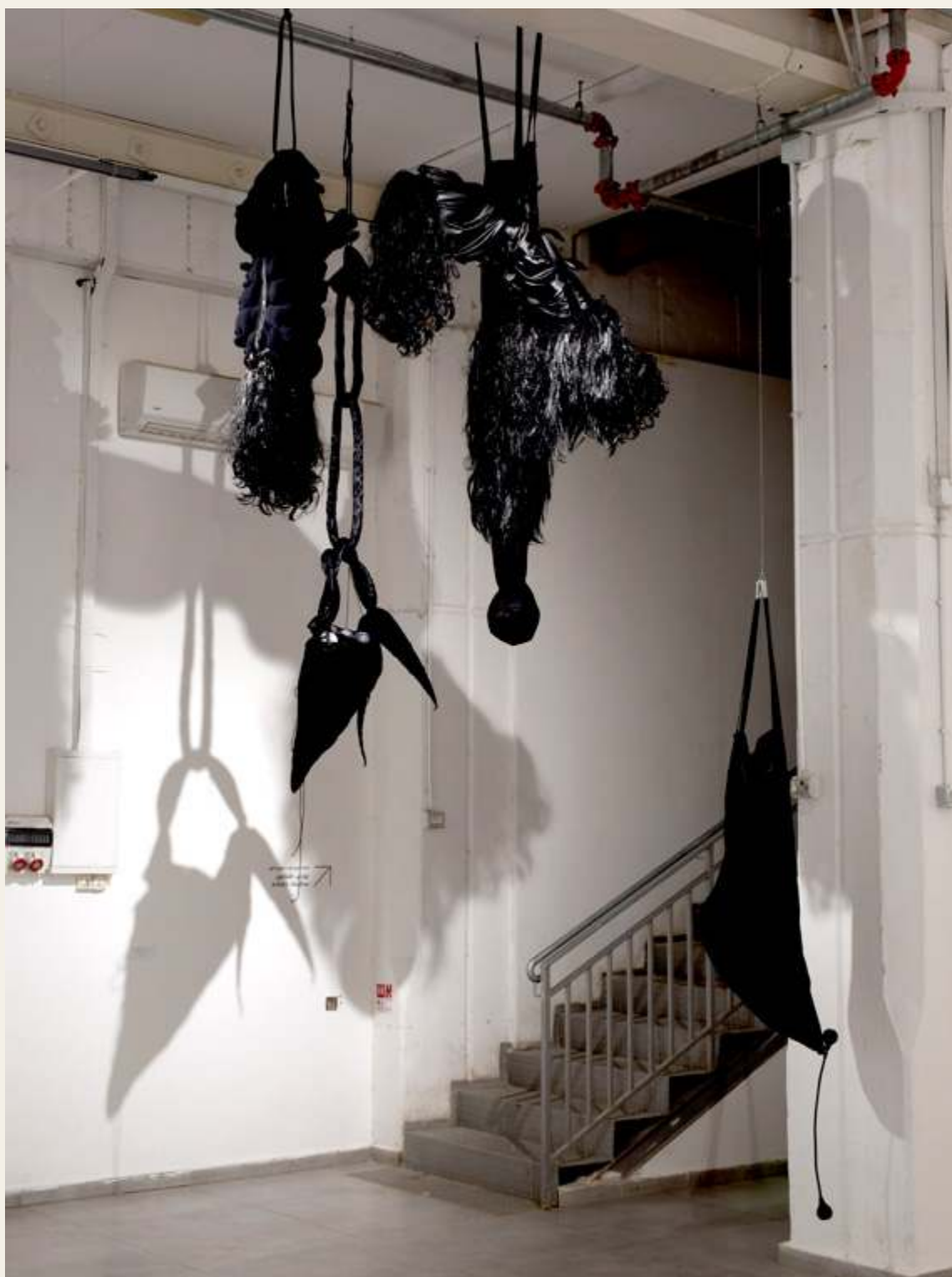
טסי כהן פפר, ללא כותרת, מראה הצבה, בדים שונים, טרטי קטיפה ובד, שערות מלאכותיות, מידות משתנות, 2020