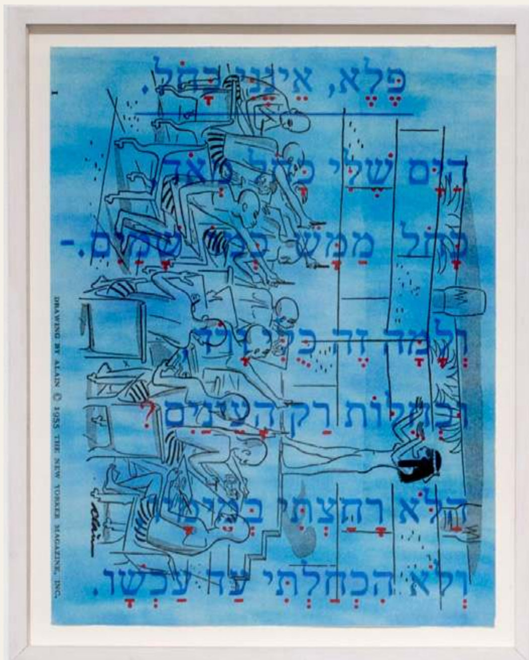
דגנית ברסט, פלא, אינני כחול, אנדה עמיר-פינקרפלד, הדפסת פיגמנט, עפרונות צבעוניים ואבקת פיגמנט על נייר, 65*50, 2016