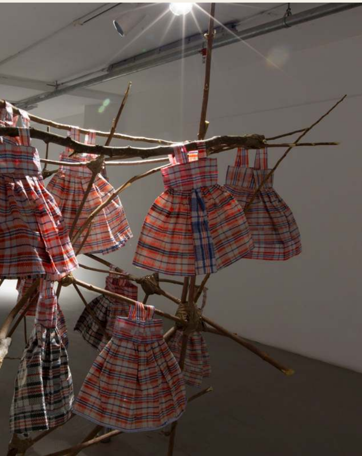
אתי ארברג'ל, ינקות (פרט) טכניקה מעורבת, תיקי מהגרים, עפרון, יציקות גבס, מיצב תלויי חלל, 2021