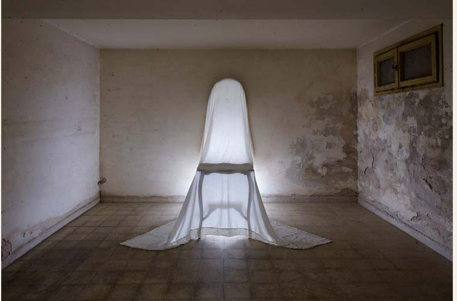
פטי גירש, A3177, צילום, 2017