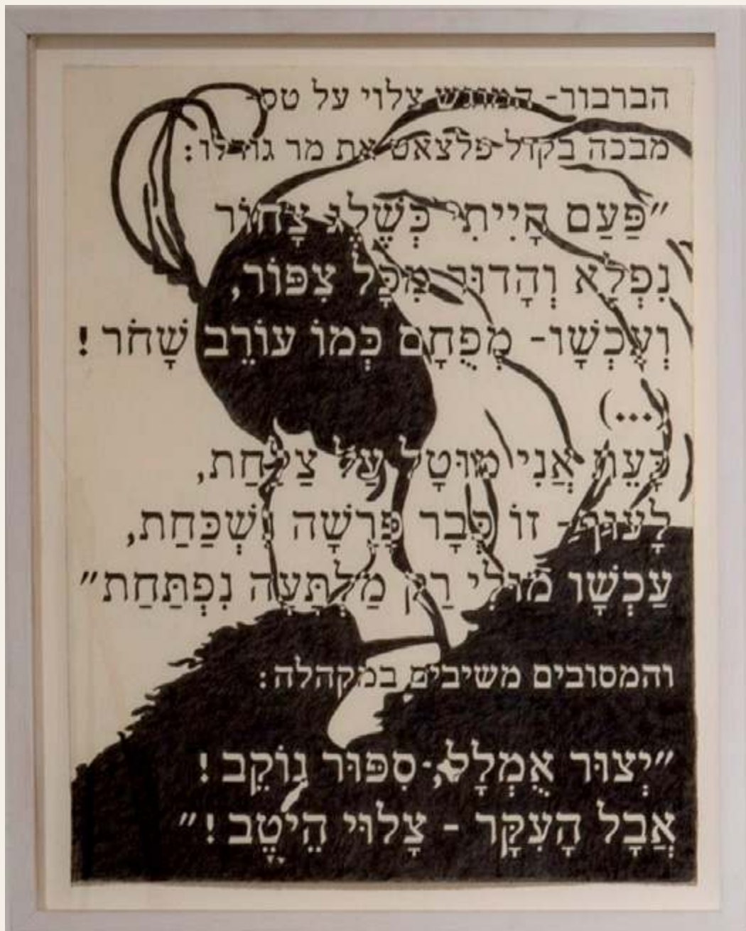
דגנית ברסט, בלדת הברבור הצלוי, מתוך "כרמינה בוראנה", עפרון על נייר, 50*65, 2016