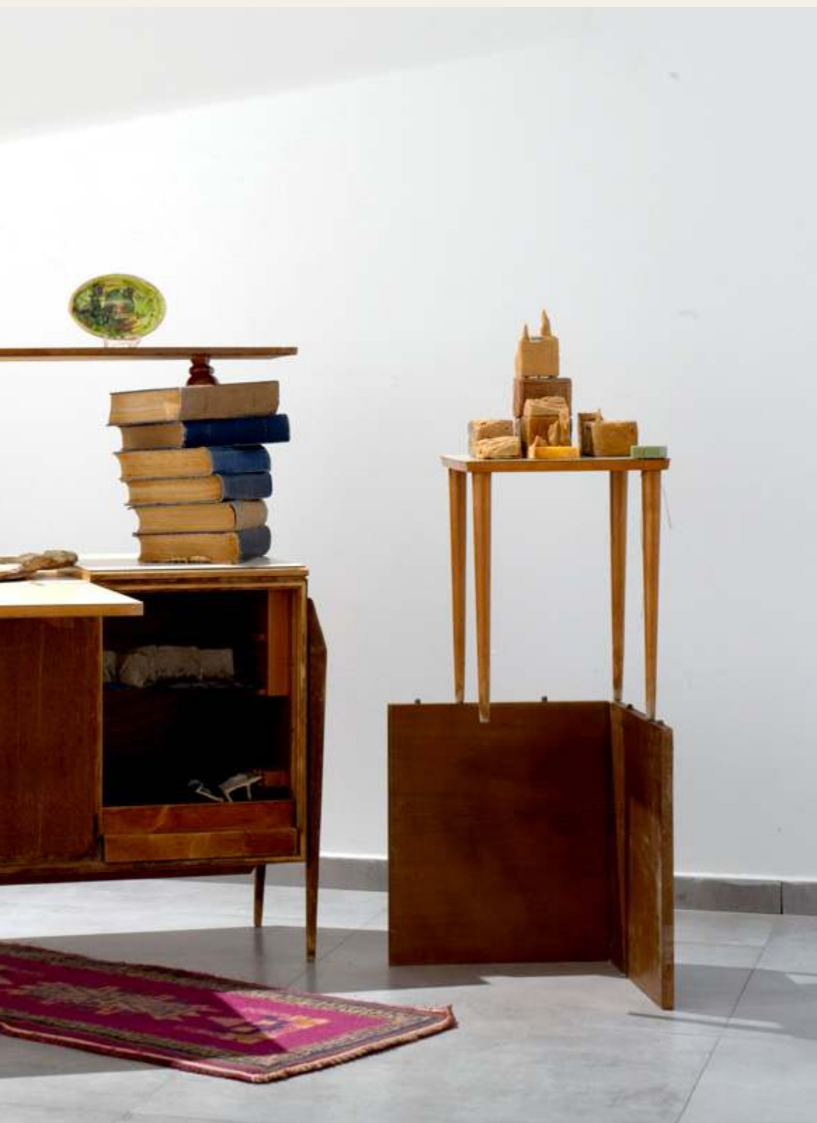
טליה טוקטלי, כ-ו-נ-נ-י-ת, on-call, מראה הצבה בחלל