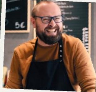
Soutien à nos commerçants et dynamisation centre-ville

Promotion de la lutte contre le harcèlement dans toutes nos écoles