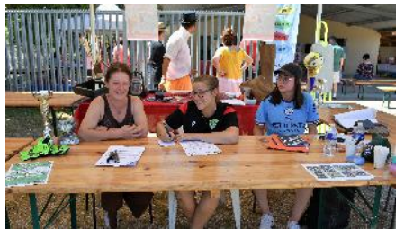
AS VLS FOOT