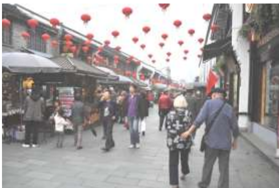
Shantang wandelstraat in Suzhou

Wij bezochten Suzhou en Hangzhou die een belangrijke rol gespeeld hebben in de geschiedenis van China en daar tot vandaag de erfenis van meedragen, en sloten af met het schildersstadje Fengjin .