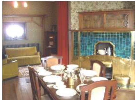
Art Nouveau-interieur van Henry van de Velde in de Villa Les Zéphyrus.