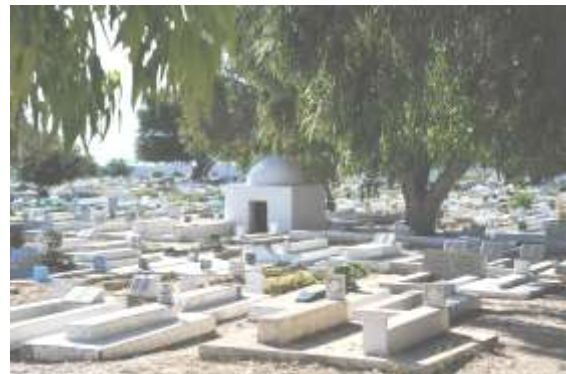
Kairouan: het kerkhof naast de moskee

over was- en strijkdienst. Tunesiërs zijn eerlijk... proper. Hammamet, waar vier sterren- hotel, met in de winter niet verwarmd en dus veel te koude buitenzwembad, maar ruimschoots gecompenseerd door tropisch deugddoend binnenzwembad, en jacuzzi en sauna en massagesalon (solo of zelfs duo) en stoombad en nog zoveel meer waar ik van Dani zelfs de prijslijst niet mocht van opvragen, was neergepoot, urbanistisch mooi verwerkt in de rest van het landschap (geen enkel van de meer dan honderd hotels is hoogbouw want bouwverordening eist dat kruin van bomen boven al de rest moet blijven uitsteken) staat numero uno op het lijstje van de place to be. Sousse en het bij Belgen veel beter gekende en geliefde Jerba maken het podium compleet. Hoofdstad Tunis? Historische site Carthago? Niet boeiend, niet interessant?