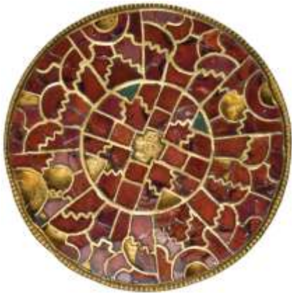
Salles mérovingiennes : fibule, Marilles (Brabant wallon), or et grenat, inv. B 787-7

qualité et d'un luxe exceptionnels, reflets de la vie de l'élite de l'époque. Deux caveaux ont été reconstitués, avec une mise en scène complète de la vaisselle des défunts. Des vitrines thématiques mettent en valeur des objets raffinés : verreries, céramiques et ivoires. On y aborde aussi les objets de la vie quotidienne, la toilette, les métiers, les armes et vêtements. Les croyances religieuses complexes de l'époque ne sont pas oubliées, avec les dieux locaux.