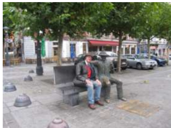
De auteur met Georges Simenon

(authentiek, niet neo) gotiek klooster en een schatkamer die wij mochten bewonderen. Wij reden langs nog andere merkwaardige kerken waaronder de Romaanse Sint-Bartholomeus, met een meesterwerk van de Luiks-Romaanse beeldhouwkunst: een doopvont in messing uit de 12 e eeuw, in één stuk gegoten. Luik was (en is) wereldberoemd om haar smeedkunst en haar vuurwapens. Wij kwamen terug op de Markt met het bekende Perron, een eeuwenoude zuil die de vrijheden van de stad verzinnebeeldt bovenop een fontein met op de top een pijnappel. Karel de Stoute , de hertog die (zoals wij uit de prachtige tentoonstelling Rogier Vander Weyden in Leuven leerden, in zijn grootheidswaanzin zijn Bourgondische erfenis verkwanselde) had de stad platgelegd en de vrijheidszuil naar Brugge overgebracht. Zijn opvolgster Maria liet hem terug brengen en sindsdien heeft hij de stad nooit meer verlaten. Hoe belangrijk het Perron voor de Luikenaars is, moge hieruit blijken dat het opgenomen is in het midden van het wapen van Luik. Niet ver van daar, op de Place du Commissaire Maigret staat een bijna even beroemd modern gedenkteken: de bronzen afbeelding van de bekendste Belgische detectiveschrijver Georges Simenon , vader van de wereldberoemde inspecteur Maigret op een zetel, met zijn spreekwoordelijke pijp in de mond.