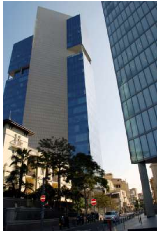
Hoogbouw in Tel Aviv

ontmoet er constant jonge, gastvrije mensen. Op de campus, ten noorden van de stad, vindt men het Eretz Israël- en het Diasporamuseum . Wie meer wil leren over de zionistische ondergrondse beweging, tippen we het Haganamuseum en uiteraard is het Tel Aviv Kunstmuseum met zijn impressionisten een must voor elke liefhebber. Overigens, in 2004 werd de buurt van Florentine door UNESCO opgenomen in de lijst van het Werelderfgoed. De voortreffelijke staat van 4000 strakke, witte en a-symmetrische Bauhausgebouwen is daar debet aan. De voornaamste winkelwandelstraat is Dizengolf St., tevens het geografisch hart van de stad. Genoemd naar de eerste burgemeester van Tel Aviv.