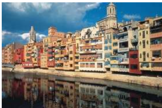
Le long du riu Onyar

Notre nouvel hôtel est l'hôtel AC Palau de Bellavista, qui mérite bien son nom car il offre une splendide vue sur la ville. Ce très bel établissement 5 étoiles offre un minibar et la presse à ses clients, et est situé à 12km de l'aéroport où atterrit Ryanair. Des réductions sont offertes hors saison. L'adresse : Pujada Polvorins 1 – site www.ac-hotels.com .