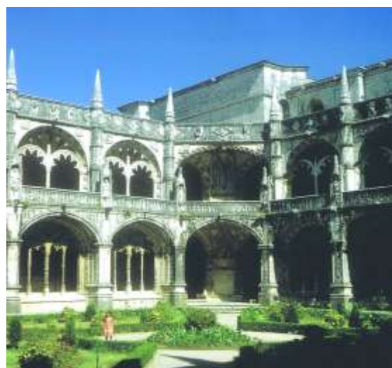
Le cloître du monastère

avait été formé dans le style gothique de son pays. Boytac était déjà l'architecte de João II. Le roi D. Manuel le chargea de la construction du monastère. Pendant tout le règne du roi D. Manuel, Boytac sera un des grands maîtres des travaux royaux. Les travaux du monastère commencèrent en 1502. Boytac a dirigé les travaux jusqu'en 1516 et c'est à lui que nous devons le plan de l'église, son cloître et les dépendances. Boytac quitta Belém en 1516 pour aller à Batalha. En 1517, João de Castilho est à la tête des travaux. Les richesses apportées de l'Extrême-Orient par les vaisseaux portugais ont permis au roi la construction de l'un des plus beaux témoignages de la gloire manuélín. João de Castilho eut comme principal collaborateur le sculpteur et architecte français Nicolas Chanterène, formé en Italie. Pendant le règne de João III, sous la direction d'un nouvel architecte, l'espagnol Diogo de Torralva, s'amorça le déclin du style manuélín. Le XIX e siècle apporta son amour du pastiche, allié à une regrettable incompréhension du style manuélín.