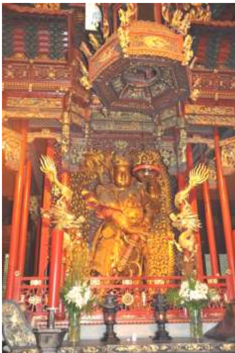
Hangzhou, een oeroud beeld in Lingyin kloostertempel

bekendheden (zoals een courtesane uit de Mingtijd) en kunstenaars hun verblijf hadden - er stonden theehuisjes, tempels en talrijke sierlijke bruggetjes, waarvan een groot deel, zij het vervallen, behouden bleven. In 2002 heeft de stad een groot-scheeps renovatieplan opgezet om met de hulp van kunsthistorici, landschaps-planners en architecten, de straatjes, waterwegen en monumenten te herstellen, of nauwkeurig weder op te bouwen aan de hand van oude documenten.