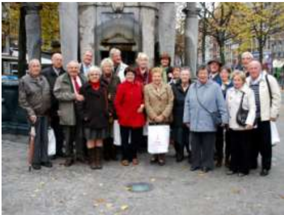
De deelnemers

leden van onze delegatie even goed te been waren, hadden de organisatoren voor een toeristisch treintje gezorgd dat ons tijdens een dik uur kennis zou laten maken met alle merkwaardigheden (en die zijn er veel!) van de stad. Vooraf werden wij warm onthaald door het Office de Tourisme (92, rue Féronstrée) dat voor een mooie inleiding zorgde. Gewapend met brochures reden wij dan met een leuk treintje vanaf het Sint-Lambertusplein, de bakermat van Luik, door de oude wijken en de kronkelende straatjes van de middeleeuwse stad, waarbij in perfect Nederlands (een pluimpje voor de toeristische diensten van Luik!) commentaar gegeven werd bij de voornaamste blikvangers van Luik: het paleis der prins-bisschoppen, herhaaldelijk vernield en in brand gestoken, en telkens weer uit de as herrezen.