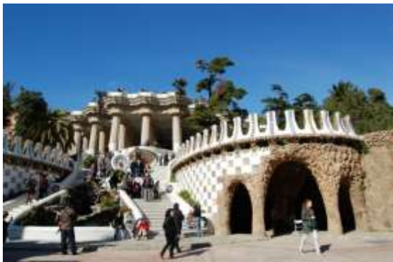
Le parc Güell

piscine (non chauffée) et une grande terrasse panoramique, d'où l'on admire toute la ville, sont quelques atouts, avec le copieux petit déjeuner et les fruits frais ! Un circuit en bus nous permet de découvrir plusieurs quartiers dont celui de Montjuïc , qui se caractérise par ses fabuleuses vues sur la ville que l'on a du sommet de la colline. Les bus 13 et 61 conduisent aux principaux sites. Un funiculaire relie la station de métro Parallel et la fête foraine. Un autre rejoint la citadelle. Parmi les attractions touristiques, on découvre la fontaine magique, le musée-fondation Miro, le musée archéologique, le Palau Nacional (la plus belle collection d'art roman d'Europe), et le Poble Espanol, un ensemble architectural très bien conçu. C'est un tour des villages d'Espagne en une matinée, avec un artisanat très authentique. On y trouve aussi l'imposant musée de l'art catalan , et, devant ce grandiose édifice, la fontaine magique, avec son spectacle son et lumière gratuit qui se déroule du jeudi au dimanche de 22 à 24h. A voir absolument !