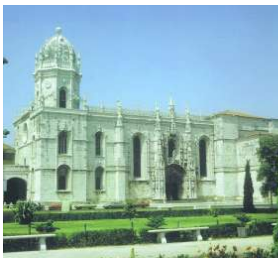
Le monastère des Jeronimos

Belém a été construit au pied de la colline du Restelo, sur la berge du Tage. Le quartier est célèbre par le chef-d'œuvre de l'art manuélín, le monastère des Jerónimos. Ce monastère appartient aux chanoines hiéronymites de l'ordre de Saint-Jérôme. C'est incontestablement l'édifice le plus exceptionnel de Lisbonne.