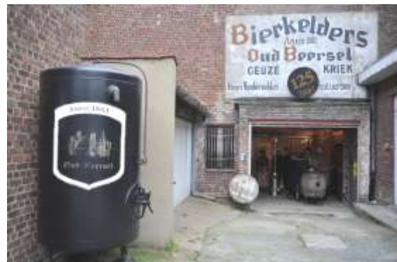
De brouwerij

warmte straalt ons tegemoet: warmte van een gedreven spreker (en men heeft ondertussen ook een straalkachelte aangesleept). Oud Beersel werd in 1882 opgestart en onze Gert belichaamt de vierde generatie. Het strookt niet helemaal met de waarheid want oorspronkelijke familie heette Van der Velde of iets dergelijks en in 2002 is de brouwerij gestopt. Maar enkele maanden daarvoor kwam onze Gert met zijn pa hier af en toe enkele flessen kopen en op 25 jarige leeftijd vertelde de brouwer hem dat hij zonet zijn laatste flessen had ingeslagen. RIP voor de brouwerij. Gert onthutst. Oude brouwer was wel 77 maar een brouwerij stop je toch niet? Sluiten doe je niet. Je zorgt voor opvolging! Niet dus. Brouwerij zou binnen enkele weken later dichtgaan en Gert kwam hier stande pede gratis helpen. Oogjes open en snaveltje dicht en maar wijsheid opsteken. Nog geen twee jaar later, amper 27 stichtte hij een BVBA om de brouwerij over te nemen en van de ondergang te redden. Zijn eerste bier?