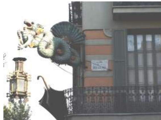
Promenade dans les ramblas