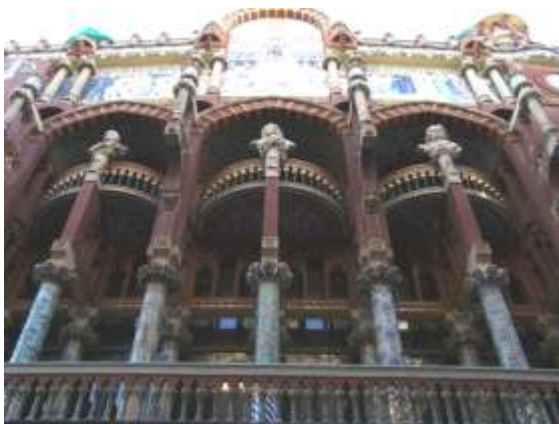
Le Palais de la musique

Les ramblas sont réputés pour l'animation qui y règne. Une partie est réservée aux marchands de fleurs. A son extrémité se dresse la colonne de Christophe Colomb qui marque le lieu où le navigateur débarquait en 1493 avec les 6 Indiens qu'il ramenait des Caraïbes. On peut monter les 60m en ascenseur pour admirer la vue panoramique.