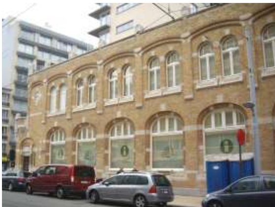
Exterieur van de Oude Post (nu Dienst voor Toerisme en het nieuwe museum Kusthistories) in de badplaats Middelkerke.

Op vrijdagavond 30 oktober 2009 werd in het Casino van Middelkerke het nieuwe museum “Kusthistories” officieel geopend met een feest in retrostijl. Het museum heeft als thema “een dagje-aan-zee” en heeft het Belgische (sommigen noemen het verkeerdelijk “Vlaamse”) kusttoerisme als onderwerp. Dit boeiende museum is gevestigd op het gelijkvloers en de eerste verdieping van de volledig gerestaureerde Oude Post (Joseph Casselaan 1), in het centrum van de badplaats Middelkerke. De toegang bedraagt 2€ (of reductie 1€) en is dagelijks (behalve ’s maandags) geopend (1/09 tot 30/06 van 9.30-12u en 13.30-17u; 1/07 tot 31/09 van 9 tot 18u). Tegelijkertijd werd in dezelfde Oude Post op het gelijkvloers de nieuwe toeristische infobalie van Middelkerke geopend.