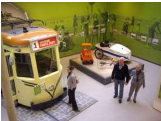
Een kijkje in het nieuwe museum “Kusthistories” in de badplaats Middelkerke.

van de Velde (toparchitect van de Art Nouveau in ons land) krijgt men hier een kijk op het vakantiegebeuren van een rijke Gentse doktersfamilie omstreeks 1930. Ook de historiek van Westende-Bad komt aan bod: architect Otlet stichtte in 1898 de NV La Westendaise en daarna groeide de badplaats planmatig en razendsnel tot de “ Plage de l'Elite ”. De Villa Les Zéphyrs dateert uit 1922 en is gelegen tegenover de tramhalte (het oude tramhuisje is echter afgebroken!), Henri Jasparlaan 173 in Westende (tel.059/300640). Men kan de villa ook met een gids bezoeken. Zelfde toegangsprijzen als het nieuwe “Kusthistories”.