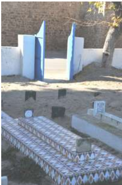
Kairouan: het kerkhof

goedkeurende blikken uit de groep. Met Blankenberge-gelijkend pleziertreintje naar historisch centrum. In Blankenberge rijdt ie op de dijk maar hier gewoon op de rijweg. Hevig slingerend, af en toe bijna kantelend als een vluchtheuvel ongelijk wordt aangesneden. Doorheengeschud maar heelhuids afgezet aan Medina. Zoals alle Medina's of oude Afrikaanse binnenstadjes een wirwar van steegjes en GSM moet meermaals redding brengen om de groep terug op het spoor te komen. Twee onhebbelijkheden hebben daar conto aan: elk portiekje, elk scharniertje, elk deurtje en elk poortje heeft op mij een onbedwingbare aantrekkingskracht. Ze moet open en ik moet ontdekken wie of wat zich daarachter verborgen houdt. Heb ik van vader. Als hij op bezoek komt moet ik niet alleen het huis een grondige beurt geven (die test neemt mams op zich) maar laden en schuiven worden bij wassen van handen net iets tè per ongeluk aan controle onderworpen.