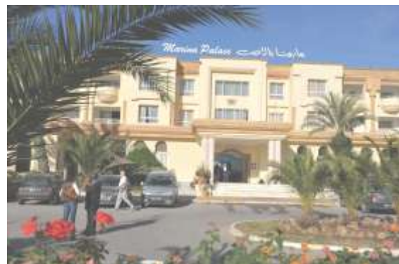
De Marina Palace in Hammamet