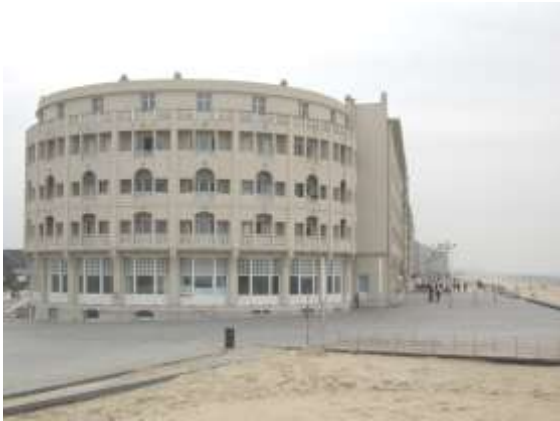
Het prachtige Rotonde/Belle Vue in Westende-Bad.

cheling was groot... noch de sfeer, noch de inrichting kon ons bekoren. Wij vonden het vroeger zelfs beter, en van luxe gesproken ... dat is toch ver te zoeken... tenzij de prijzen. Gelukkig dat het exterieur overeind is gebleven!