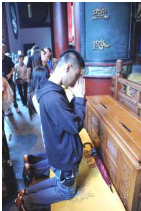
Hangzhou: jongeren bidden in de boedistische tempel

maanden met de boot; met het vliegtuig is het merklijk duurder en loont het de moeite niet). Een welkomdiner in het Crown Plaza ***** hotel en een nachtshow ( ERA , een mengeling van Oost en West met acrobaten, klassieke en moderne dansen en Chinese opera) in het cultuurcentrum op de oevers van het Jin Ji -meer, sloten deze boeiende dag af (*). Waarna wij een verdiende rust genoten in het elegante Shangri-La *****hotel. Het Venetië van China mag dan al een antieke stad zijn, het telt onder de modernste en meest comfortabele hotels die wij ooit bezochten (prijs standaard kamer : 800/850 rmb (ongeveer 85 €).