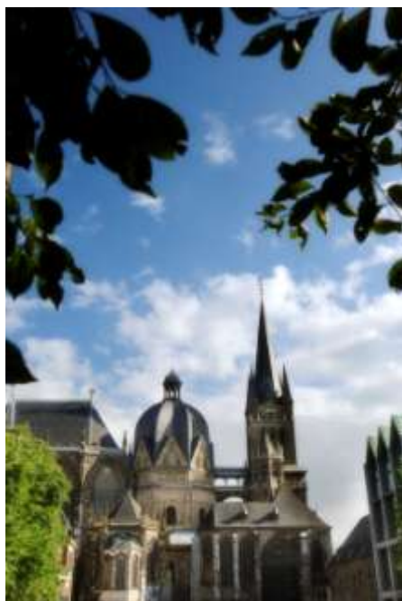
Vue sur la cathédrale

Au triangle des trois frontières, Aix-la-Chapelle, d'origine celte, station thermale romaine et résidence impériale de Charlemagne est une vieille ville séduisante, agréable et d'un charme particulier, un enchantement de fontaines, de sculptures en bronze, de trésors et monuments artistiques, de ruelles aux multiples recoins. L'ambiance d'Aix-la-Chapelle est unique, autour de la cathédrale , un des fleurons de l'architecture occidentale et de l'hôtel de ville gothique. Peu avant 800, l'empereur entreprend la construction d'une basilique octogonale sur le modèle des églises de l'Empire romain d'Orient, un des premiers grands édifices à coupole construit au nord des Alpes.