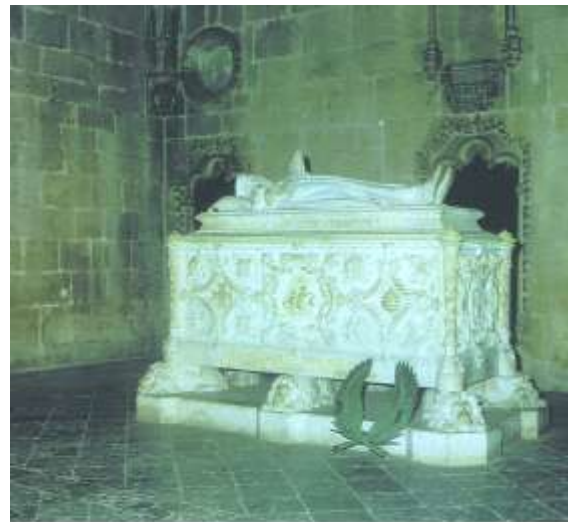
Le mausolée de Vasco de Gama

qui monte à l'assaut des pierres comme un lierre qui défie le temps. A la galerie supérieure, João de Castilho est déjà plus ouvert à l'esprit de la Renaissance avec des formes simples et aérées. Pour le touriste pressé, le cloître est une belle cour intérieure, morte et digne d'un musée. Il faut y faire revivre les hommes qui le peuplaient jadis. Le cloître devient alors un espace de vie monacale. La destination principale du cloître était de servir d'espace de lecture. Cette lecture était avant tout une lecture sacrée, les textes des Pères de l'Eglise et leurs commentaires bibliques.