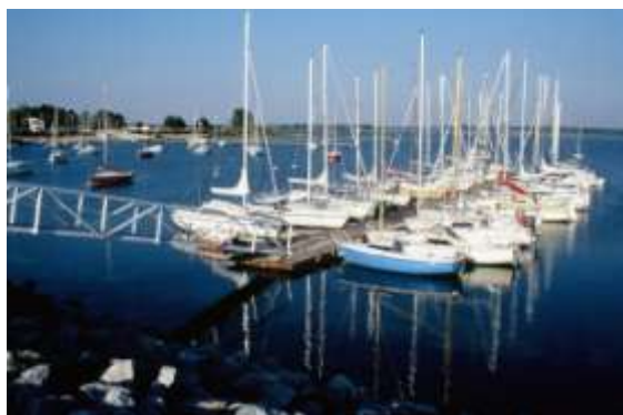
Le port de Giffaumont sur le lac

Info : Musée de Sainte-Ménéhould - Mikael Schüller, tél. 03 26 60 66 45 musee@ste-menehould.fr