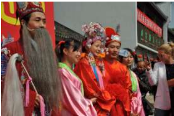
Leuke ontvangst in waterstadje Fengjin

nabije Sjanghai. Zij werd 2.200 jaar geleden gesticht door de eerste keizer van China, de formidabele Quin Shi Huang (van het bekende reuzengraf met de terracotta krijgers) maar kreeg pas onder de Sui -dynastie (10 e eeuw) haar huidige naam (letterlijk, de stad die slechts met de boot bereikbaar is); zij groeide uit tot een belangrijk handelscentrum dat tweeënhalf miljoen inwoners telde toen zij de residentie werd van de Songkeizers (1129); toen Marco Polo (1290) de stad bezocht, hadden de invallende Mongolen heel wat verwoestingen aangericht; toch noemde hij haar de “schitterendste stad ter wereld”.