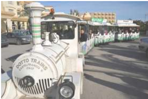
Rondrit met een toeristisch treintje

Kaarten wordt universeel op dezelfde wijze gespeeld! De twaalfde komt diep buigend naar mij en mijn bewaker toe geslopen en nodigt mij vriendelijk uit voor de koffie. Ik wilde al gretig toehappen toen ik beduimd en vol spinrag aan de muur iets ontwaar dat verdacht veel op een prijslijst lijkt... . Opeens ben ik zeer gehaast en meer geïnteresseerd in de Romeinse beelden die onze Roemeen overal liet neerpoten. Mooi huis. Architect Frank Wright noemde het het mooiste huis dat hij ooit had gezien. Ook geschiedkundige waarde want midden in WO II moest onze Roemeen ijlings vluchten naar de VS en Rommel, de Woestijnvos heeft er dan maar zijn kampement in opgeslagen. 's Zomers vinden er geregeld toneeluitvoeringen plaats maar nu moet ik mij tevreden stellen met een kleine totaal verwaarloosbare glastentoonstelling. Dus toch Centre Culturel!