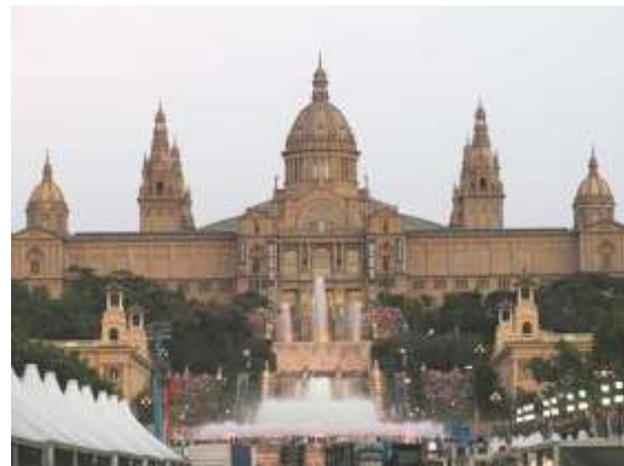
Le musée de Montjuïc

J'aimerais vous présenter cet artiste dont j'admire les œuvres, tout comme Calatrava, autre architecte de Valence à l'imagination sans limites. La Catalogne inspire les artistes ! Né à Reus dans la province de Tarragone, en 1852, il a marqué la Catalogne.