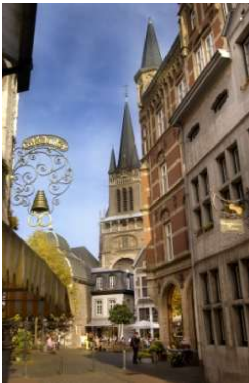
L'agréable zone piétonne

Flâner dans la zone piétonne , autour de la cathédrale et de l'hôtel de ville, est une véritable expérience. On y trouve des magasins luxueux et des petites boutiques charmantes. S'installer chez Leo van den Daele , un des plus beaux cafés des années 1890 et savourer café, gâteaux, une cuisine légère et excellente dans le style de l'époque. La « Ponttor » fait partie des rares portes de la ville qui existent encore. Depuis le 14 e siècle, cette porte accueille par le pont d'entrée et la basse-cour les visiteurs de l'ancienne ville impériale. De nombreux musées présentent des collections allant du Moyen-Age à l'époque moderne.