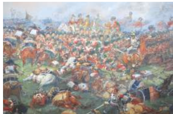
Détail de la toile.

spécialisées ? La toile du panorama érigé en 1912, situé route du Lion, sur le côté Braine-l'Alleud de la chaussée, est dans un état de conservation exceptionnel car elle n'a jamais voyagé, contrairement à ses consœurs en Belgique et ailleurs. Elle est aussi unique au monde par le fait que tous ses éléments sont d'époque et complets : bâtiment, velum, faux terrain, objets, soldats, chevaux gisants et autres artifices qui en font « un témoin exceptionnel de la saga des panoramas » comme le souligne l'auteur, Isabelle Leroy, dans ce superbe ouvrage coédité par la Commission royale des Monuments, Sites et Fouilles de la Région wallonne et l'asbl Bataille de Waterloo 1815. Le livre retrace la naissance des panoramas dans leur contexte historique, étudie le phénomène globalement et décrit enfin en détail le panorama de la bataille du 18 juin 1815.