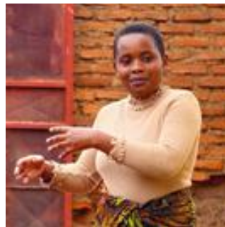
Ein Mitglied der TAHOCO beschrieb die Bedeutung der Wohnungsgenossenschaft für ihr Leben.