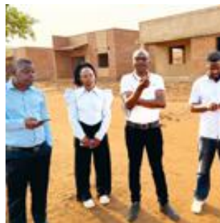
Mitarbeitende der Partnerorganisation CCODE

Für die nächste Phase ist der Bau von 180 neuen Häusern geplant sowie die Sanierung bestehender Häuser.