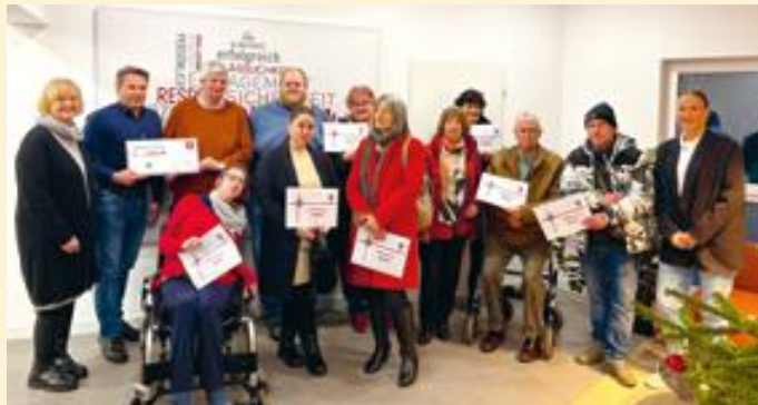
Erfolgreiche RBS-Mieterbefragung mit Mehrwert: Glückliche Gewinner:innen freuten sich über ihre Preise – Spendenscheck ging an die DESWOS

Die Rheinisch-Bergische Siedlungsgesellschaft mbH (RBS) unterstützte die Arbeit der DESWOS in 2025 mit einer besonderen Aktion: