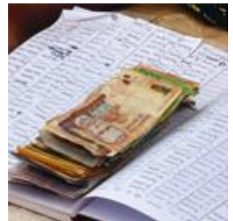
Die Mitglieder treffen sich regelmäßig und zahlen die vereinbarte Kreditrate zurück.