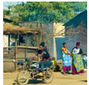
Alltagsszene im Slumviertel Chinsapo