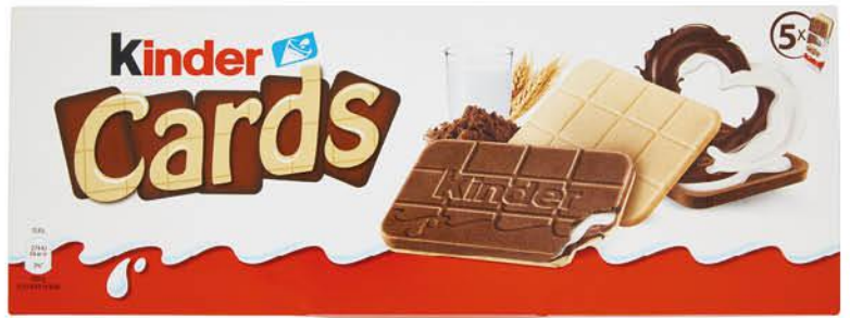
FERRERO KINDER CARDS 5 PEZZI