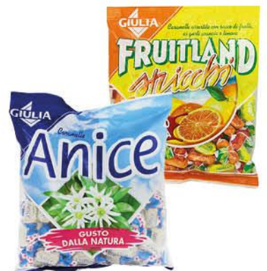
LA GIULIA CAREMELLE VARI GUSTI 300 G