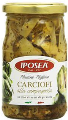
IPOSEA CARCIOFI ALLA CAMPAGNOLA 290 G