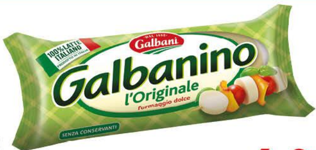
GALBANI GALBANINO L'ORIGINALE 850 G