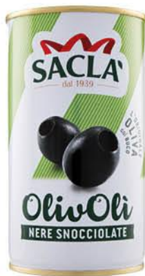
SACLA OLIVOLI OLIVE NERE SNOCCIOLATE 330 ML