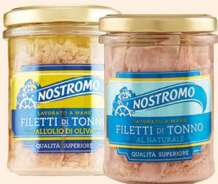
NOSTROMO FILETTI DI TONNO AL NATURALE/ IN OLIO DI OLIVA 180 G

ROBERTO PANE A FETTE BIANCO/INTEGRALE 400 G