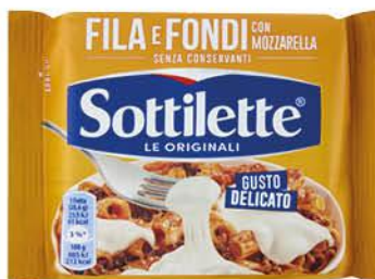
SOTTILETTE FILA E FONDI 200 G