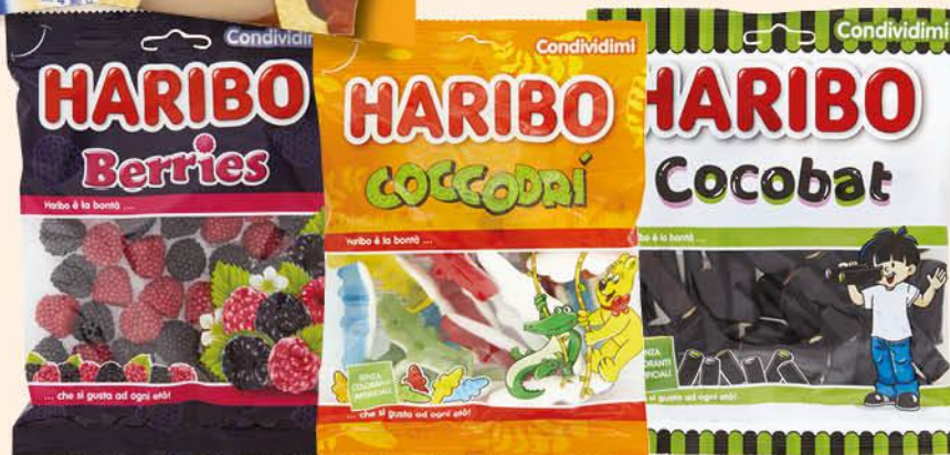
HARIBO CAREMELLE VARI GUSTI 150/160/175 G