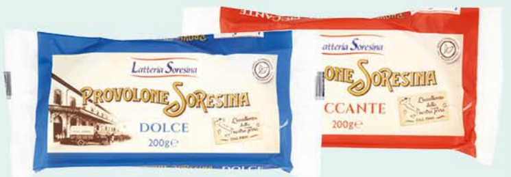
LATTERIA SORESINA PROVOLONE A FETTE DOLCE/PICCANTE 200 G