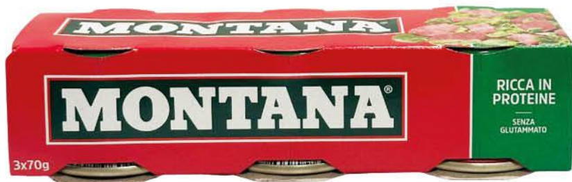
MONTANA CARNE IN GELATINA 70 G X 3