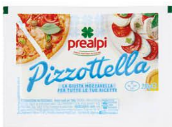
PREALPI PIZZOTTELLA 250 G