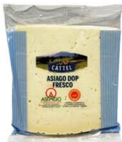
CATTEL ASIAGO DOP 250 G