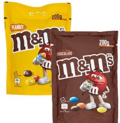
M&M'S ARACHIDI/ CHOCO 200 G