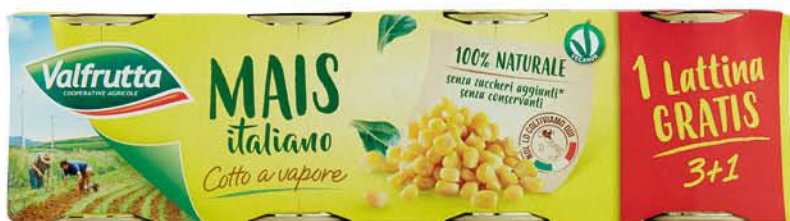
VALFRUTTA MAIS COTTO A VAPORE 160 G X 3 + 1 GRATIS