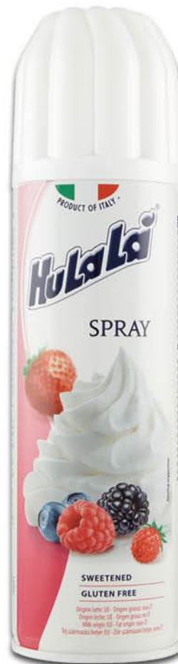
HULALÀ PANNA SPRAY 250 ML