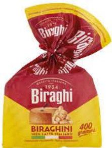
BIRAGHI BIRAGHINI SOTTOVUOTO 400 G