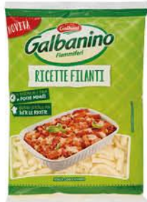
GALBANI GALBANINO FIAMMIFERI RICETTE FILANTI 150 G