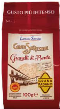
LATTERIA SORESINA GRANELLI DI GRANA PADANO 100 G