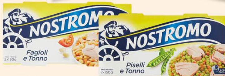
NOSTROMO TONNO E FAGIOLI/ TONNO E PISELLI 150 G X 2