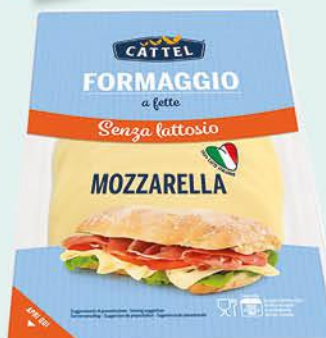
CATTEL FORMAGGIO A FETTE SENZA LATTOSIO MOZZARELLA/ PROVOLA AFFUMICATA 150 G